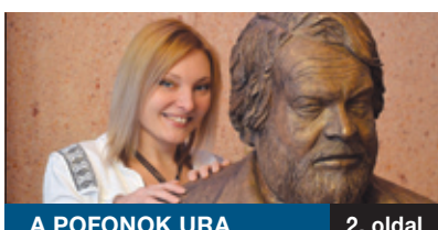
A POFONOK URA