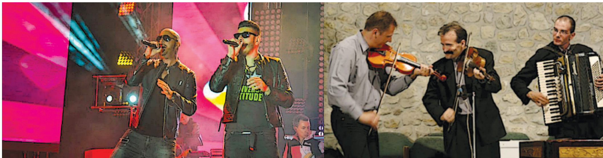
Tavaly a Beatrice fellépése vonzott hatalmas tömeget, idén a TNT és a Csík zenekar lesz a sztárvendég

Szeptemberi Kóstoló helyett Bókay-kerti Napok