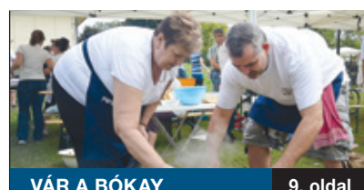
VÁR A BÓKAY

KÉT KORÁBBI FÖLDŰT KAP aszfaltburkolatot: a pestszentlőrinci Csörötnék utca és a pestszentimrei Szóvet utca. Az önkormányzat útépitési programja során megoldják a vízelvezetést, és modernizálják az utcát. Kucsák László országgyűlési képviselő közreműködésének köszönhetően a következő években a kormány támogatásával felgyorsulhatnak a fejlesztések.