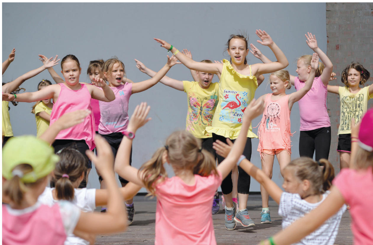
Az önkormányzati napközis tábor turnusaira keddenként lehet jelentkezni

Több száz gyerek vett részt már az első két turnusban az önkormányzat június 26-án megkezdődött napközis táborában, amelynek évtizedek óta a Bókay-kert ad otthont. A bázisnak számító parkban is számos érdekes program és játéklehetőség foglalja le a gyerekeket, de a szervezők minden évben törekednek arra, hogy a táborozók ne egy helyben töltsék el a napot.