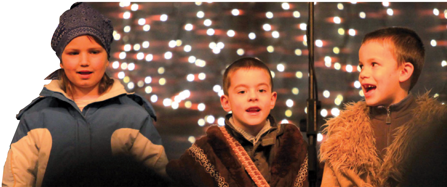
Az elmúlt esztendőhöz hasonlóan a vásár mellett korcsolyapálya és színes programok várják majd a kerületi polgárokat