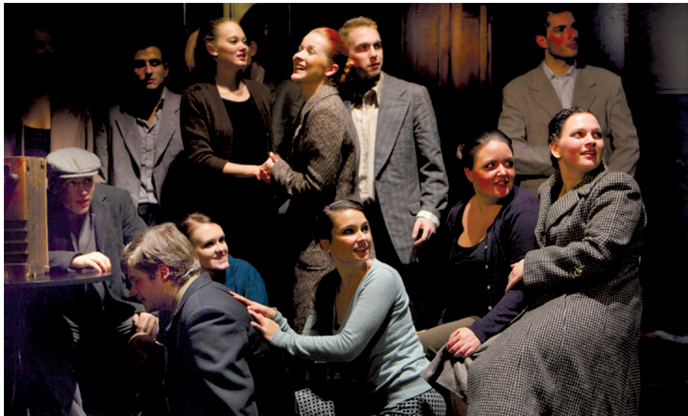
A Górnagy Mária Színitanoda növendékeinek előadásai érdekesebbé teszik a kötelező olvasmányokat