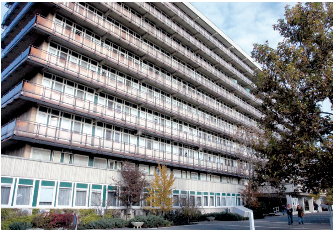
Várhatóan 2013 első negyedévének végén értékelni fogják a kórházak igénybevételének mértékét

– A tisztifőorvosi rendelet egy átmeneti állapotot teremtett, amely tulajdonképpen kedvezőbb a betegek számá-