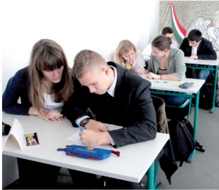
Az ország különböző részeiről 44 csapat érkezett a versenyre

A Kerületi Diáknapi programjaként szervezett Haza és Haladás országos történelmi tanulmányi versenyen mérték össze a tudásukat az általános iskolák nyolcadikosai és a középiszkolások november 9-én a Pestszentlőrinc-Pestszentimrei Felnőttek Gimnáziuma és Továbbképző Központjában. Az idei megmérettetésen a Bókay Árpád Általános Iskola csapata vitte el a pálmát.