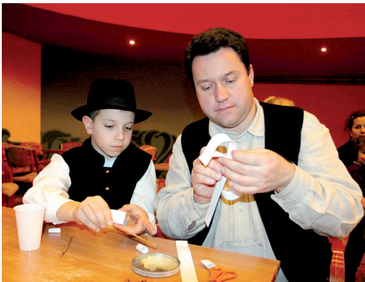
A Civil Mustra résztvevői nem csupán kiállították portékáikat, hanem közösen alkottak, festettek

Hajléktalan gyermekek számára közösen varrtak takarót