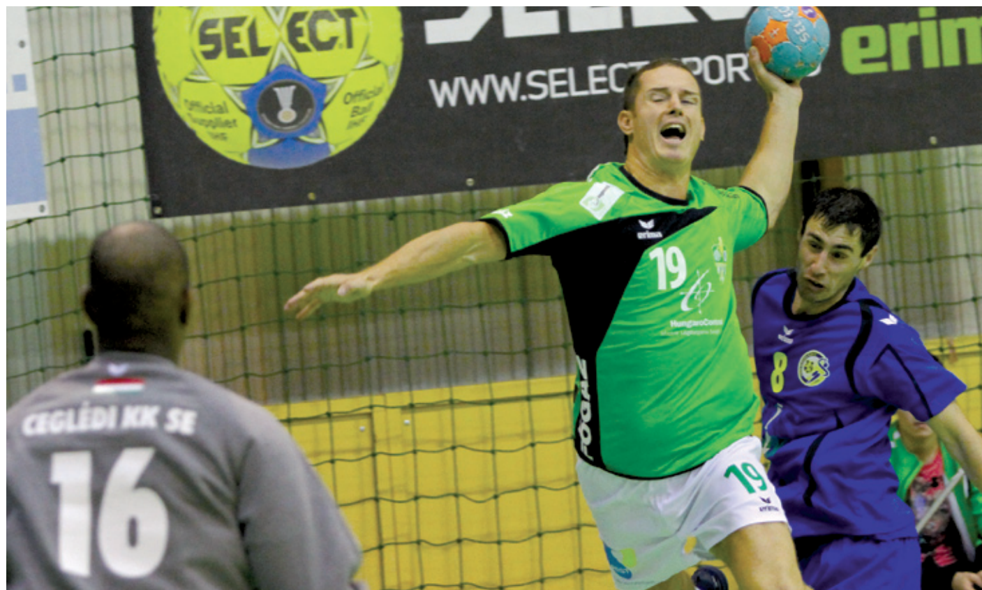
A ceglédiek 8 gólos legyőzéséből a fiatalok is kivették a részüket