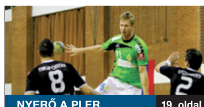
NYERŐ A PLER

Átmenetileg kivételesen kedvező helyzetben vannak a XVIII. kerületi betegek: ha szakorvosra van szükségük, több intézmény kínálatából is választhatnak. Egyelőre nem kell váltaniuk tehát azoknak, akik a kórházi ellátási területek változása után is ragaszkodnak eddigi orvosukhoz. Maradhatnak a jól bevált Dél-pesti Kórháznál, vagy mehetnek a IX. kerületbe is.