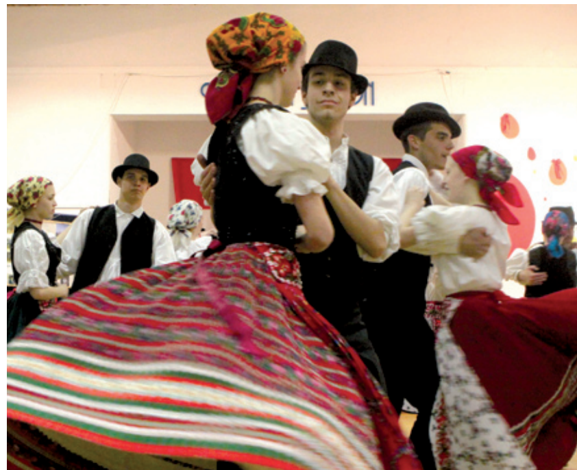
A határon túl élő magyarok bemutatói mindig sok érdeklődőt vonzanak

Az eseménydús őszt immár a karácsonyra készülnek közösen az Üde Színfolt Egyesület tagjai. Az adventi időszak kezdetétől a családokat várják a programjaikra, amelyek egyszerre kínálnak zenét, hagyományokat, irodalmat és persze finom falatokat.