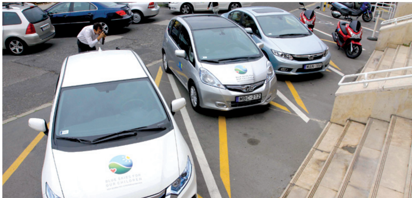
Nemcsak a környezetet kímélik a hibridautók, hanem gyorsak és elegánsak is

tóképviselete így tájékoztatta a Városhatározatot: