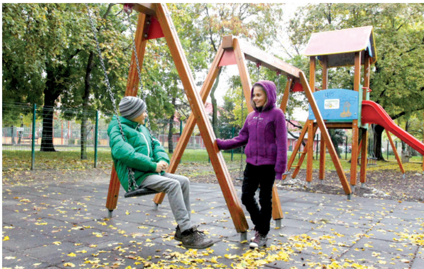
A gyermekek biztonsága érdekében a játszótéereket két évente kötelező hatóságilag is bevizsgáltatni

A városgazdálkodó divízió munkatársainak feladata a terv-