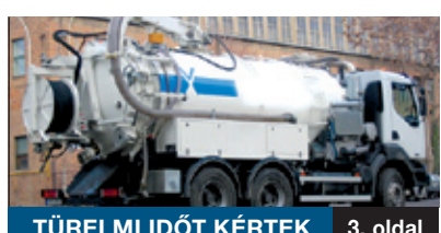
TÜRELMI IDŐT KÉRTEK 3. oldal

Az új 1956-os emlékmű ugyancsak a nemzeti összetartozás jelképe szeretne lenni. F. Kovács Attila Kossuth-díjas szobrász egy kis kockákból összeálló hatalmas kockát tervezett ide. A kockák az egykor a kerület utcáit fedő bazaltkövekből ke-