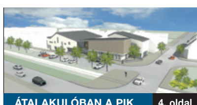
ÁTALAKULÓBAN A PIK 4. oldal

A képviselő-testület azzal a kéréssel fordult a Fővárosi Önkormányzathoz, hogy módosítsa a szennyvízszállításról szóló rendeletben az ivóvízfogyasztás alapján történő elszámolás bevezetésének 2013. március 1-jei határidejét. Türelmi időt kértek addig, amíg nem alakulnak ki az érintett ingatlanok közcsatornára csatlakozásának a műszaki feltételei.