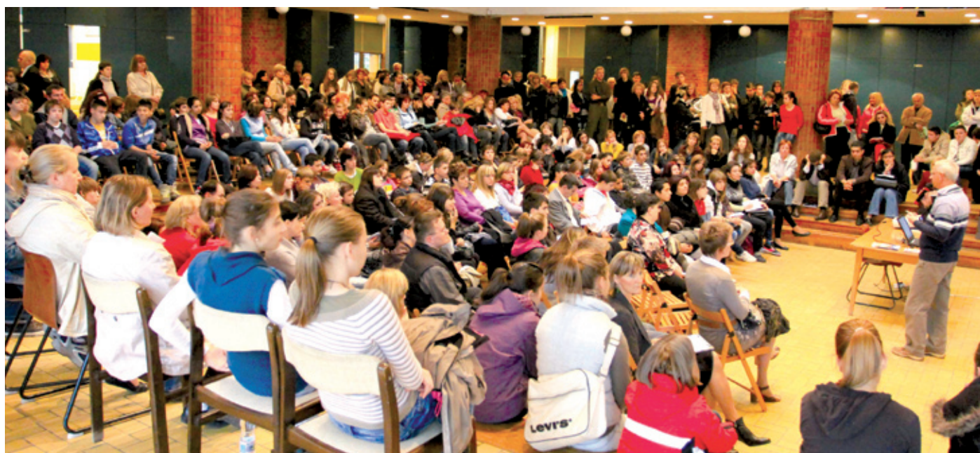
A Karinthy gimnáziumban évről évre több diák vesz részt a pályaválasztási anketon

Pedagógiai és pályaválasztási napok a kerületben