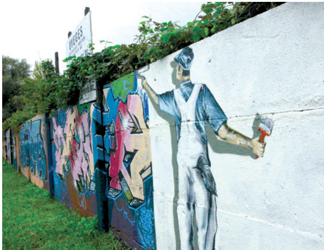
Ezek a falak egy folyamatosan frissülő utcai galériát képeznek

A szabadfalakon látható graffitik nem csupán tagek, firkák vagy vicces feliratok. Ezek a falak egy folytonosan frissülő utcai galériát képeznek, ahol a firkászok legálisan készíthetik el rajzaikat. Egy-egy ilyen kép megszületését komoly tervezés előzi meg egyszerű papír vagy számítógépes programok segítségével. Itt lehetőség van igényesen, idővel és kannával sem spórolva készíteni a műveket. Budapest legismer-