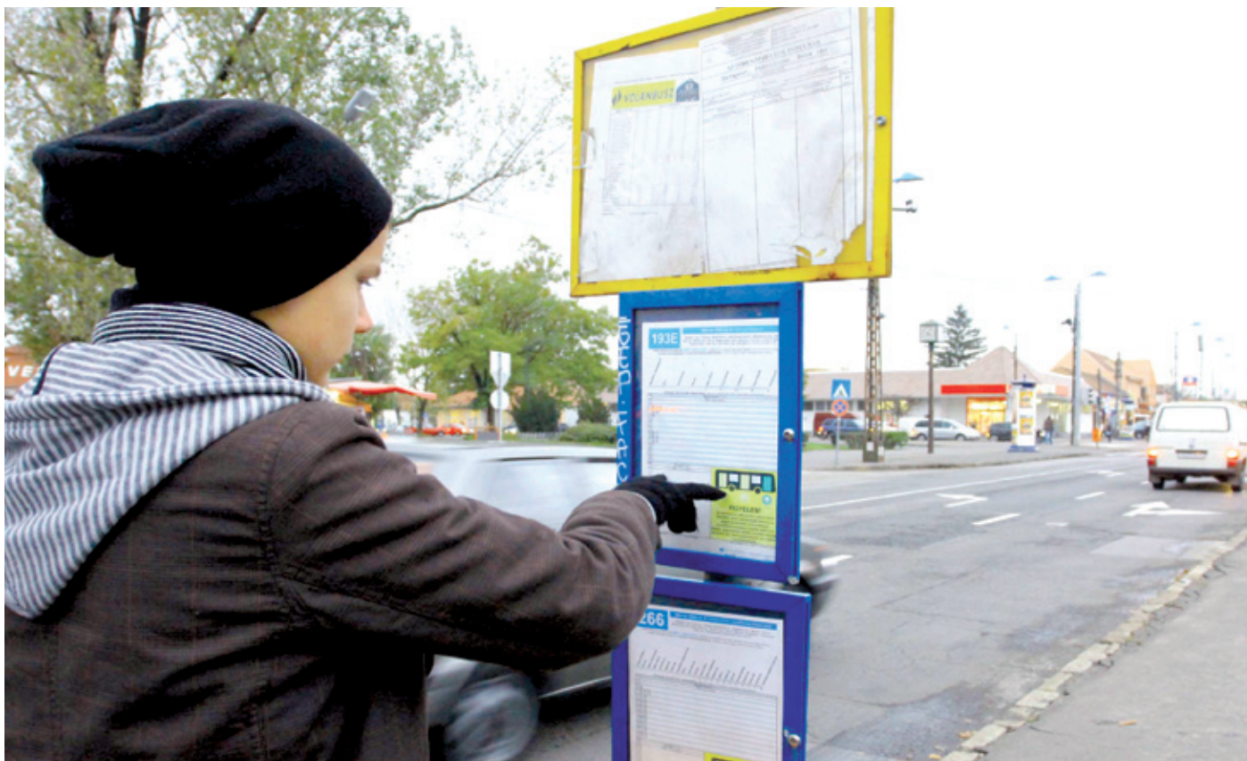
Könnyebb lett a tömegközlekedés a kerületben, a változásokat érdemes megismerni

Fellelégezhetek a busszal közlekedők: a BKK október 1-jétől több, a kerületet érintő buszjárat követési idejét sűrítette a hétfői napokon. A korábban szombaton és vasárnap változó sűrűséggel járó 54-es busz azóta egységesen 30 percenként, az azelőtt hétfőn óránként induló 55-ös pedig ugyancsak félóránként jár. A sűrítéssel a két járat közös szakaszán, Pestszentimre és a Boráros tér között így már 15 percenként