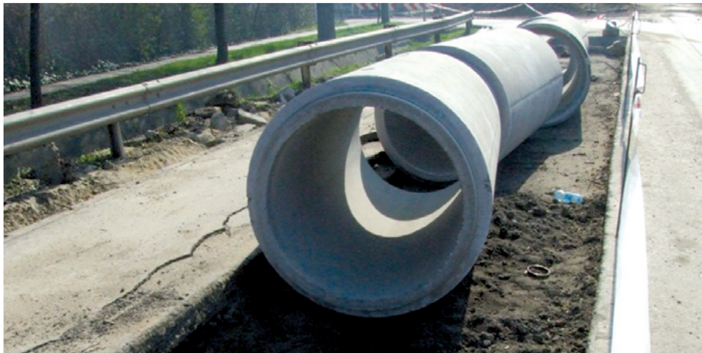
Az ivóvízfogyasztás alapján történő elszámolással megvárnák a csatornázást

hogy az Európai Unió a pénzübeli kiadásokat utólag 100 százalékban megtéríti, az önrészt pedig – amely egyébként a teljes RE-Block projekt 30 százaléka – az önkormányzat a befektetett munkájával biztosítja.