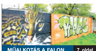
MŰALKOTÁS A FALON 7. oldal

Újabb állomáshoz érkezett a Pestszentimre városközpontját megújító fejlesztéssorozat, megkezdődhet a Pestszentimrei Közösségi Ház (PIK) felújítása és fejlesztése. A BKV-val még folynak az egyeztetések, az OTP-vel pedig úgy állapodott meg az önkormányzat, hogy a bankfiók a felújítás idejére a Kisfaludy utca 68/b alatti Imre-Pontba költözik.