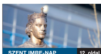
szent imre-nap 12. oldal

A graffitit a legtöbben elítélik, de vannak, akik műalkotásnak tekintenek rá. Büntetendő, a terjedése mégis megállíthatatlan. Az illegális életi, mégis a törvényes keretek között válik értékessé. Bemutatjuk azt a helyet a kerületben, ahol nem tiltják, hanem még örülnek is egy-egy ilyen alkotásnak, mert a művek színesítik a környezetünket.