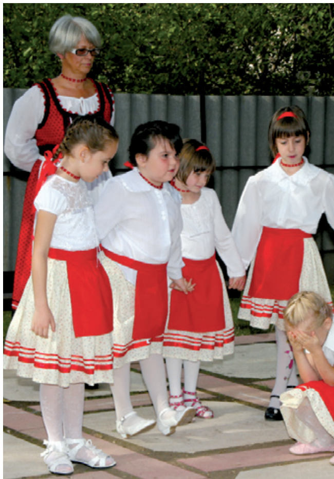
A jubileumon támcólva ünnepeltek az óvodások

Hatvanadik születésnapját ünnepelte a Zöld Liget óvoda szeptember 28-án az Ady Endre utcai épület udvarán.