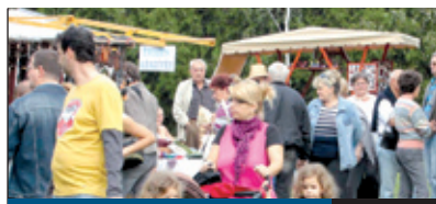
JÓT VIGADTUNK 7. oldal

Az 1848–49-es forradalom és szabadságharc aradi vértanúira emlékeztek október 5-én az önkormányzat, a kerületi pártok, nemzetiségi önkormányzatok és civil szervezetek képviselői Kiss Ernő honvéd altábornagy emléktáblájánál. A gazdag örömhagyományból származó Kiss Ernő ítéletét kegyelemből módosították akasztásról golyó általi halálra.