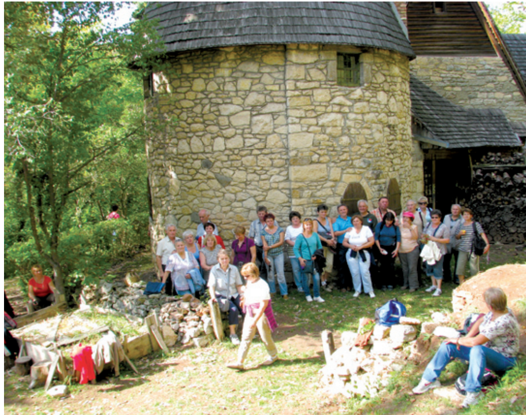
A Kós Károly által épített romantikus Bagolyvár mindenkinek nagy élmény volt

Egy kalotaszegi kalandozás tapasztalatai