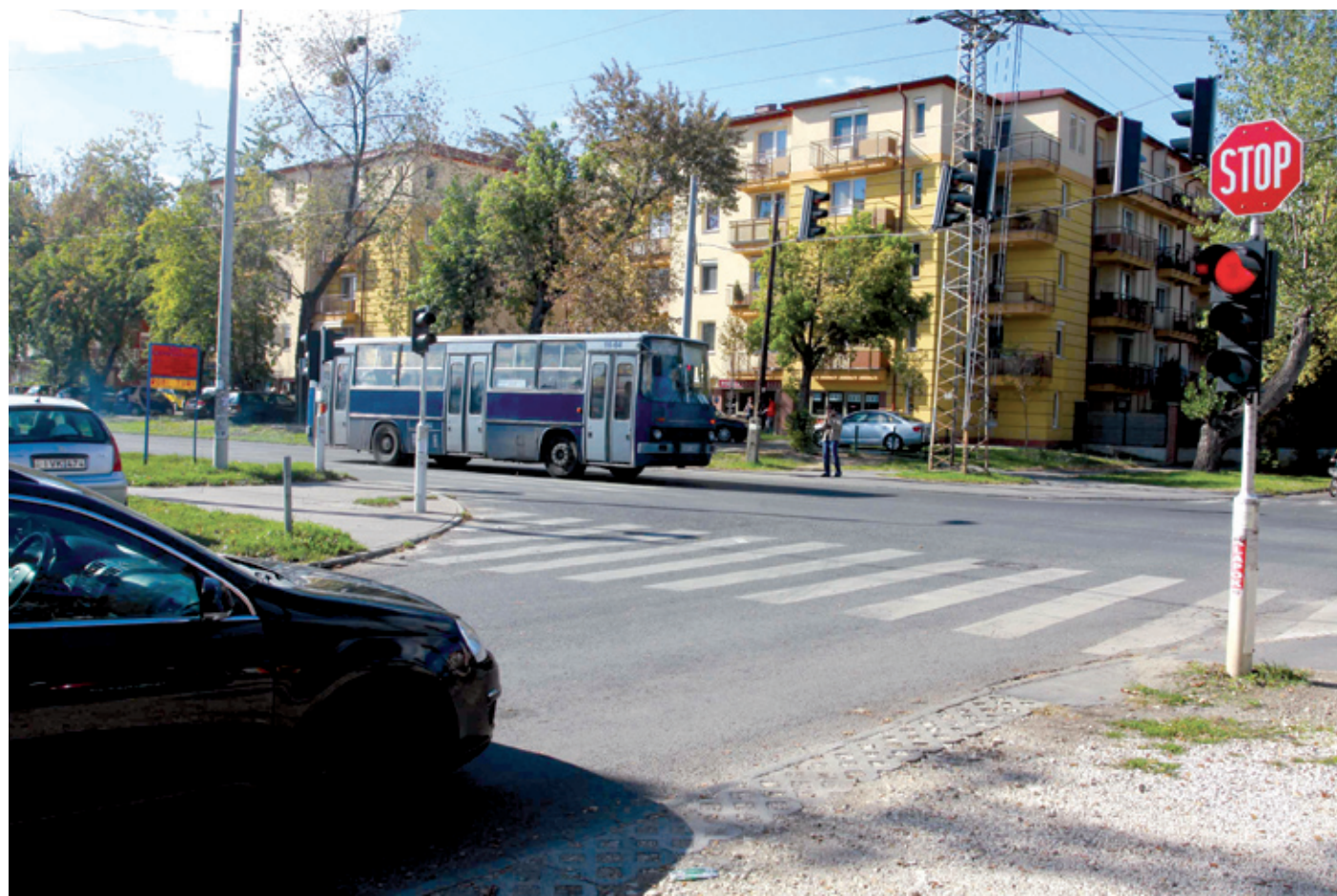
A tilos jelzés ellenére 2010-ben visszadátumozásokkal folyt tovább az út- és járdaépítés

léseket a még érvényes időszakra. Összesen 19 megrendelést antedatáltak csaknem 54 millió forint értékben, ami magánokirat-hamisítás gyanúját veti fel.