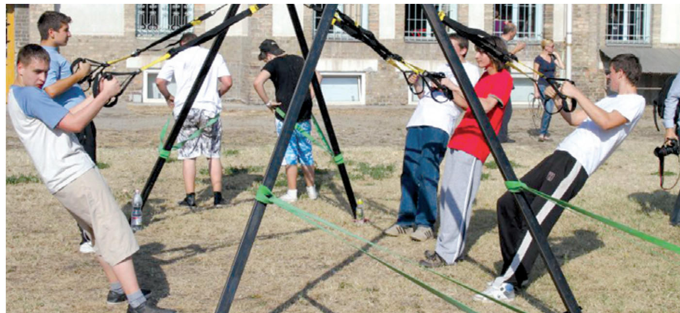
Az egészségnapon a tanulók többféle sportolási lehetőség közül választhattak

A sport és az egészséges táplálkozás jegyében telt el az október 3-i tanítási nap a Pestszentlőrinci Közgazdasági és Informatikai Szakközépiskolában. A diákok számos mozgáslehetőség közül választhattak, és különféle előadásokat hallgathattak meg az egészségről, a megfelelő táplálkozás fontosságáról.