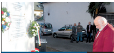
AZ ARADI VÉRTANÚK 4. oldal

Jövőre a fejlesztések éve következhet. A Lőrinci Sportcsarnok előtt még az idén megépül két parkoló mozgáskorlátozott autósok számára, majd sportpályákkal bővül a kerület. Másfél év múlva pedig Pestszentimre ad otthont a Szent Imre nevet viselő Kárpát-medencei települések találkozójának. Mindezekről a képviselő-testület döntött a szeptember 27-i ülésén.