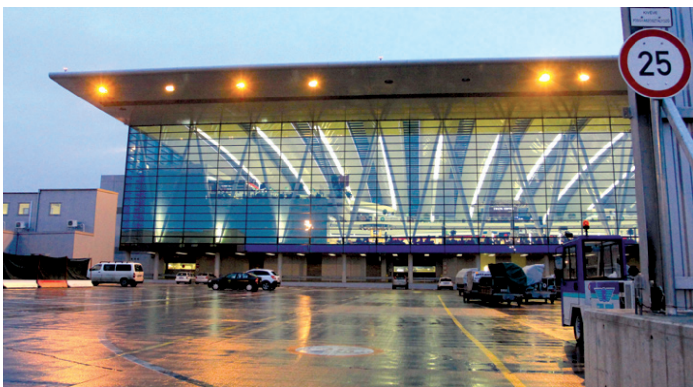
A SkyCourt az első látványos változás, ám a légikikötő a kerület további fejlesztését is elősegítheti