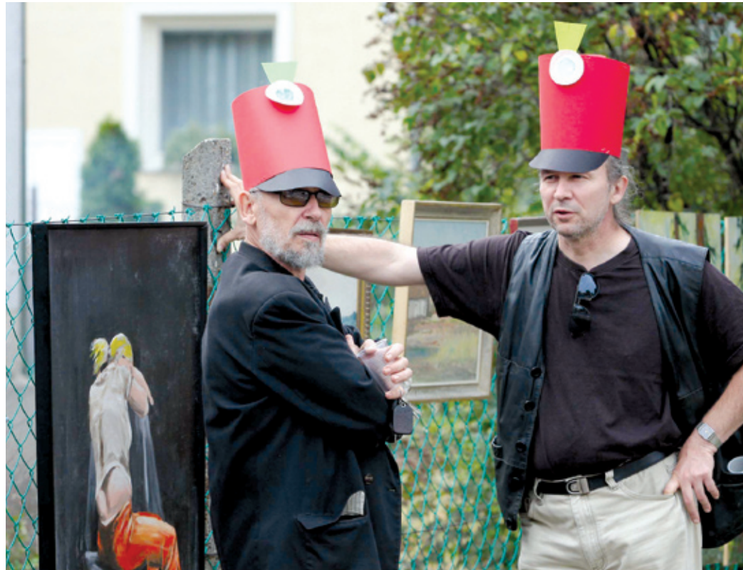
Nem csupán a festmények, Bem apó is meglepetést keltett az utcán

kerítésen szabadtéri tárlatot? Nagyon boldog voltam, hogy máshol is lesz ilyen kulturális program.