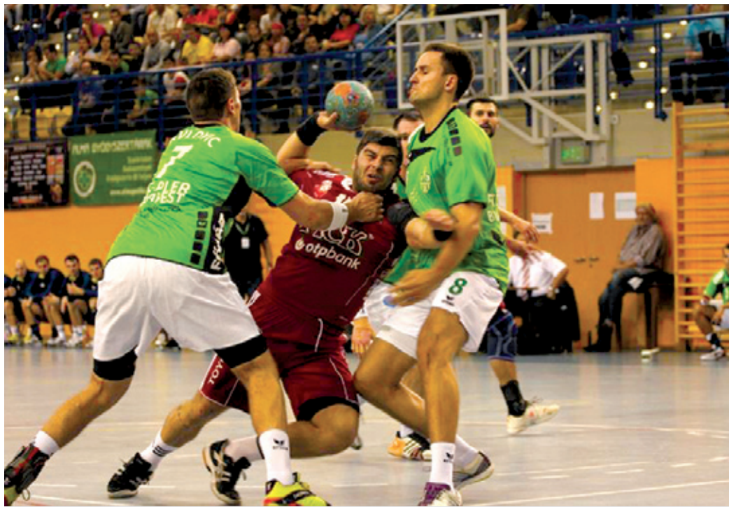
A jóval magabiztosabb szegedi játékosokat néha két lőrinci sem tudta tartani

Amint azt a papírforma ígérte, vereséget szenvedett október 3-án, a bajnokság 6. fordulójában az FTC-PLER Budapest a jobb játékerőt képviselő Pick Szegedtől, de nem volt ok a szégyenkezésre. Sőt: a budapesti csapat nagyobb önbizalommal a forduló meglepetését szolgáltathatta volna, így azonban 4 gólos vereség lett a vége (21-25).