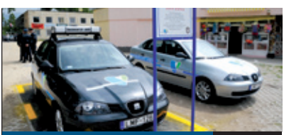
FŐ A BIZTONSÁGI! 7. oldal

Sokaknak okoz gondot, hogy munkába induláskor még többnyire zárva vannak a postahivatalok. Különösen a kerület külső részén élők számára jelent ez problémát. Jó hír számukra, hogy Ughy Attila polgármester közbenjárására október 1-jétől fél órával korábban, 7.30-kor nyit a Béke téri posta, így a legsürgősebb ügyeket reggel is el lehet majd intézni.