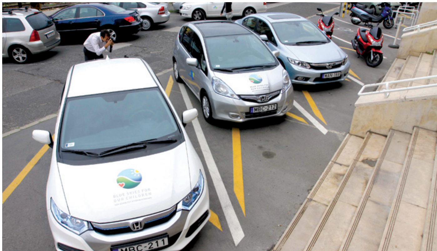
A Honda zöldprogramja támogatja az önkormányzat környezetvédelmi szerepvállalását

Az előzményekhez hozzátartozik, hogy a Honda Hungary Kft., képviselve a Honda világméretű környezetvédelmi felelősségvállalását, társadalmi szerepet vállal partnereket keresve járműveinek, környezetvédelmi és hibrid technológiáinak bemutatására, tesztelésére. A tesztprogram során a cég minél