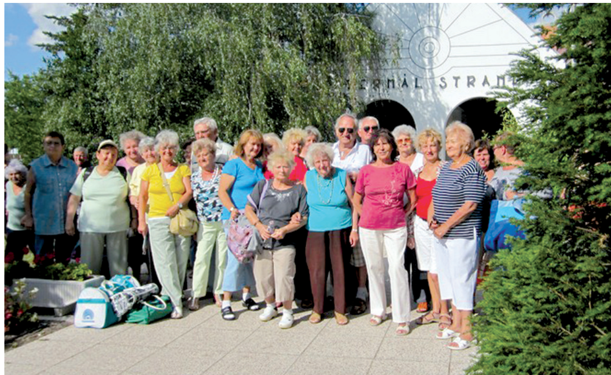
A fürdőben tett látogatás mindenkinek kellemes emlék marad

Testileg és lelkileg is felfrissültek a klubtagok