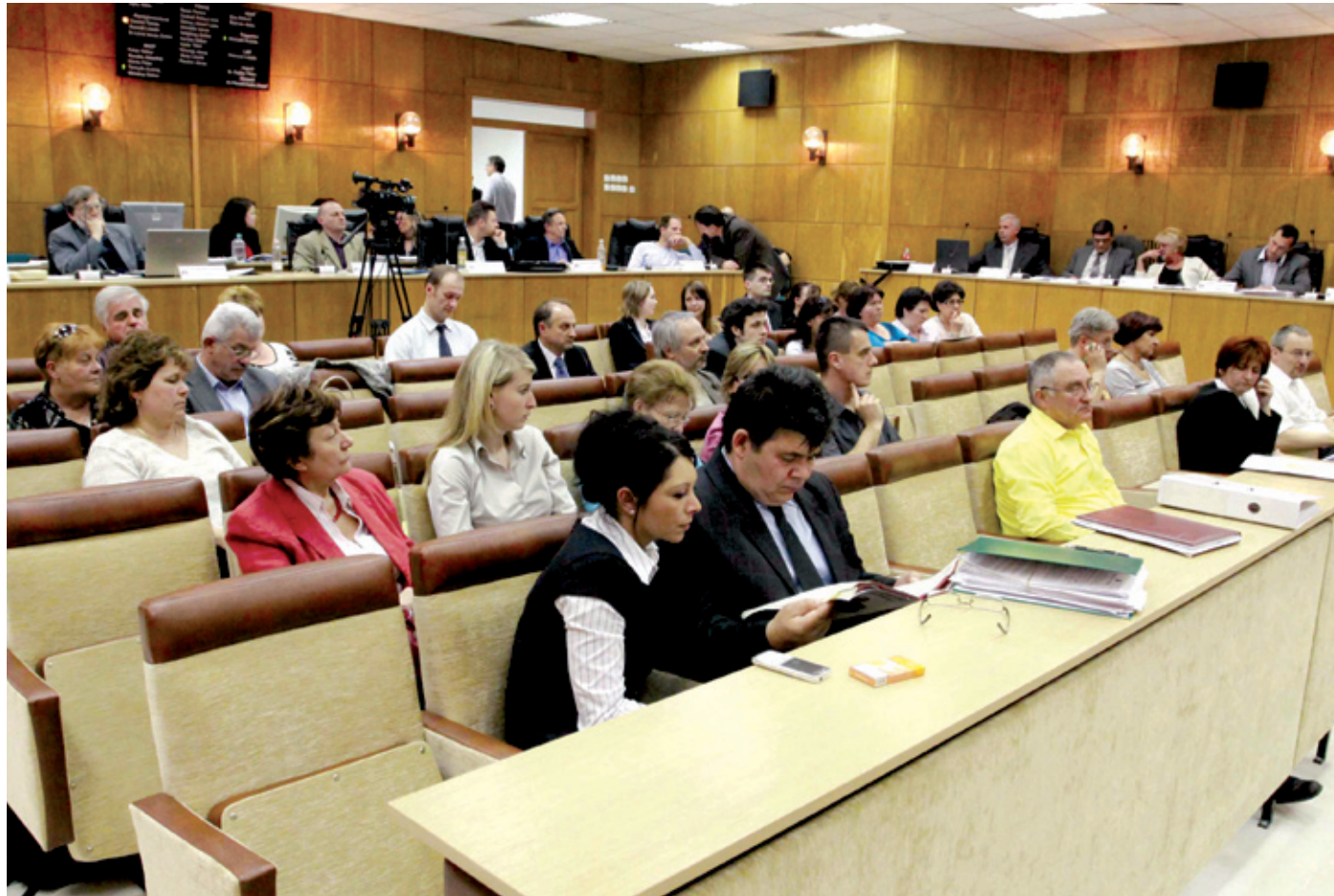
A rendszer csak akkor működhet, ha az utalványt valamennyi intézményben elfogadják

működhet, ha az utalványt valamennyi intézményben elfogadják, így a bölcsődékben és az óvodákban is. Ezekben az intézményekben az ebédet mindig egy hónappal előre fizetik be. Mód van arra, hogy hiányzás, betegség esetén, vagy ha a gyerek más intézménybe megy, lemondják a befizetés egy részét, amit a hónap végén térítenek vissza. Az utalvánnyal fizetők viszont csak utalványt kaphatnának vissza, ami azért okoz gondot, mert addigra az önkor-