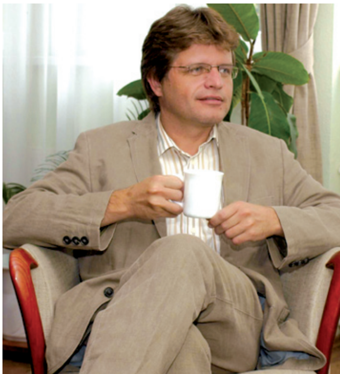
Az új főigazgató reméli, hogy a XVIII. kerületiek továbbra is bizalommal keresik fel az intézményt

– A szakorvosképzés során szükséges szakmai gyakorlatot több intézményben szereztem meg, és eközben alaposabban megismerhettem a kórházak mindennapi működését. Nagyjából ekkor alakult ki bennem az érdeklődés az intézményi menedzselés iránt. Az orvosi tanulmányok mellett ezért 1998-tól