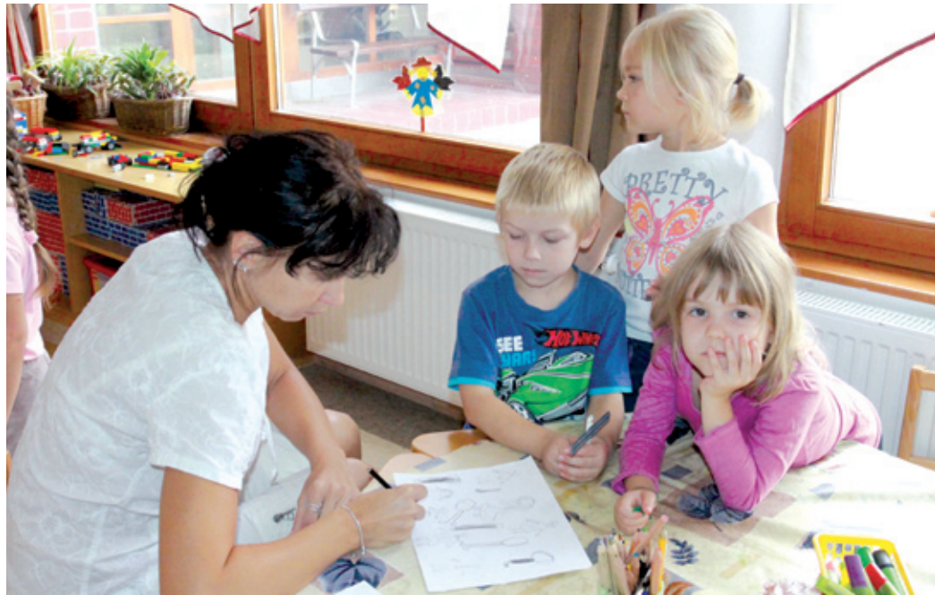
Az alapítványnak köszönhetően változatosabb az óvodások programja

nyezettudatosság kialakítása, az anyanyelvi nevelés vagy a társas kapcsolatok fejlesztése, a szocializáció elősegítése.