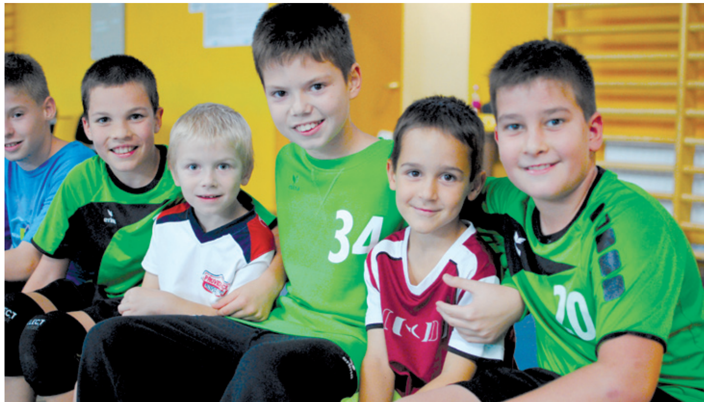
A szeptember közepén tartott toborzónapot is az utánpótlás-nevelés szélesítésének a jegyében rendezték meg

Nem csak szavakkal dolgoznak a kerületben azért, hogy az FTC-PLER Budapest kézilabda-szakosztálya az élsporton túl az utánpótlás-nevelésben is rangos helyet vívjon ki magának, hanem tesznek is érte.