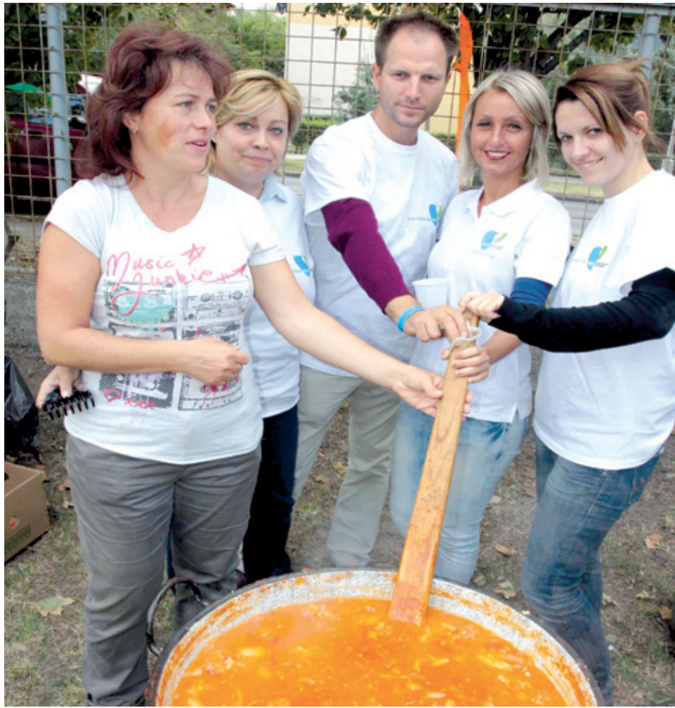
A hatalmas bográcsot keverni is együtt kellett

kerülünk a Lakatos-lakótelepen élőkhez, és hogy ne csak a képviselői fogadóórákon találkozzunk velük – mondták a képviselők. – Úgy gondoltuk, hogy ezen az évtizedes hagyományra visszatérünk a saját költségünkön főzünk lecsót, és szétosztjuk azt, hogy aki eljön ide, annak ne kelljen pénzt adnia egy tál ételért.