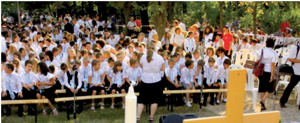
Az egyházi iskola sajátossága nem okozott gondot a Szehlóban tanuló diákoknak

Ahol rendben van a nevelés, ott az oktatással sincs gond