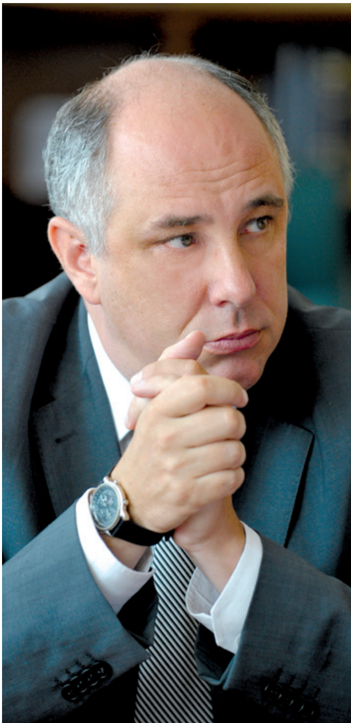
Az alapozás után lehet építkezni

PESTSZENTLŐRINC – PESTSZENTIMRE KÖZÉLETI LAPJA