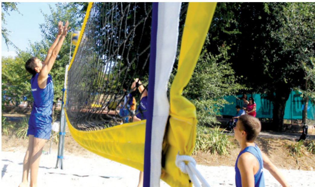
A strandröplabda tavaly mutatkozott be a kerületben, idén újabb sportágakkal találkozhatunk

Mindenkiben élénken élnek még a londoni olimpia napjai, azok a teljesítmények, amelyekkel megörvendeztettek minket a legjobbaink. A leendő utánpótlás itthon követhette nyomon az