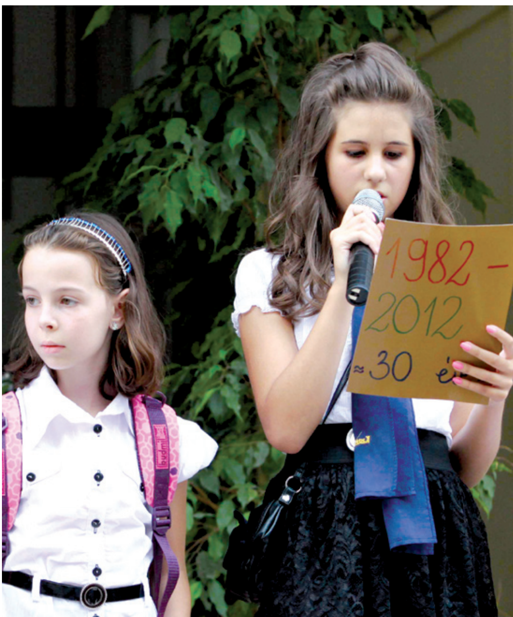
A három évtized legemlékezetesebb pillanatait is felidéztek a diákok

A kerületi tanévnyitóval indult az ősz a Kastélydombiban