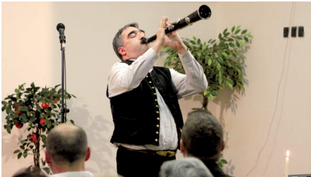
Gömöri tárogatóval indult a programsorozat, amely Burgenland bemutatkozásával zárul

Burgenland lesz az Összetartozunk programsorozat következő vendége