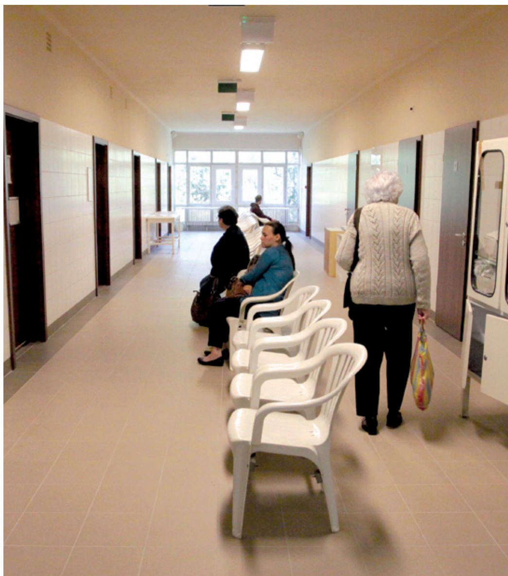
Teljesen felújították a vizesblokkot, kicserélték a padlóburkolatot és a fali csempéket is

Ismét fogadják a betegeket a Béke téri rendelőben