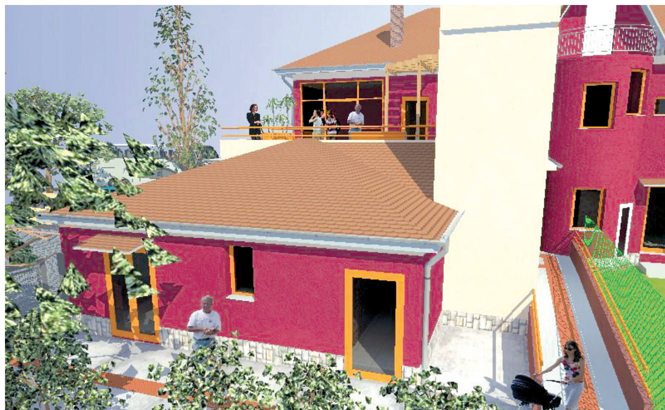
Az Imre-ház a városrész lakóinak egyik szellemi és kulturális központja lehet majd

Majdnem tucatnyi fejlesztés valósulhat meg 2013. szeptember végéig