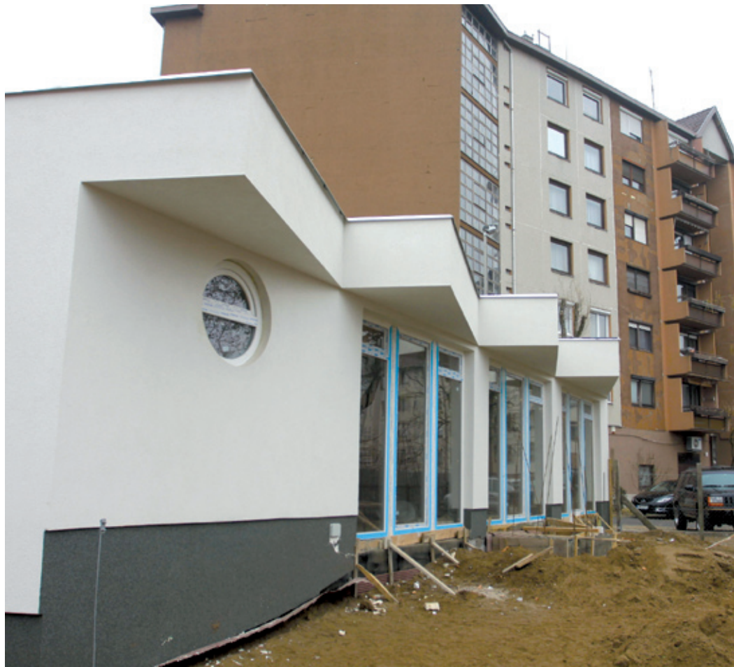
A hamarosan felépülő, új 300 fős nappali melegedőre nagy szükség van

Háromszáz fős nappali melegedőt épít a Tiszta Forrás Alapítvány