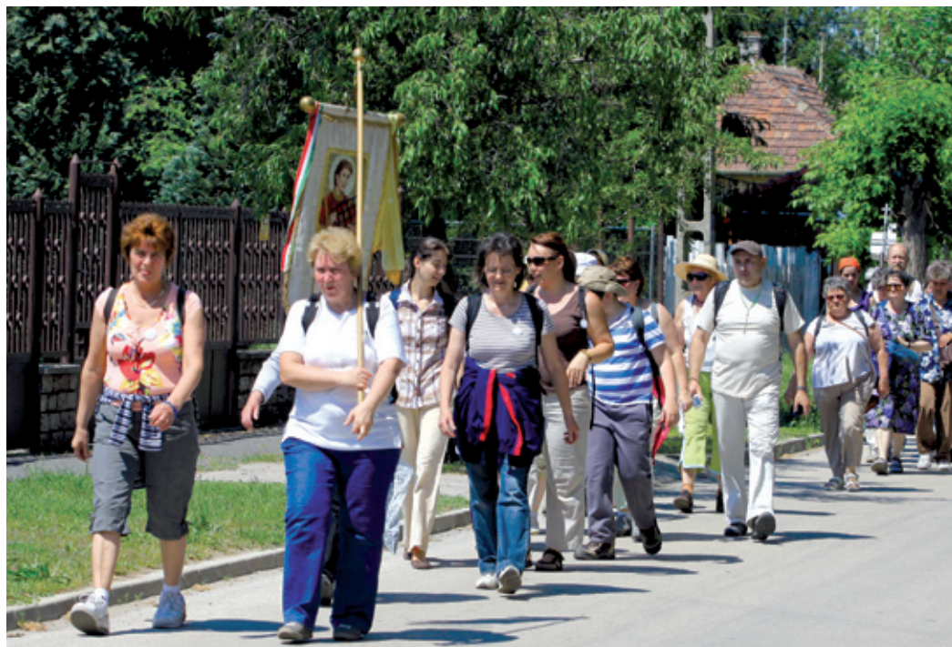
A zarándoklaton évről évre többen vesznek részt, a túrán egymást is biztatják