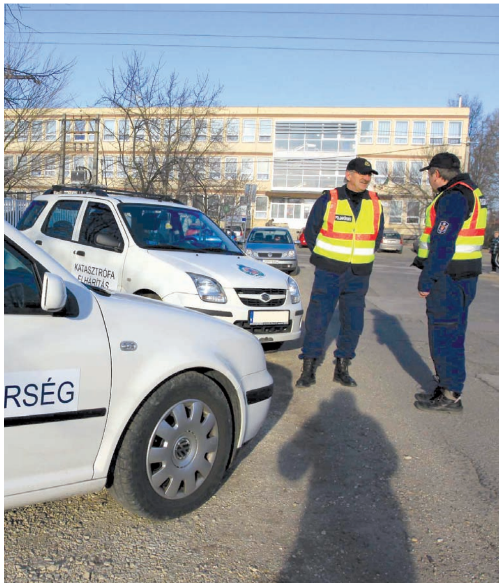
A rendőrök munkáját polgárőrök, közterület-felügyelők és mezőőrök is segítik

Rendőrök, polgárőrök és mezőőrök vigyáznak ránk