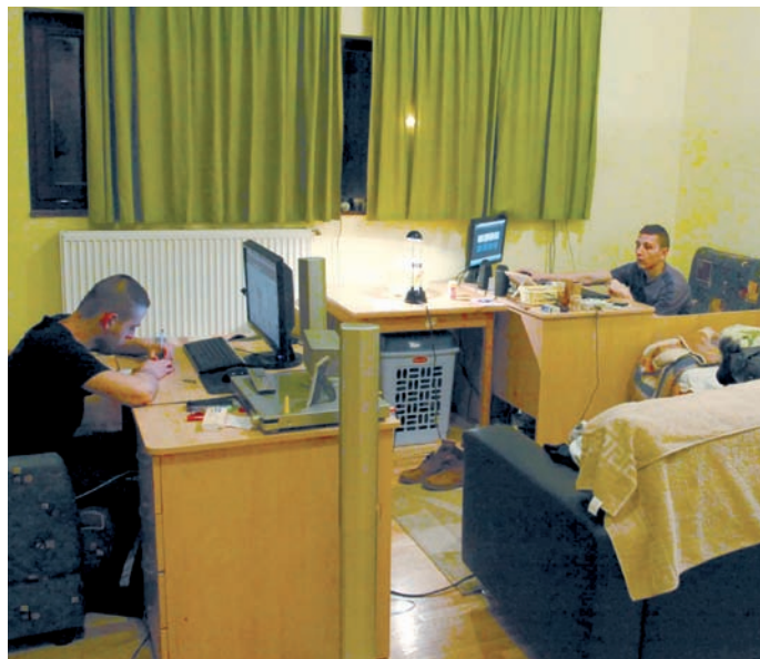
Csaknem száz fiatalon segítettek 2000 óta

A Humanitás Plusz Biztonság Alapítvány, túl azon, hogy nemes célt tűzött ki maga elé, egy jól működő rendszert is kidolgozott, amely az idős emberek elítélési problémáin és az állami gondozásból kikerülő gyermekek szociális helyzetén egyaránt tud segíteni.