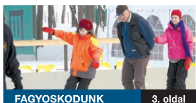
FAGYOSKODUNK 3. oldal

A hétfégi havazás nem volt olyan jelentős, hogy komoly fennakadásokat okozzon a kerületben. Az FKf és a kerület szakemberei a legtöbb közterületet már megtisztították. A következő napokban az előrejelzések szerint nem elsősorban a hó, hanem a rendkívül erős hideg okozhat problémát. A hét második felében ismét –20 fok körüli minimumokat mérhetnek.