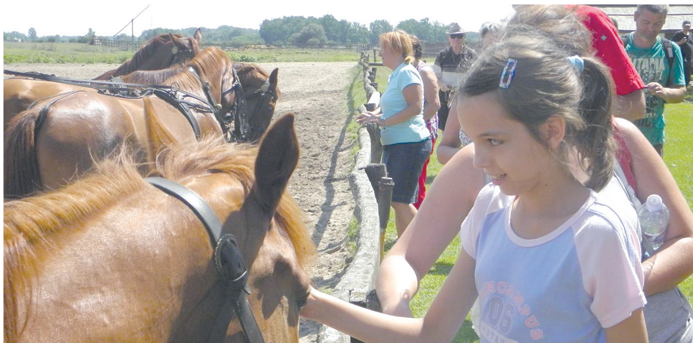
Az alapítvány fő tevékenységi köre a gyermek- és ifjúságvédelem, a szabadidős tevékenységek támogatása

Egy évben többször is vidéki környezetben üdülhetnek a fiatalok