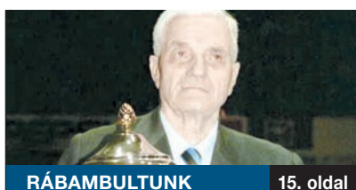
RÁBAMBULTUNK 15. oldal