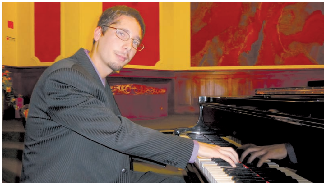
Az ifjú művész nemcsak a zenét kedveli, a mozgás is lételeme