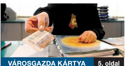
VÁROSGAZDA KÁRTYA 5. oldal

Hosszabb távon és jobb feltételekkel tud feladatot adni az önkormányzat azoknak, akik közfoglalkoztatás keretében vállalnának munkát. A fizikai munka mellett más, a végzettségüknek megfelelő feladathoz jussanak a jelentkezők. Az elmúlt évinél nagyobb, a 2010-es szintnek megfelelő összeget fordít a kormányzat idén a közfoglalkoztatás finanszírozására.