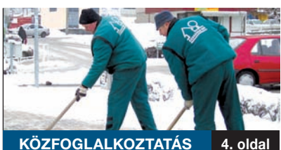
KÖZFOGLALKOZTATÁS 4. oldal

A hétfégi havazás nem volt olyan jelentős, hogy komoly fennakadásokat okozzon a kerületben. Az FKf és a kerület szakemberei a legtöbb közterületet már megtisztították. A következő napokban az előrejelzések szerint nem elsősorban a hó, hanem a rendkívül erős hideg okozhat problémát. A hét második felében ismét –20 fok körüli minimumokat mérhetnek.