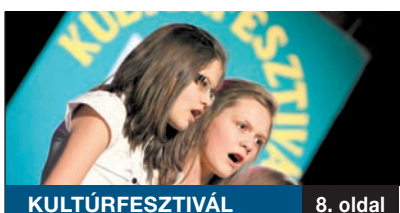
KULTÚRFESTIVÁL 8. oldal

Több mint 1100 kerületi háztartás igényelte és aktiválta eddig a tavaly bevezetett Városgazda Kártyát, miközben a helyi vállalkozások folyamatosan csatlakoznak a programhoz. Egy informatikai fejlesztésnek köszönhetően már nem kell Lőrincre utazni, a kártyát az imrei ügyfélszolgálaton is ki lehet váltani. A szigorúbb védelmet az új szabályzat szavatolja.