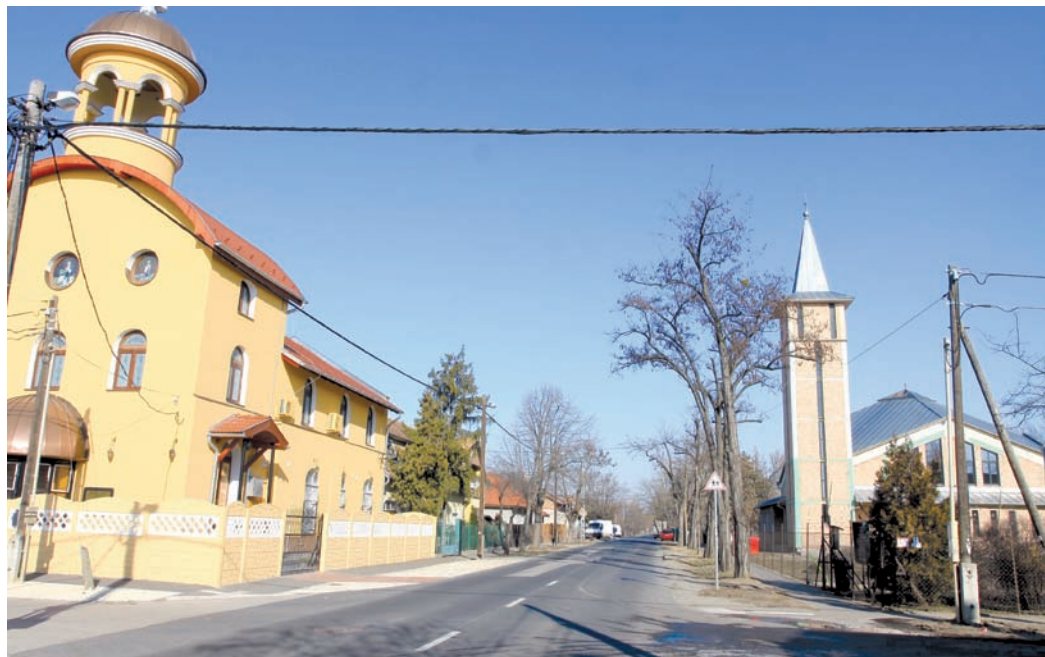
A betöréseknél is lényegesen nagyobb károkat okoznak a templomokban a tüzesetek

A templomok is ki vannak téve a természet erőinek, a rongálásnak, a pusztításnak