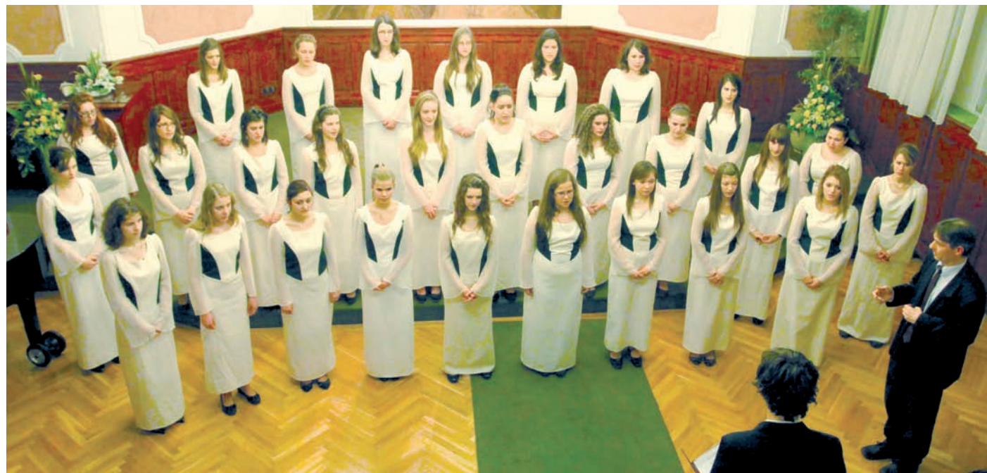
A Vörösmarty iskola leánykara ezen az esten is lenyűgözően dalolt