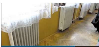
FEJLESZTÉSEK 4. oldal

A szabadidő programok kedvelői minden bizonnyal nagyon várják már a tavaszt, egyben azt is, hogy ismét sűrűbben vehessék birtokba a Bókay Kertet, amely idén is számos szabadidős programmal várja a családokat. A jó idő beálltával egy megújult kalandparkot szeretne működtetni a Bókay Kertben a Városgazda XVIII. kerület Nonprofit Zrt.