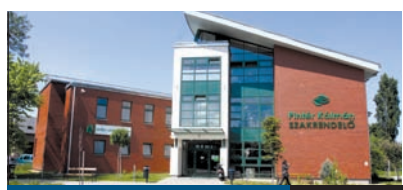
MARAD A RENDELÉS 2. oldal

Bár megtevesztő pletykák mást mondanak, minden jel szerint az önkormányzatnak sikerül megoldást találnia a pestszentimrei városközpont fejlesztése során kialakult egyik fő problémára, a gyermekorvosi rendelő új helyének kijelölésére, illetve arra, hogy a kerület ezen részén élőknek továbbra se kelljen Pestszentlőrincre utazniuk egyes szakorvosi rendelések miatt.