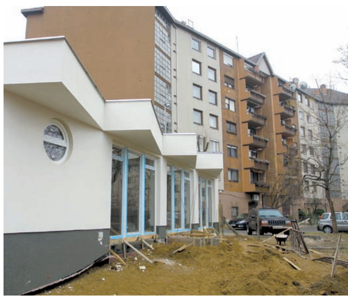
A hajléktalanok nappali melegedőjét január végén adják át

– A vállalkozó leszerelte az eszközeit, miután az általa felajánlott csaknem 40 millió forintos vételárért azt cégünk nem