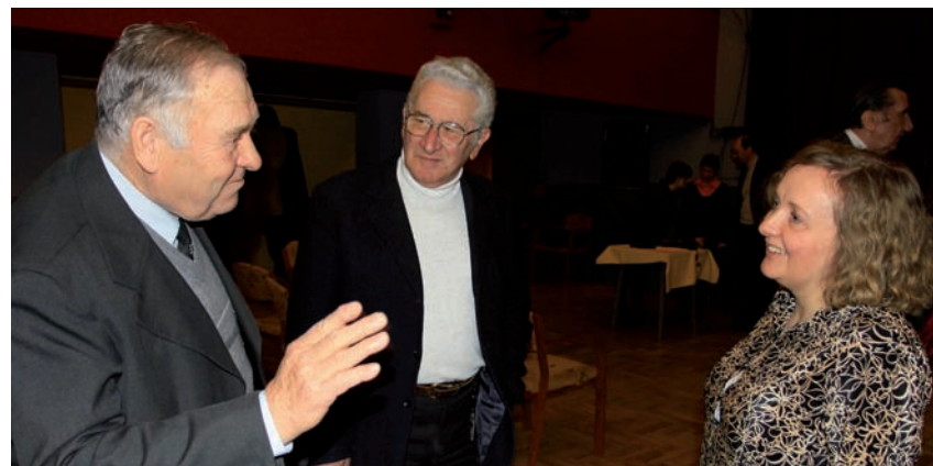
A rendezvények jó alkalmat kínáltak a beszélgetésekre

Vetítéssel egybekötött, „képes” helytörténeti előadásokat tartottak a diákoknak január 20-án délelőtt a Rózsa Művelődési Házban a Pedagógiai Intézet és Helytörténeti Gyűjtemény (PIHGY) fiatal kutatói, délután pedig Képek, tények, helyek – A képi források szerepe a helytörténeti kutatásban címmel szakmai konferenciát szerveztek a Kondor Béla Közösségi Házban.