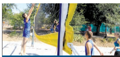
KALANDPARK 3. oldal

Bár megtevesztő pletykák mást mondanak, minden jel szerint az önkormányzatnak sikerül megoldást találnia a pestszentimrei városközpont fejlesztése során kialakult egyik fő problémára, a gyermekorvosi rendelő új helyének kijelölésére, illetve arra, hogy a kerület ezen részén élőknek továbbra se kelljen Pestszentlőrincre utazniuk egyes szakorvosi rendelések miatt.