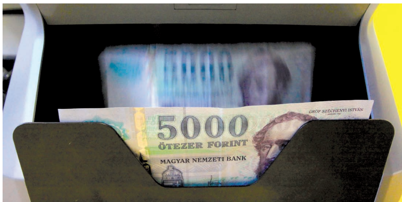
A takarékoság eredményeként polgáronként mintegy ötezer forinttal csökkent a tartozás

Sikeres esztendőt zárt tavaly az önkormányzat, s ennek bizonyítéka, hogy hosszú évek után először 850 millió plusz keletkezett. Ráadásul mindezt úgy érte el, hogy 600 millió forinttal kevesebb bevétele volt a tervezettnél, decemberben 450 millió forint adósságot törlesztett, előrehozotlan kifizette a decemberi béreket, összesen több mint 400 millió tételt teljesített az idei feladatok közül. A kánaán azonban még nem jött el, csupán a korábbi önkormányzat túlköltekezéseit sikerült megfékezni.