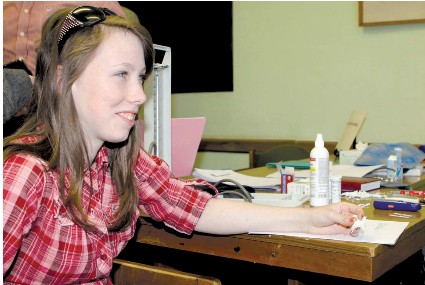
Az influenza ellen a leghatékonyabb megelőzés a védőoltás (illusztráció)

A legveszélyesebb az „A” típus, amely komoly világjárványokat okoz