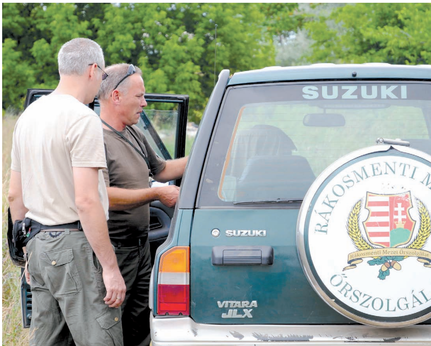
A mezőőrök a lakosság segítségével lehetnek a leghatékonyabbak

Számtalan kihívással találkoznak a mezőőrök