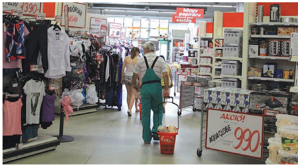
Egyre több szolgáltató csatlakozik a kezdeményezéshez