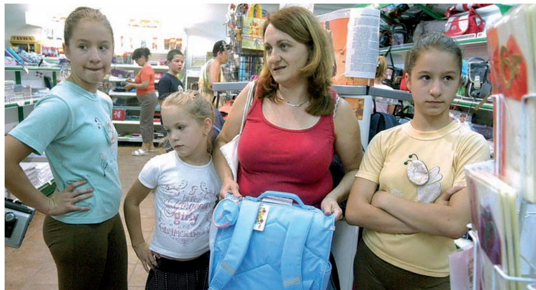
A tanévkezdés sokba kerül a szülőknek, jó tudni, mire számíthatnak

Önkormányzati támogatás az iskolakezdéshez