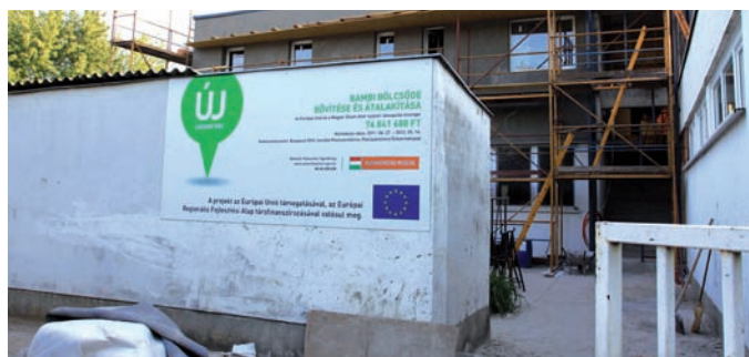
A legjelentősebb felújítás, a Bambi Bölcsőde átalakítása jövőre fejeződik be

Megújultan várja a kerületi oktatási és sportintézmények legtovábbja a tanév kezdetét. A Vagyon18 műszaki divíziójának munkatársai 82 feladatot kaptak a nyárra, s a munkák 90 százaléka kész. A diákok és az óvodák, bölcsődék növekedési zavartalanul kezdenek az oktatási évet.