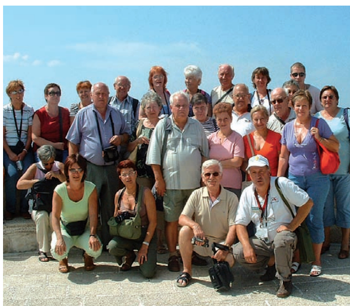
A csapat két évtized alatt igazi közösséggé vált

Még 1989-ben alakult meg az Orion Technikai Tömegsport Egyesület, amely számtalan díj és elismerés után a műszaki jellegű megmérettetések helyett most elsősorban a természet örömeire koncentrálnak mind Magyarországon, mind külföldön.