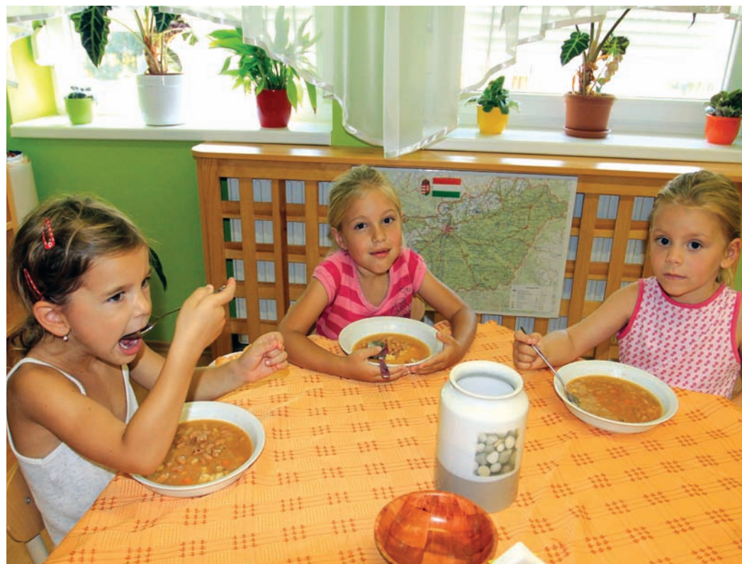
A közétkeztetés legszigorúbb bírái a gyermekek

– A hivatal munkatársaival és az ügyvédi irodával nagyon komoly szakmai munkát végeztünk, és ennek eredményét remélhetően a lakosság is kedvezőnek fogja érzékelni. Három nagy körre bontottuk a közbeszerzési eljárásokat. Már most sikerként könyvelhetjük el, hogy várhatóan szeptembertől a kerületben saját bölcsődei konyháink mellett négy-hat cég fogja végezni a közétkeztetést. Az óvodai és az iskolai ellátásnál fontos szempont volt a területi bontás.