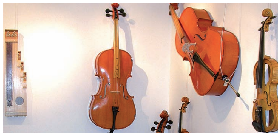
Történelmi és népi hangszerek egyaránt készülnek