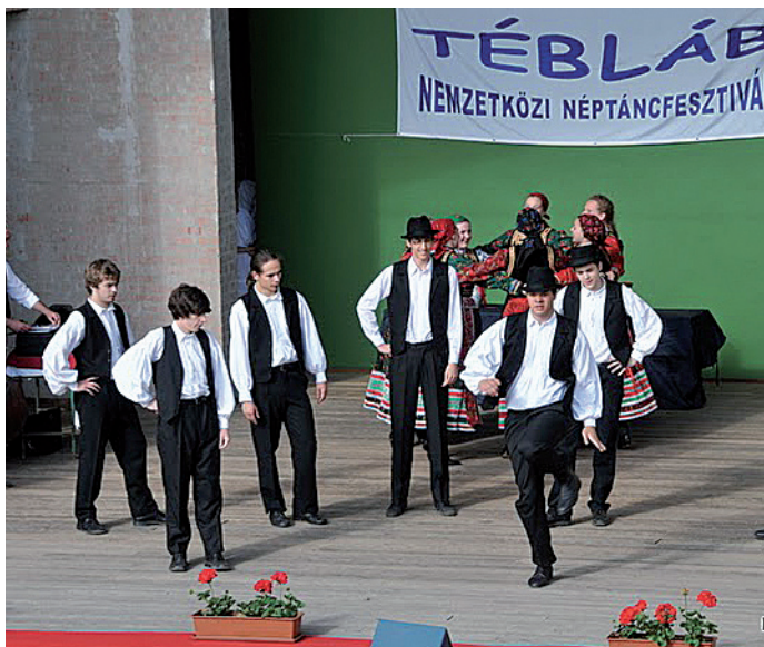
A Tébláb együttes már a határokon túra is elviszi a kerület jó hírét

Jelenleg csaknem 400 gyermek tanul táncot az intézményben, amelynek közösségformáló ereje felbecsülhetetlen. Tavasszal Walesből érkezett ide tizennégy tanuló, akik magyar társaikkal