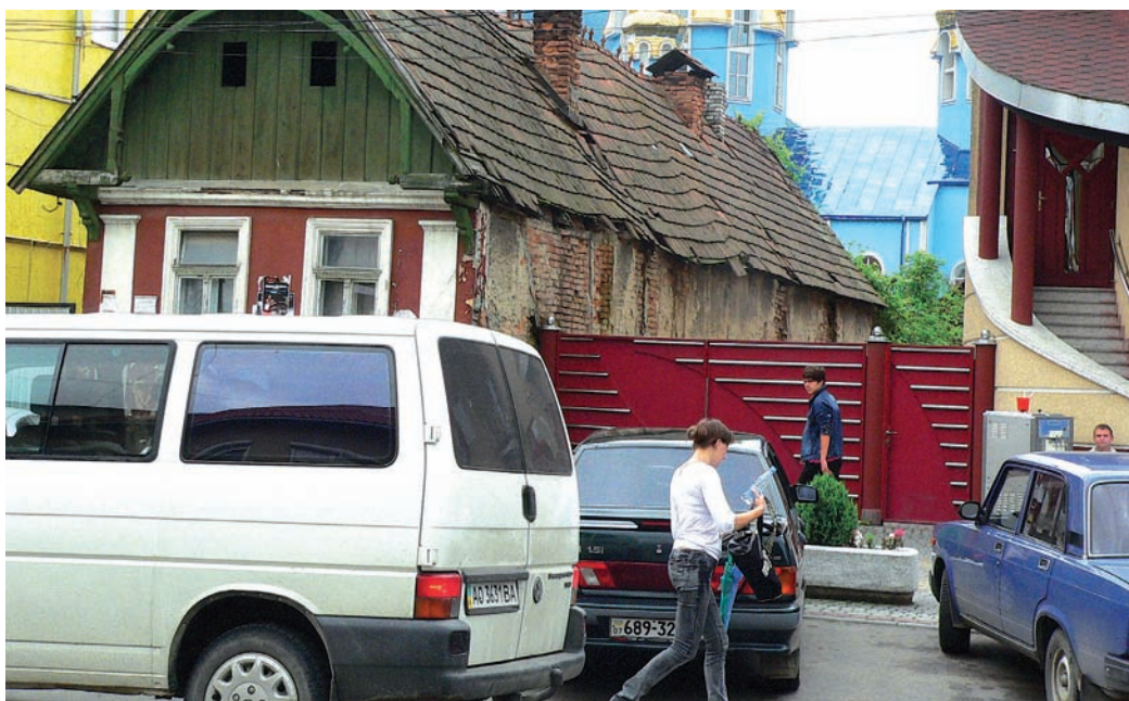
Técső tarkabarka látkepe mindenkinek nagyon tetszett

„Mert a haza nem eladó, ezüst-pénzre sem váltható” – éneklie a