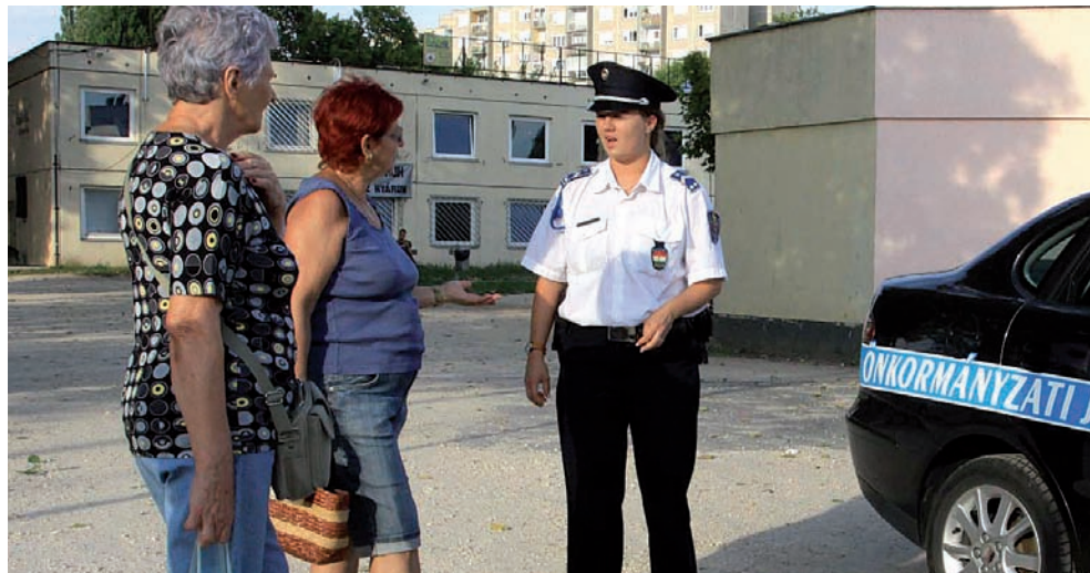
A Havanna-lakótelepen rendszeresen keresik a lakók a rendőröket

A lakók örülnek: tudják, kihez fordulhatnak, ha baj van