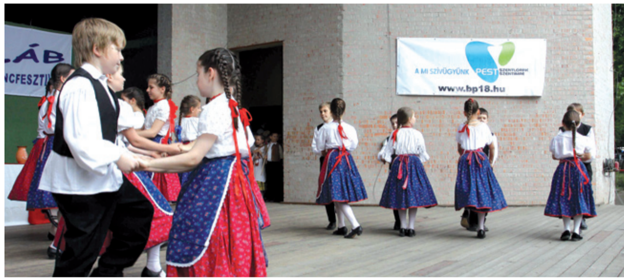
A 20 éve indított táncműhely ma közel 400 gyermeket foglalkoztat

Táncsal ünnepelték a születésnapot a Bókay Kertben