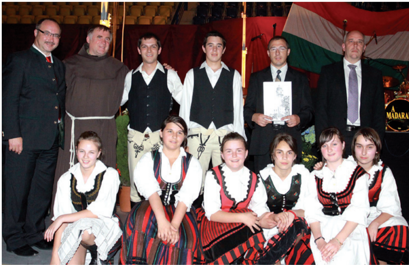
A jótékony-sági bálon a Szent László Gyermekvédelmi Központ néptáncosai fellépésükkel hálták meg a segítséget