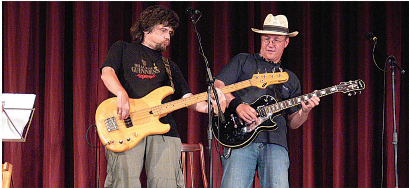
A tradicionális ír hangzás a modern közönségigénynek megfelelő hangszerekkel egészült ki

Mi is autentikus ír zenével kezdtük 2008-ban, de hamar váltottunk. Észrevettük, hogy ilyen zenekarból rengeteg van városzerte, és ezek le is fedik a terepet. Ugyanakkor a nagyobb vidéki rendezvényeken sokkal nagyobb az igény a látványos színpadi show-kra. Az a klub- és