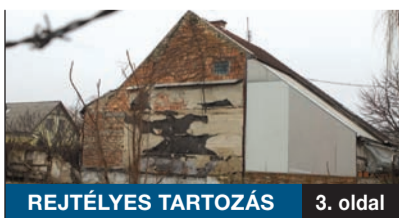
REJTÉLYES TARTOZÁS 3. oldal

A főváros pesti oldalán kerületünkben található a legtöbb erdő, összesen mintegy 400 hektár. A Pálisi Parkerdő Zrt. idén is végez fakitermelést, amely az erdőfelújítás, vagyis az erdő megfiatalításának első lépése. Az előregedő, és ezáltal veszélyessé is váló fákat gazdasági értékük elveszése előtt szükséges kitermelni.