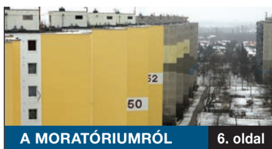
A MORATÓRIUMRÓL 6. oldal

Az Állami Számvevőszék megállapítása szerint a korábbi években a kerület vezetése nem fizette megfelelő mértékben az adót a lakásrehabilitációs alap számára. A tartozás ma 789 millió forint, és a főváros ragaszkodik a fizetéshez. Ennek törlesztése nélkül több tervezett fejlesztés kerülhet veszélybe.