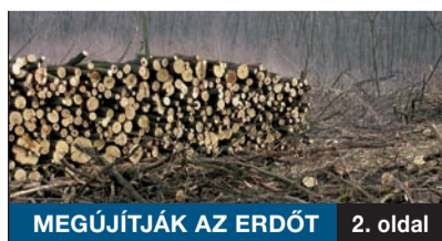
MEGÚJÍTJÁK AZ ERDŐT 2. oldal

A főváros pesti oldalán kerületünkben található a legtöbb erdő, összesen mintegy 400 hektár. A Pálisi Parkerdő Zrt. idén is végez fakitermelést, amely az erdőfelújítás, vagyis az erdő megfiatalításának első lépése. Az előregedő, és ezáltal veszélyessé is váló fákat gazdasági értékük elveszése előtt szükséges kitermelni.