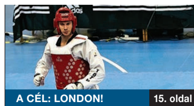
A CÉL: LONDON! 15. oldal

Az Üde Színtolt Kulturális Egyesület rendezvénysorozatát indít „Tartozunk – Összetartozunk” címmel a Polgárok Házában. A március 10-én kezdődő programok fővédnöke a Nemzeti Kulturális Alap elnöke, Jankovics Marcell lesz. A Kárpát-medence magyarságát bemutató sorozat első estjére felvidéki vendégek érkeznek.