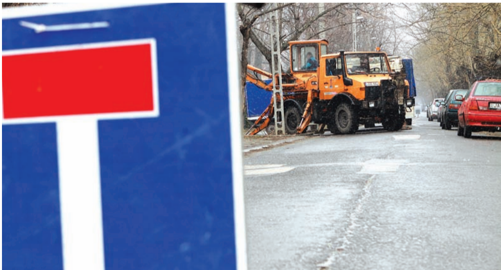
A javítások idejére átmenetileg lezárhatják az utakat

Jelentős mennyiségű kátyú keletkezik a főváros közútjain egyetlen tél alatt. A XVIII. kerületben például 2011 elején mintegy 9000 négyzetméter úthibával kell számolni. Ennek kijavítása, karbantartása komoly összegeket emésztene fel, ezért döntött úgy az önkormányzat, hogy a korábbi módszert költséghatékonyabb megoldásra cseréli.