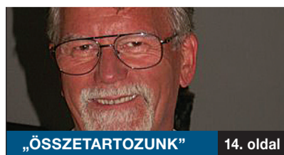
„ÖSSZETARTOZUNK” 14. oldal

Az önkormányzat testületi ülésén foglalkoztak a képviselők a kormány által április 15-ig meghosszabbított lakásárverési moratóriummal. Ughy Attila polgármester elmondta, hogy gyakran az ingatlanok sokkal kevesebbet érnek a piacon, mint amennyi hitel van rajtuk. Az önkormányzat azonban nem köthet rossz üzletet!