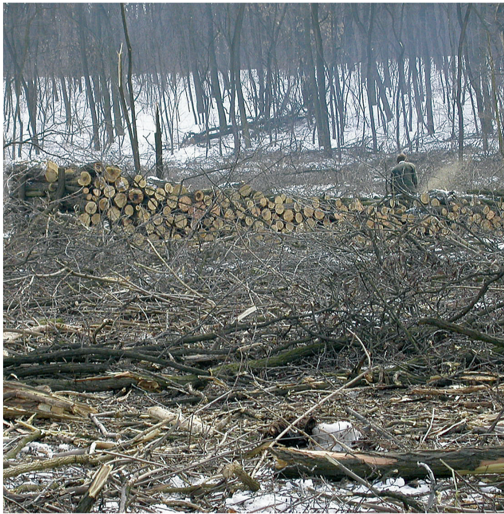
A fakitermelést már megkezdte a Pilisi Parkerdő Zrt.

Tarvágást a csak mesterségesen vagy sarjról felújítható fajok (pl. akác) állományai esetén alkalmazzák a szakemberek. A fokozatos felújító vágást természetközeli állapotban lévő állományokban alkalmazzák. Fokozatosan egyre nagyobb növtérhez juttatják a csirázó magból fejlődő új fanemzedéket. Miután