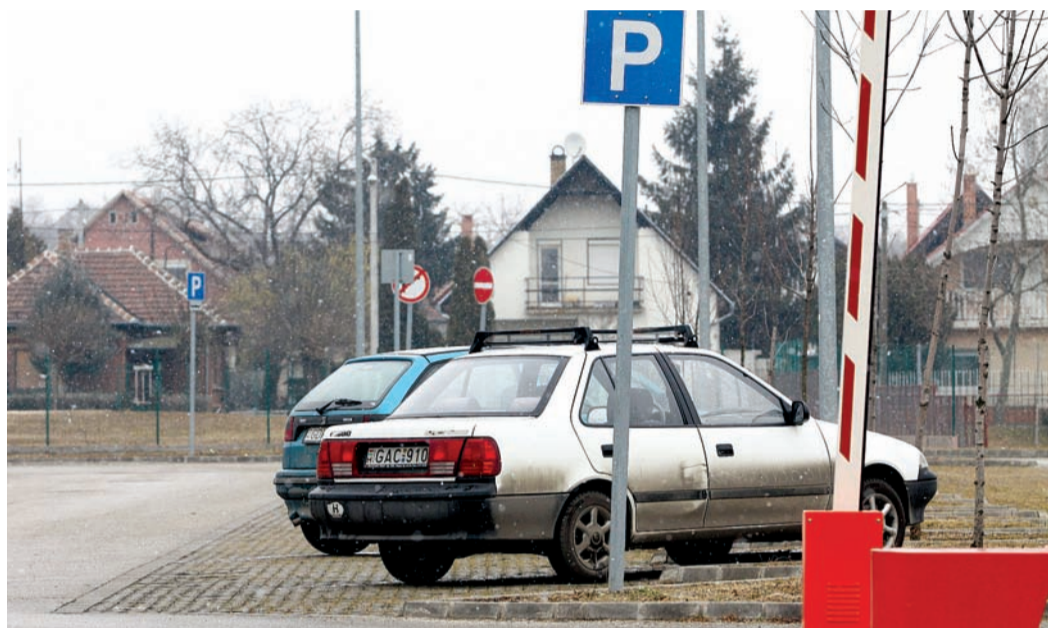
Ha nincs rendezvény, a Sportkastélynál könnyű parkolni

A Pestszentimrei Városrészi Önkormányzat módosítaná az épített környezetről szóló helyi rendeletet, építkezni a jövőben csak a tervtanács ajánlásával lehetne a Nemes utcában és környékén. A kezdeményezés célja a kertvárosi jelleg megőrzése.