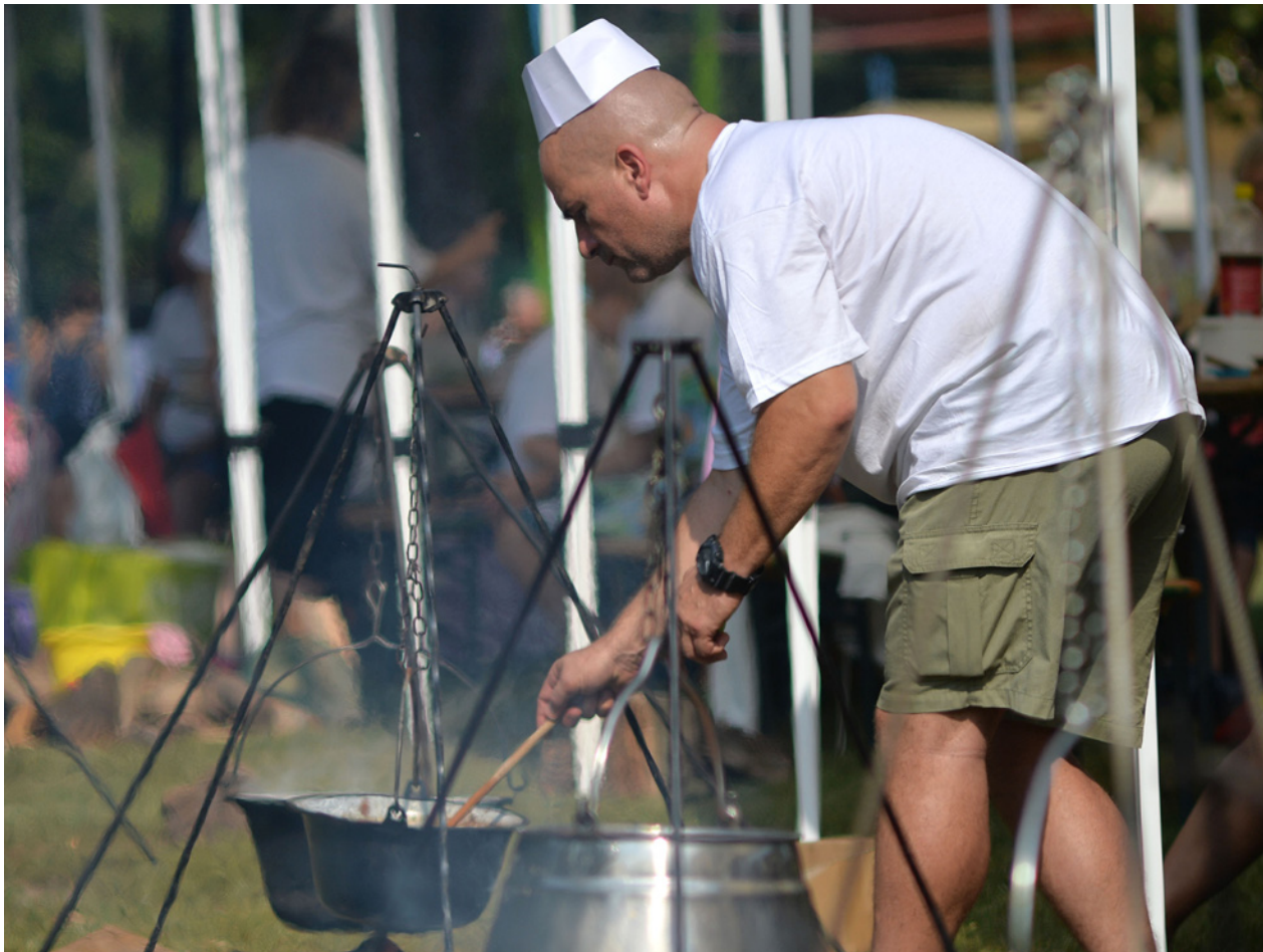
Idén a hagyományos ínycsemegek mellett csülökkülönlegességek is rotyognak majd a kondérokban

– Sülve, főve, a csülök elkészítésének számos módja van. Reméljük, hogy ahogy az elmúlt években, úgy idén sem hagyja cserben a versenyzőket a fantáziájuk, és számos különleges recepttel is találkozhatunk – tette hozzá a főszervező.