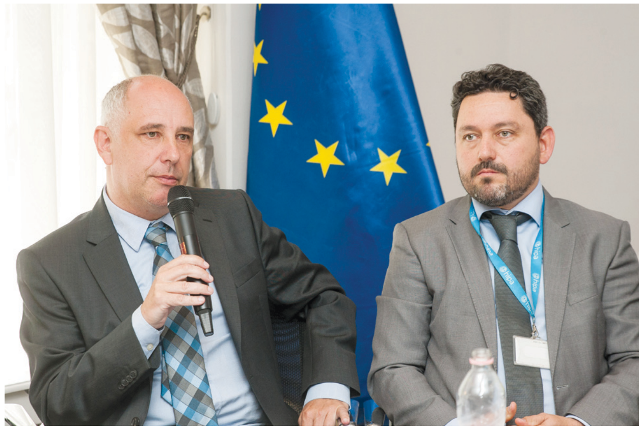
Az érintettek a repülőtéri együttműködés kibővítését szerződéssel pecsételték meg

Minisztériumi háttérű ügynökség csatlakozott a klaszterhez