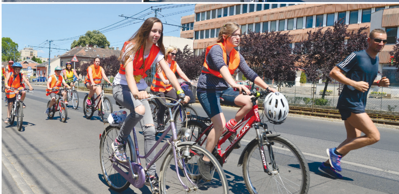
Az idei Tour de Bókay kerékpáros felvonuláson mintegy ötszázan pattantak nyeregbe

➤ Negyedik alkalommal rendezték meg június 11-én, vasárnap a Tour de Bókay kerékpáros felvonulást, amelynek útvonala a VIII. kerületből, a Bókay János utcai I. sz. Gyermekgyógyászati Klinika udvaráról vezetett a XVIII. kerületi Bókay-kertbe. Az egyre népszerűbb és ismertebb rendezvényen az idén mintegy ötszázán szálltak nyeregbe, hogy kerekessenek és a nevezésükkel támogassák a klinikát, annak kis betegeit.