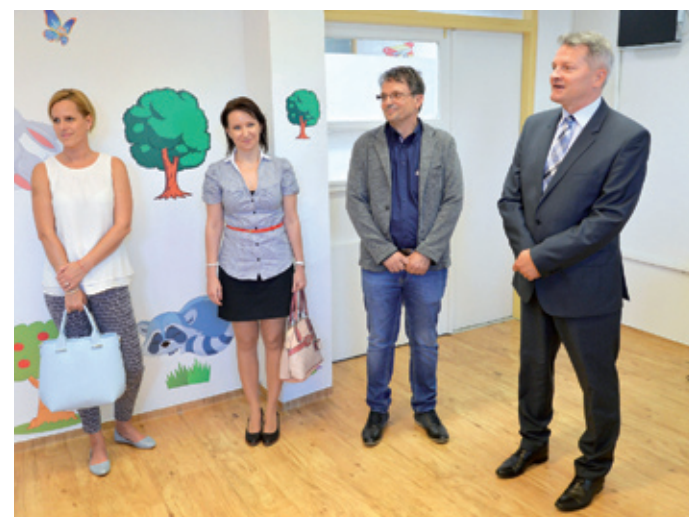
Korszerű készülékeket adott át ünnepélyes keretek között Kucsák László a XVIII. kerület országgyűlési képviselője.