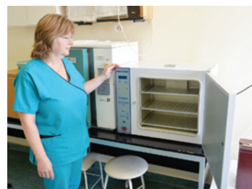
A jótékonyági koncert bevételéből a fül-orr-gégészeti osztálynak egy sterilizálóeszközt és egy vizsgálólámpát szereztek be.

Kérjük, amennyiben felmerül önben, hogy a gyermekének esetleg halláscsökkenése vagy halláscsökkentése van, mihamarabb forduljon szakorvoshoz. Ne feledje, hogy a probléma korai felismerése és kezelése nagymértékben hozzájárulhat gyereke egészséges fejlődéséhez!