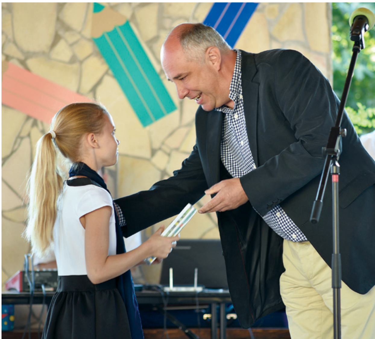
A kerületi általános iskolákban idén is ingyenes füzetsomagot osztanak a diákoknak

Tavaly nyáron döntött a képviselő-testület arról, hogy az önkormányzat vállalja az önrészt a Bókay Árpád Általános Iskola energetikai korszerűsítéséhez. Az elmúlt egy évben a