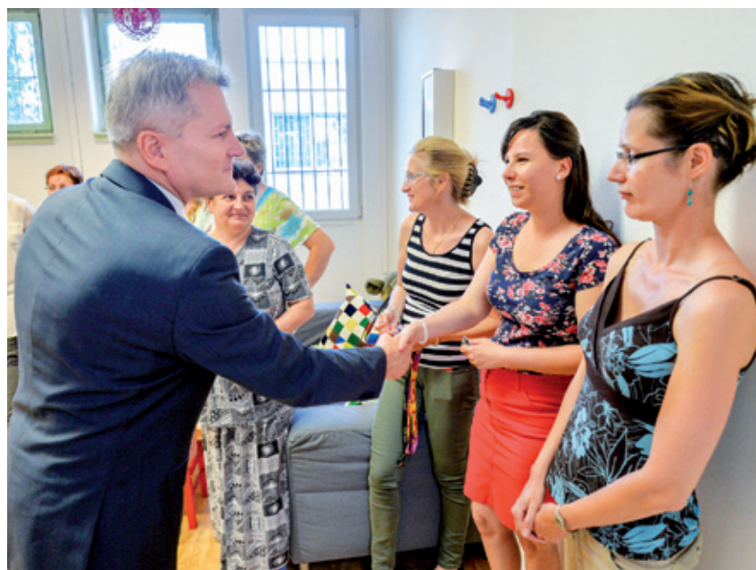
A területi védőnők az új eszközökkel korszerűbb diagnosztizáló tevékenységet végezhetnek.