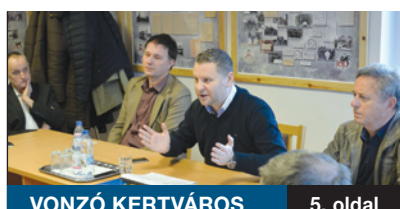
VONZÓ KERTVÁROS 5. oldal