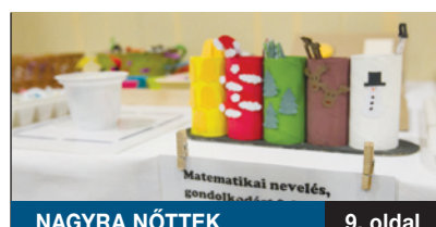
NAGYRA NÖTTEK 9. oldal

A KERÜLETI ÖNKORMÁNYZAT minden évben kiemelt beruházként foglalkozik a járda-felújítással. Az elmúlt évben csaknem 15 kilométer járda felület újult vagy épült meg, amivel sikerült tartani az egy évvel korábbi ütemet. Idén szeretnék emelni a korábbi mennyiséget, és 20 kilométer járda felület építését, rendbehozatalát tervezik, amit már el is kezdtek.