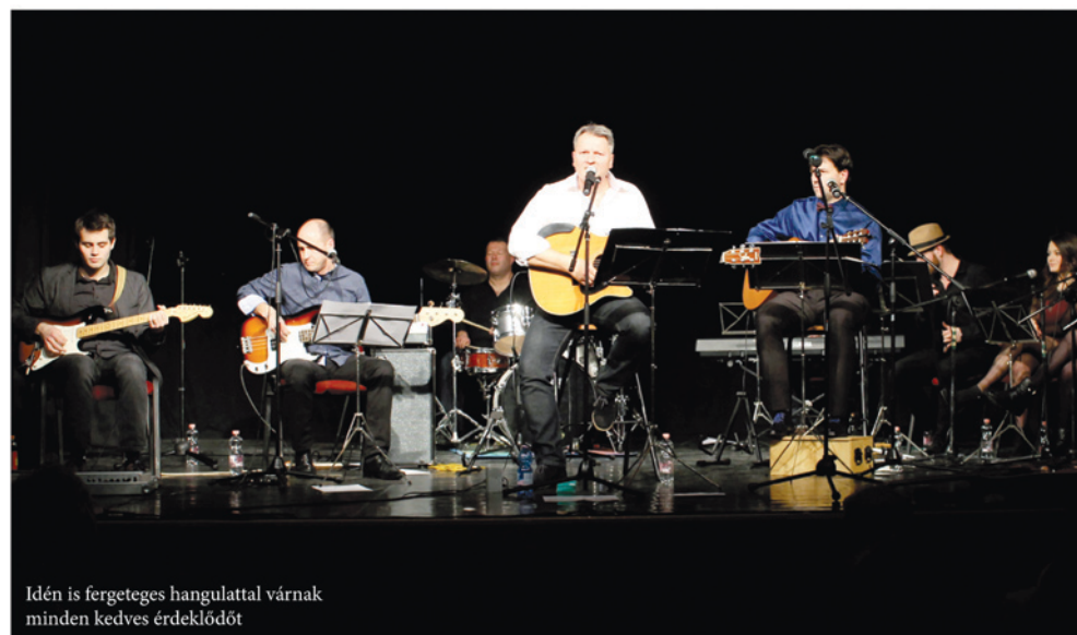
Idén is fergeteges hangulattal várnak minden kedves érdeklődőt