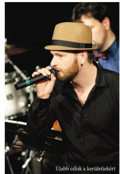
Újabb célok a kerületiekért