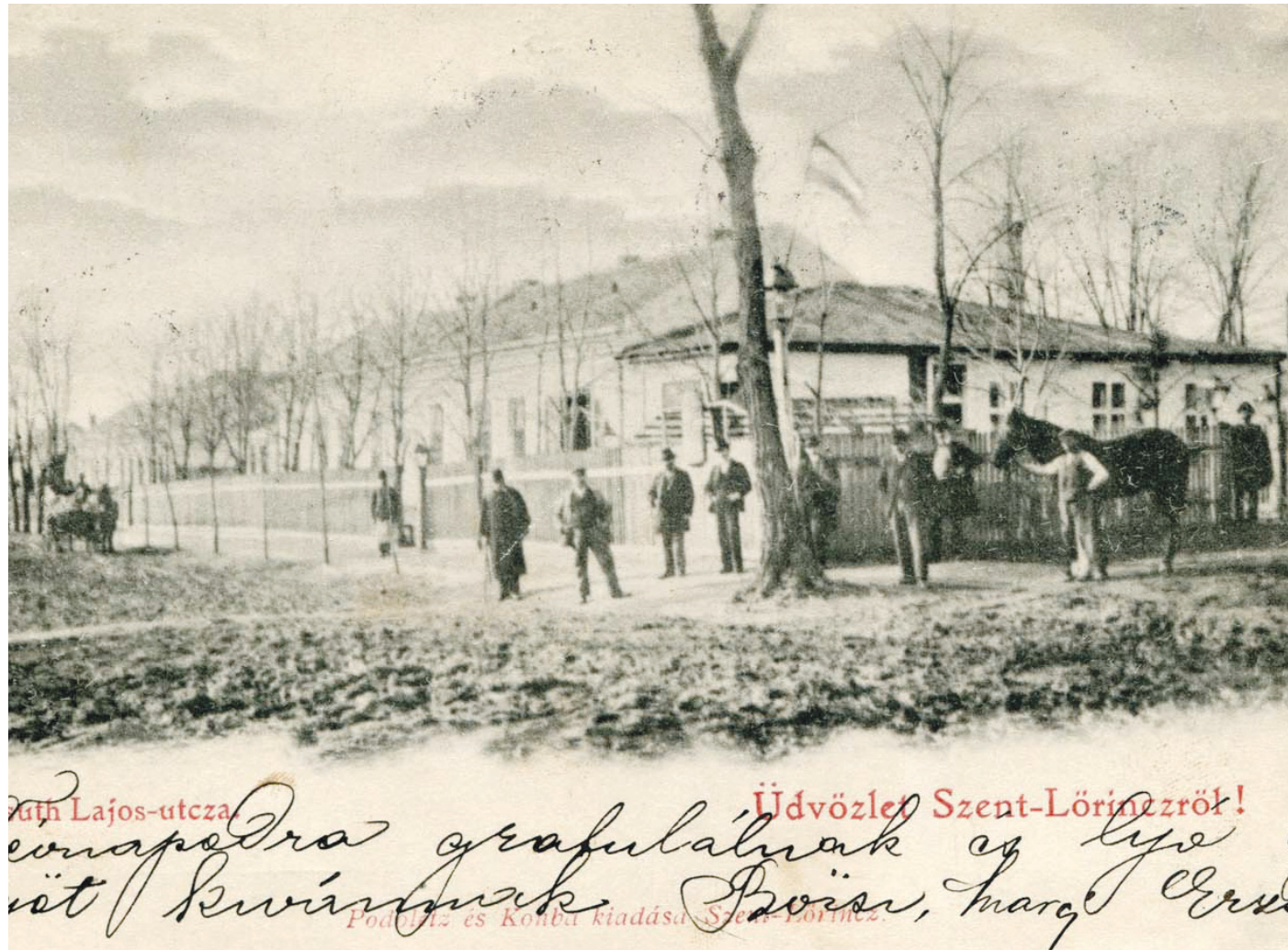
A felparcellázott területen gyorsan fejlődésnek indult Pusztaszentlőrinc

A település történetében jól ismert Herrich Károly miniszteri tanácsos, a Tisza-szabályozásban szakmai nevet szerző főmérnök, 550 hold tulajdonosa jelentős nagyságú földterületet adott el. Ez a szárnyát bontogató Kispesztnek és a vele társközséggé vált egy közigazgatásban élő Lőrincnek