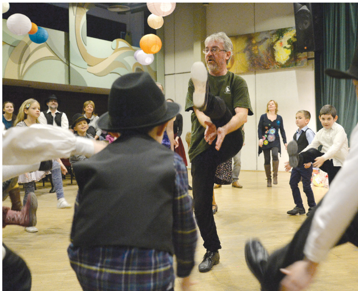
Február végén egy jótékonyági gálán ismét gyűjtenek a károsultaknak

A töprengésből eredeti ötlet született. Egy frissen létrehozott Facebook-csoport közösségének kö-