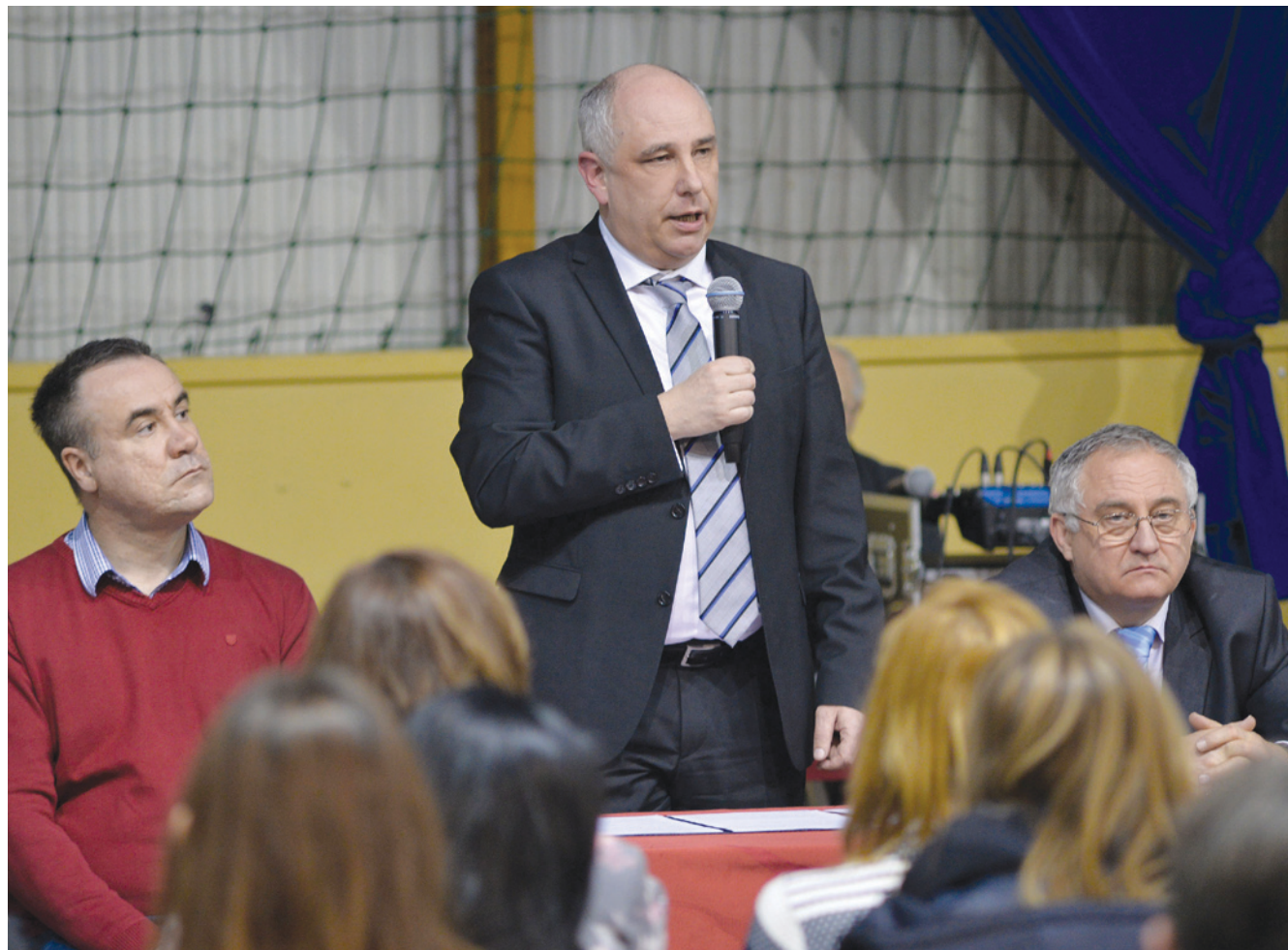
Ughy Attila kiemelte, hogy az önkormányzat továbbra is számos módon támogatja a diákokat

Az önkormányzat odafigyel az iskolásokra