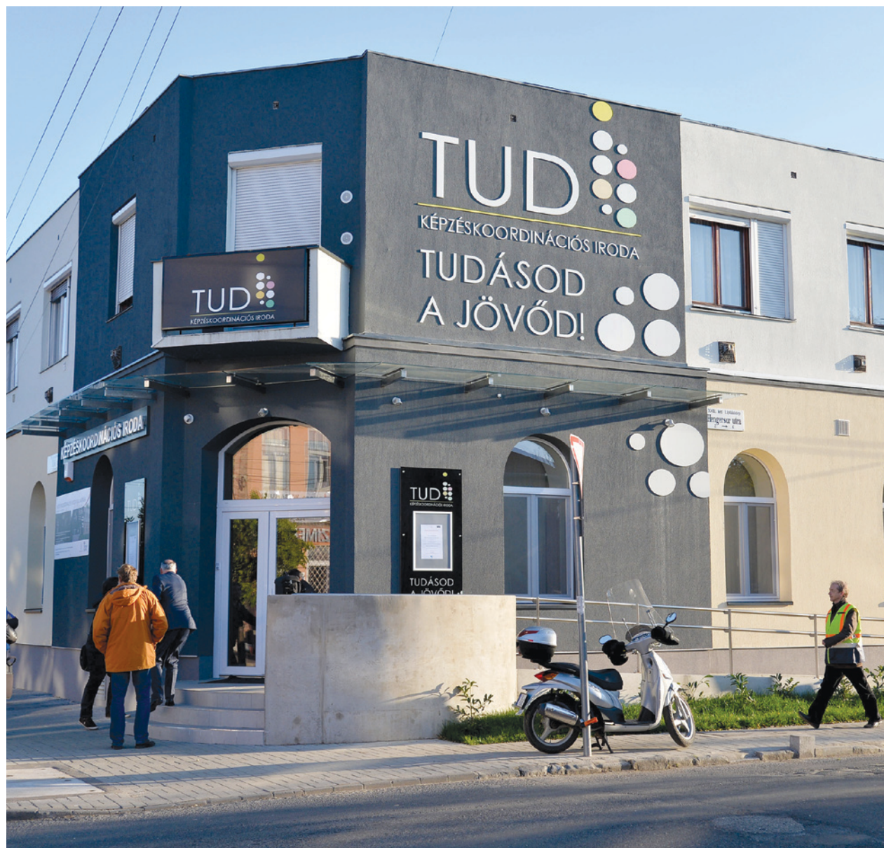
A Norvég Alap által támogatott ingyenes képzés több szakmában is segíti az elhelyezkedést

A kerületiek repülőtéri foglalkoztatásáért