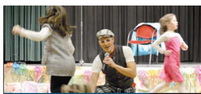
CIVIL ÖSSZEFOGÁS 9. oldal

HOSSZÚ LEHET AZ AZ IDŐ egy iskolás számára, amely a tanítási idő vége és a szülők hazaérkezése között eltelik. Érdemes azt okosan és tartalmasan eltölteni. Ebben és még számos más ügyben tud segíteni a Csibész Család- és Gyermekjóléti Központ Prevenációs Csoportja. A további lehetőségeiről is érdemes érdeklődni a preventációs csoport elérhetőségein.