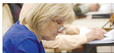
VÁR AZ AKADÉMIA 14. oldal

AZ OTTHONUKAT VESZTETTÉK el azok, akiknek a háza elpusztult decemberben a Baross és a Barta Lajos utca sarkán keletkezett lakástűzben. A január 28-án a Kondor Béla Közösségi Házban rendezett családi napon civilek gyűjtöttek az érintettek támogatására, amihez az önkormányzat ingyen biztosította a termet. A károsultaknak továbbra is lehet segíteni.