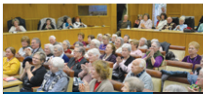
FÉLÉVZÁRÓ 9. oldal