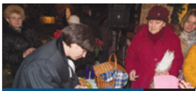
ADVENT 8. oldal

Az önkormányzat évről évre kiemelt beruházásként foglalkozik a járdafelújítással. Idén csaknem 15 kilométer járdafelület újult vagy épült meg. Ezzel sikerült tartani a tavalyi ütemet, amikor ugyanilyen hosszban készültek el járdák. A program jövőre is folytatódik, a tervek szerint legalább az ideivel egyező nagyságú járdafelület korszerűsítésének.