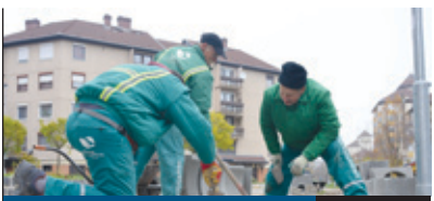
JÁRDAFELJÚJTÁS 6. oldal

Munkahelyet keresőknek szervezett tréninget a Jövő Ifjúságáért Egyesület. A november 25-i rendezvényen az érdeklődők profi munkaerő-közvetítőktől kaphattak felvilágosítást többek között arról, hogy miként kell önéletrajzot írni, megpályázni egy munkahelyet, és hogyan lehet sikeresen szerepelni az állásinterjúkon.