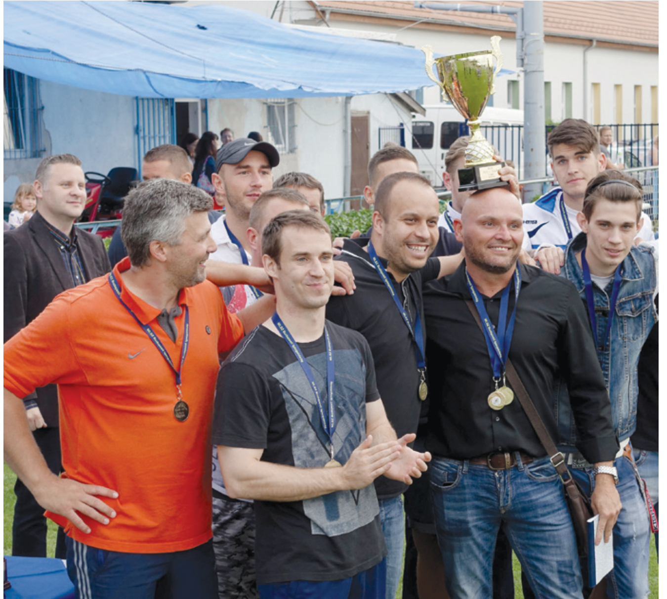
A nyári ünneplés után a PSK bátor játékkal bizonyított az élvonalban