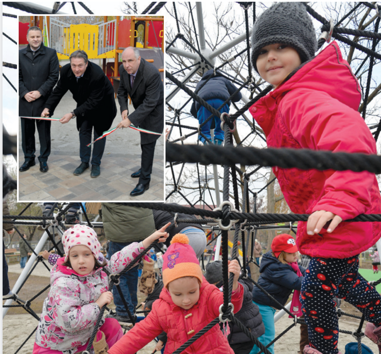
Az átadást követően az óvodások boldogan vették birtokba az új játszótér

A kapunyitást követően benépesültek a mászóakák és a hinták