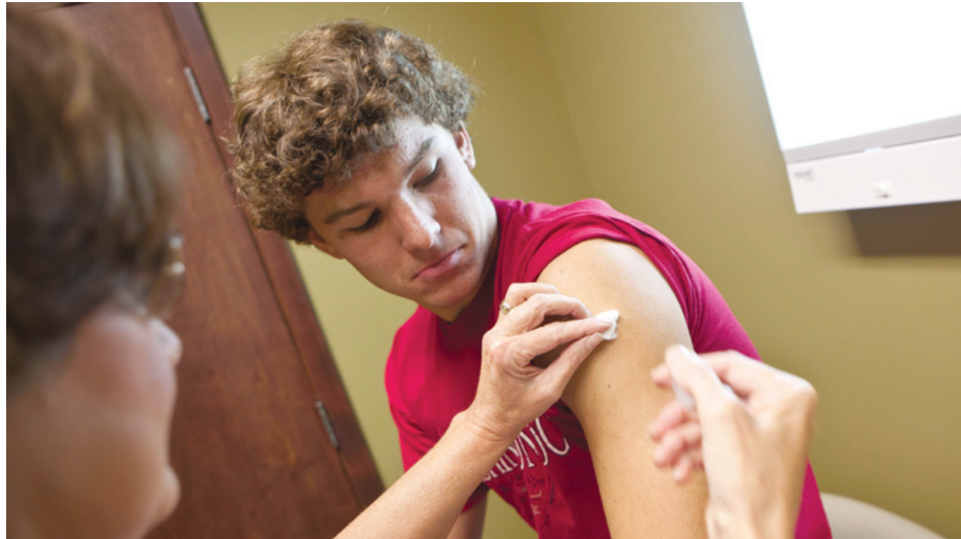
A védőoltás elmaradása sokkal több kockázattal jár, mint az oltás

Az influenza kellemetlen tünetekkel járó megbetegedés, általában szövődmények nélkül, pár nap alatt gyógyul, de sok esetben súlyos szövődményei vannak, és kórházi kezelést