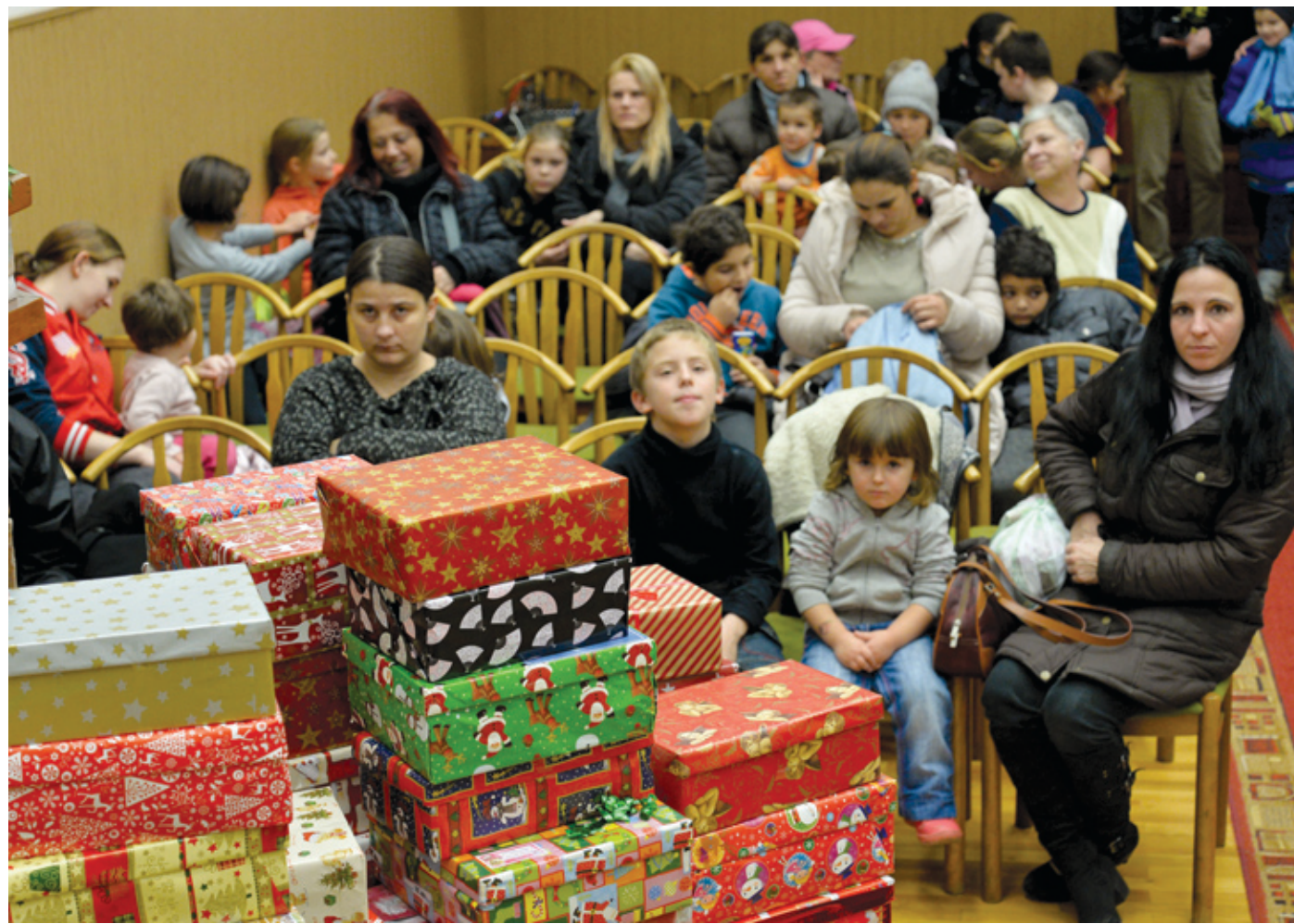
Egy éve karácsonyi koncert keretében 120 ajándékkal megtöltött dobozt adhattak át

kérünk és bátorítunk mindenkit arra, hogy kapcsolódjon be a továbbadás, az ajándékozás körforgásába. Jézus mondta egyszer: nagyobb boldogság adni, mint kapni. Merjük kipróbálni