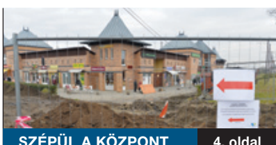
SZÉPÜL A KÖZPONT

A Thököly úton a nagykönyvtár, a Karinthy Frigyes Gimnázium és a Lőrinci Sportcsarnok által közrefogott területen új játszótér épült, amelyet november 18-án adtak át. Az 1640 négyzetméteres, biztonságosan elkerített terület a csecsemőktől egészen a 14-15 éves korosztályig kínál játéskapcsolódási lehetőséget, és bőven van hely futkározásra is.