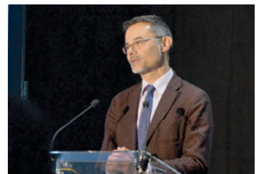
Az ARC első ízben rendezte féléves értekezletét hazánkban

„Ehhez járul hozzá kerületünk a maga eszközeivel. A budapesti légikikötő versenyképességének megőrzése, fejlesztése érdekében kerületünk sikeresen zárta le az airLED elnevezésű EU-s projektet, megalapította a BUD Klasztert, amelyben önkormányzatunk vezető szerepet tölt be, és számtalan, a mai tanácskozáshoz hasonló alkalmat teremtettünk arra, hogy meghallgassuk a szakembereket, és valóban éljünk a tudástraszfer lehetőségével. Emellett Pestszentlőrinc-Pestszentimrén régóta építjük tudatosan partneri kapcsolatunkat a Liszt Ferenc Nemzetközi Repülőtérrel működtető Budapest Airport Zrt-vel. Ez a kapcsolat példaértékű, és a sikeres projekteink megkérdőjelezhetetlen referenciát és olyan tudástöket jelentenek, ame-