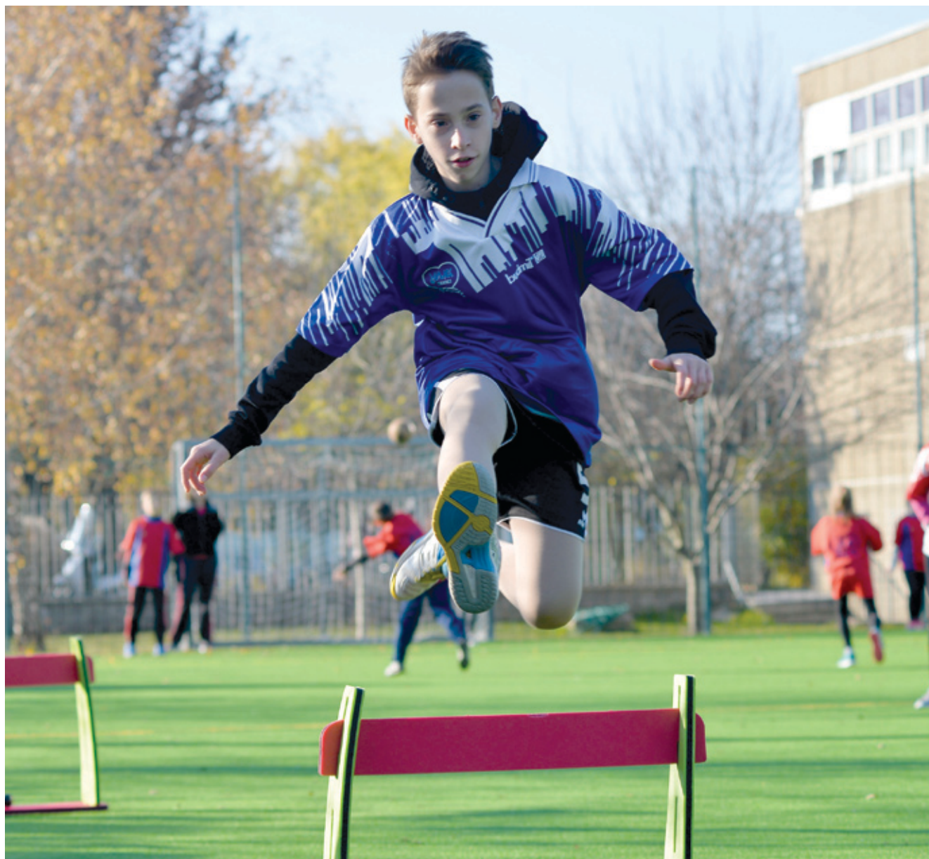
A Vajk-sziget iskola megújult sportudvarát azonnal birtokba vették a diákok

➤ Felújított műfüves pályát vehettek birtokba november első hetében a Vajk-sziget Általános Iskola diákjai, akik a megnyitón látványos sportműsorral kedveskedtek a vendégeknek, bizonyítva, hogy jó műfüre kerültek a forintok.