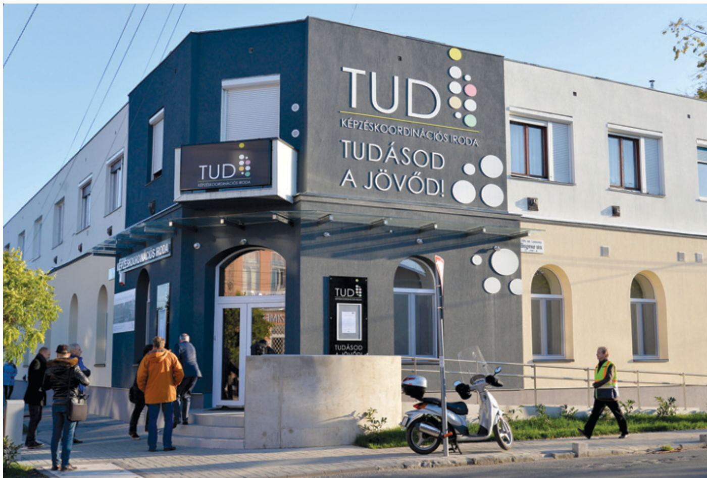
A Hengersor utca és az Üllői út sarkán az önkormányzat kezdeményezésére, a Norvég Alap támogatásával jött létre a TUD18 Képzéskoordinációs Iroda

A képzési programot részletes repülőtéri és kerületi munkaerő-piaci elemzés alapozta meg, amit az élethosszig tartó tanulás és a felntők képzés terén gazdag tapasztalatokkal rendel-