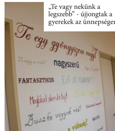
„Te vagy nekünk a legszebb” – újjongtak a gyerekek az ünnepségen