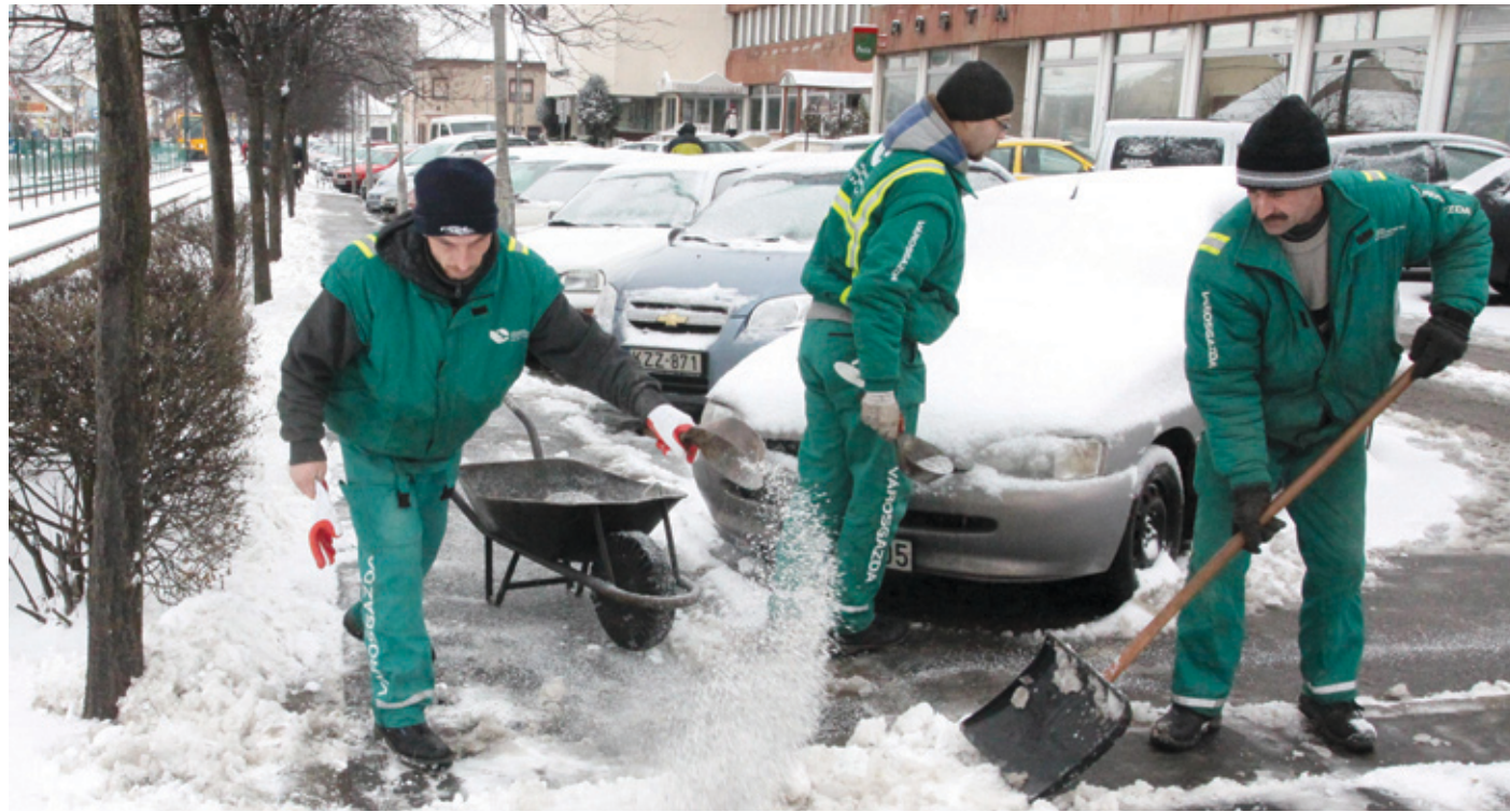
A jégmentesítéshez az elmúlt években megszokott módon környezetbarát anyagot használ a Városgazda

hóolvadásig a Városgazda Zrt. kipróbált csapata.