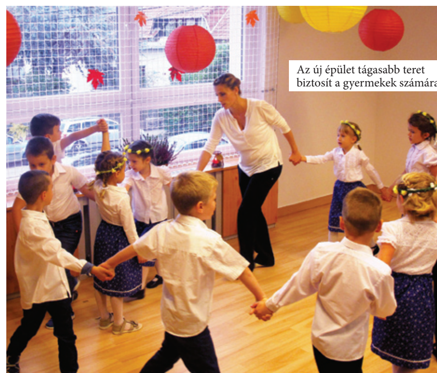
Az új épület tágasabb teret biztosít a gyermekek számára