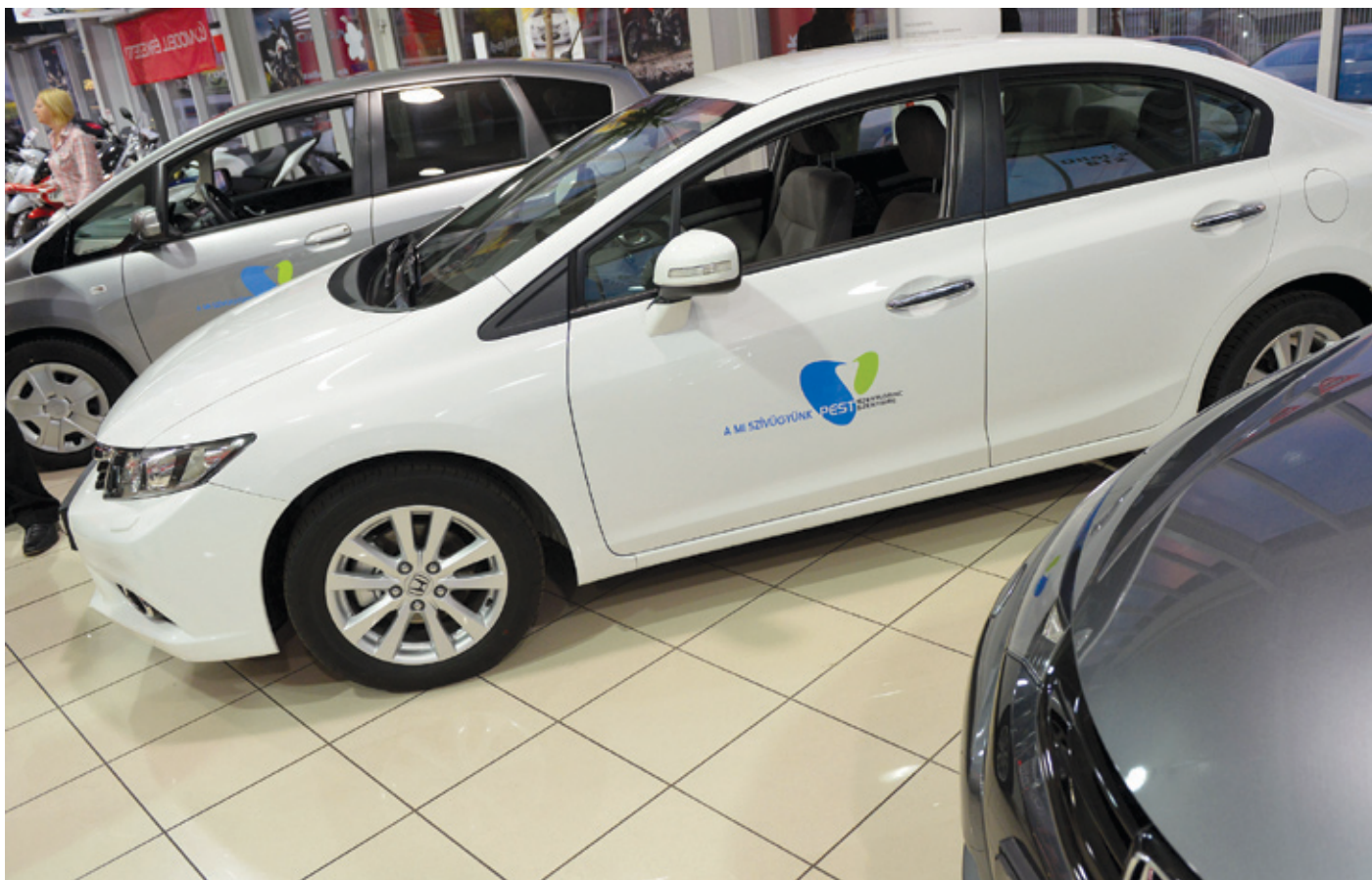
A környezetkímélő Honda hibridautók évek óta róják a kerület útjait

A környezettudatosság határozza meg az önkormányzat további fejlesztéseit is