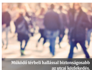
Működő térbeli hallással biztonságosabb az utcai közlekedés.

Fontos, hogy a közvetlen környezetből érkező visszajelzések hatékonyan ráirányíthatják az érintett figyelmét a problémára, és így idővel