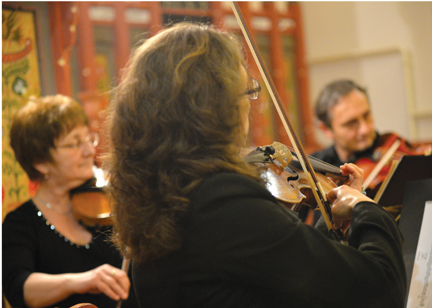
A templomban a MÁV Szimfonikusok kamarazenekara vonósnegyesre írt műveket adott elő

Egy évszázad szolgálat, egy hónap emlékezés