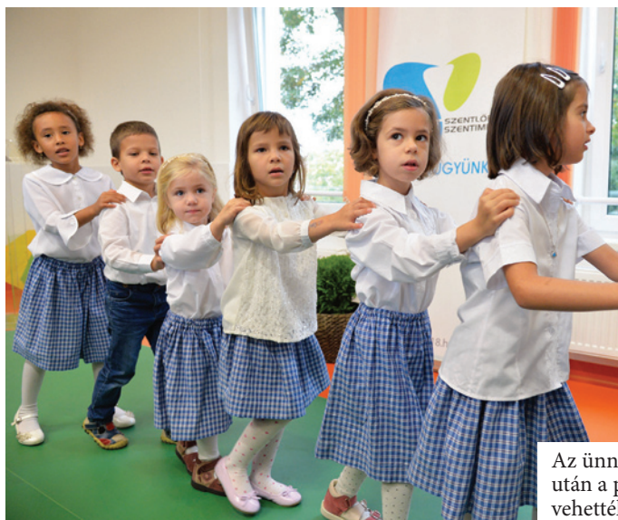
Az ünnepélyes szalagátvágás után a picik egyből birtokba vehették a kibővített óvodájukat

A kertrendezés költsége (bruttó) 9 982 200 Ft