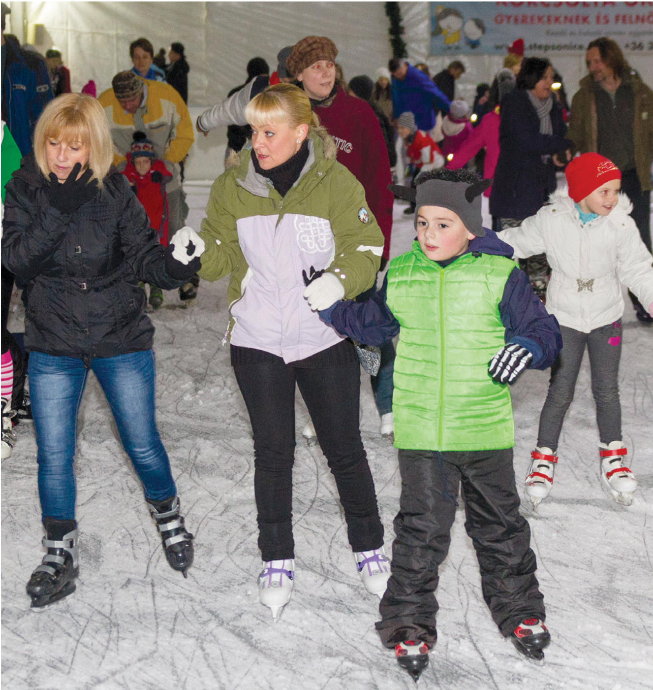
A jégpálya a tervek szerint adventtől egészen február 19-ig várja majd a korcsolyázókat

➤ Az elmúlt évhez hasonlóan idén is fedett lesz a jégpálya a régi piactéren. Évek óta tartalmas szórakozást nyújt a téli sportok kedvelőinek a XVIII. kerületi alkalmi jégfelület, amely advent első hétfőjén, november 26–27-én nyit, és a tervek szerint egészen február 19-ig várja majd a korcsolyázókat.