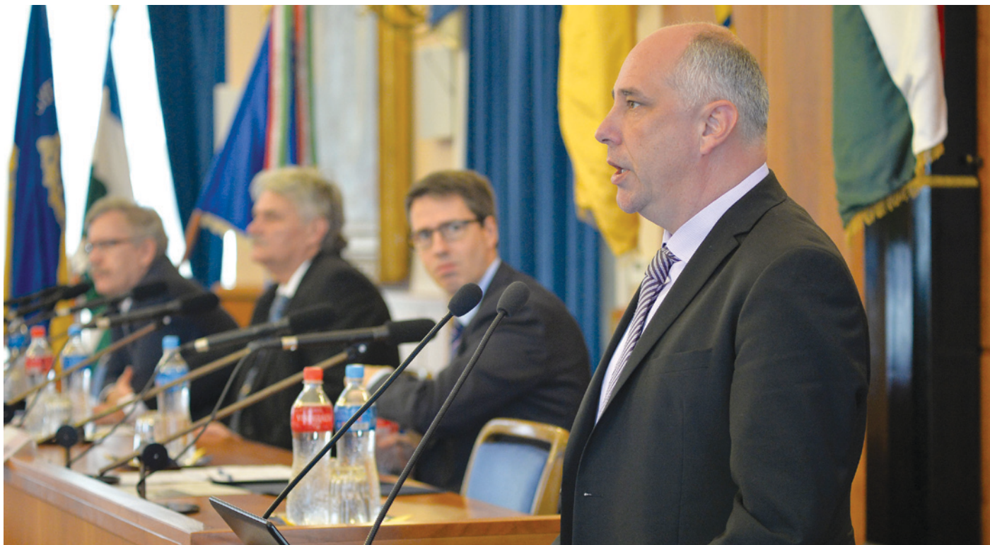
Ughy Attila polgármester örömmel számolt be a repülőtéri klaszter első eredményéről, amely új munkahelyeket teremt

arra, hogy képeznek magukat, nyelveket tanuljanak, és így magasabb rendű munkát végezve magasabb bérhez jussanak.