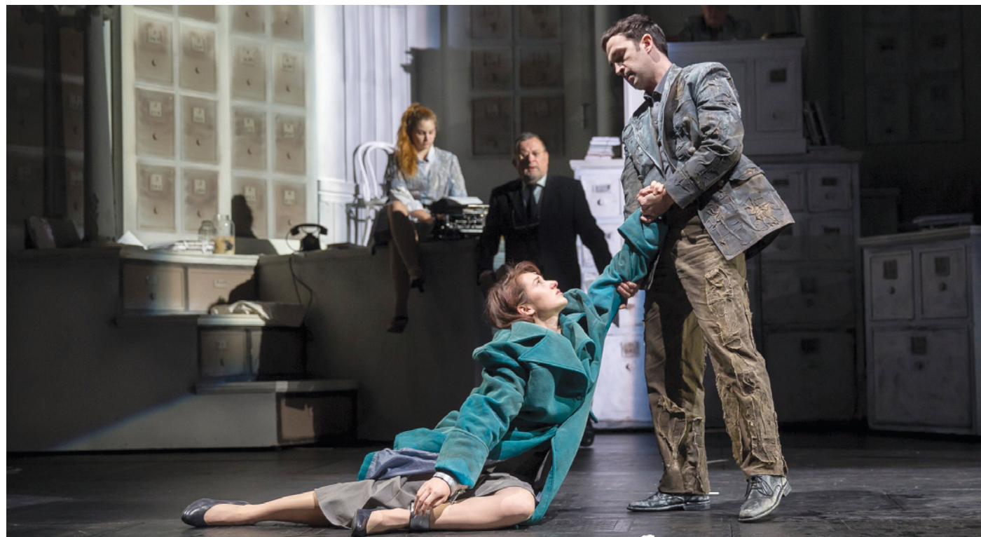
Szemünk előtt törnek össze, aláznak meg egy tiszta és ártatlan lelket

Szilágyi Andor darabjának bemutatója kapcsán