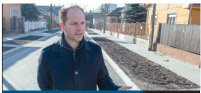
A LAKÓK ÉRDEKÉBEN

Az elmúlt évhez hasonlóan idén is fedett lesz a jégpálya a régi piactéren. Évek óta tartalmas szórakozást nyújt a téli sportok kedvelőinek a XVIII. kerületi alkalmi jégfelület, amely advent első hétvégéjén, november 26–27-én nyit, és a tervek szerint egészen február 19-ig várja majd a korcsolyázókat. A jégfelület mérete azonos lesz a tavalyival.