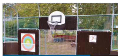
ÚJABB MŰFÜVES PÁLYA