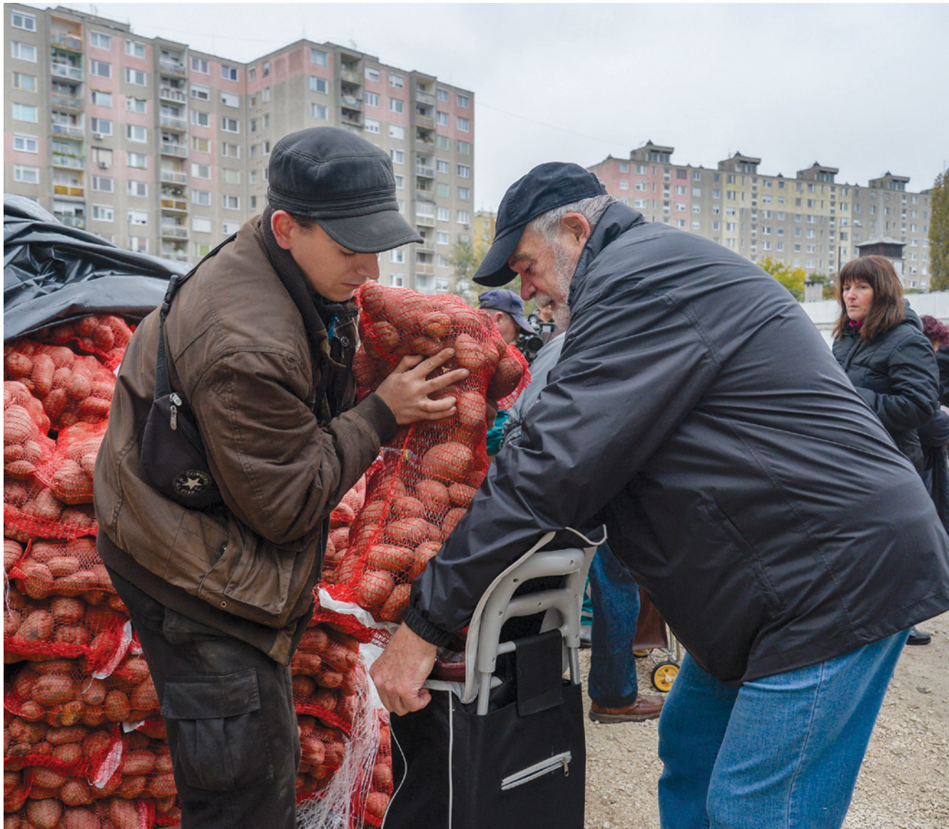
A jó minőségű, csaknem 300 tonna burgonya idén is Kiskunlacházáról érkezett

Az akció keretében fejenként 15 kilogramm burgonyát lehetett hazavinni