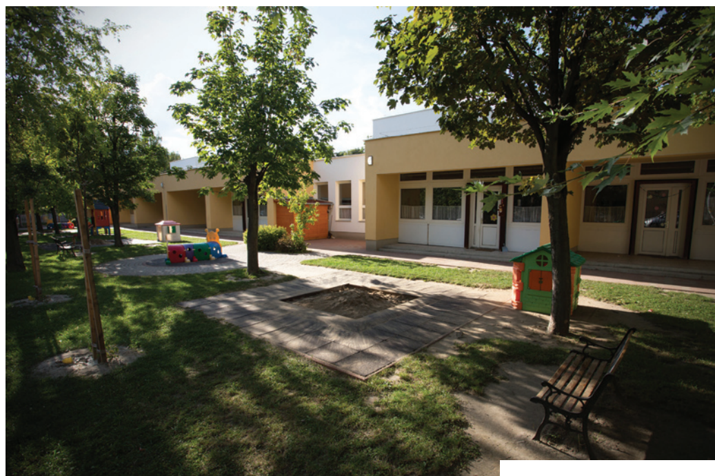
A gyermekek a felújításnak köszönhetően korszerű környezetben tölthetik a mindennapjaikat

kenjenek Pestszentlőrinc-Pestszentimre oktatási-nevelési intézményeinek a működési költségei, ezáltal is megteremtve gyermekeink, unokáink energiabiztonságát. A korszerűsítés során kiemelt szempont volt a megújuló energiaforrások hasznosítása, így a használati meleg víz biztosítása érdekében napkollektorokat szereltek az épület tetejére. Az energetikai korszerűsítés nyomán jelentős mértékben csökken az intézmények