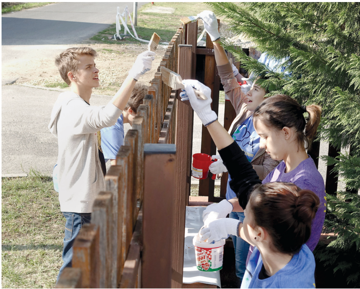
Az önkéntesek a pestszentimrei Bababirodalom bölcsődében munkálkodtak – kompromisszum nélkül

– Már negyedik éve fogom össze, szervezem ezt a rendezvényt, s mondhatom, mindig élmény, mert azt tapasztalom,