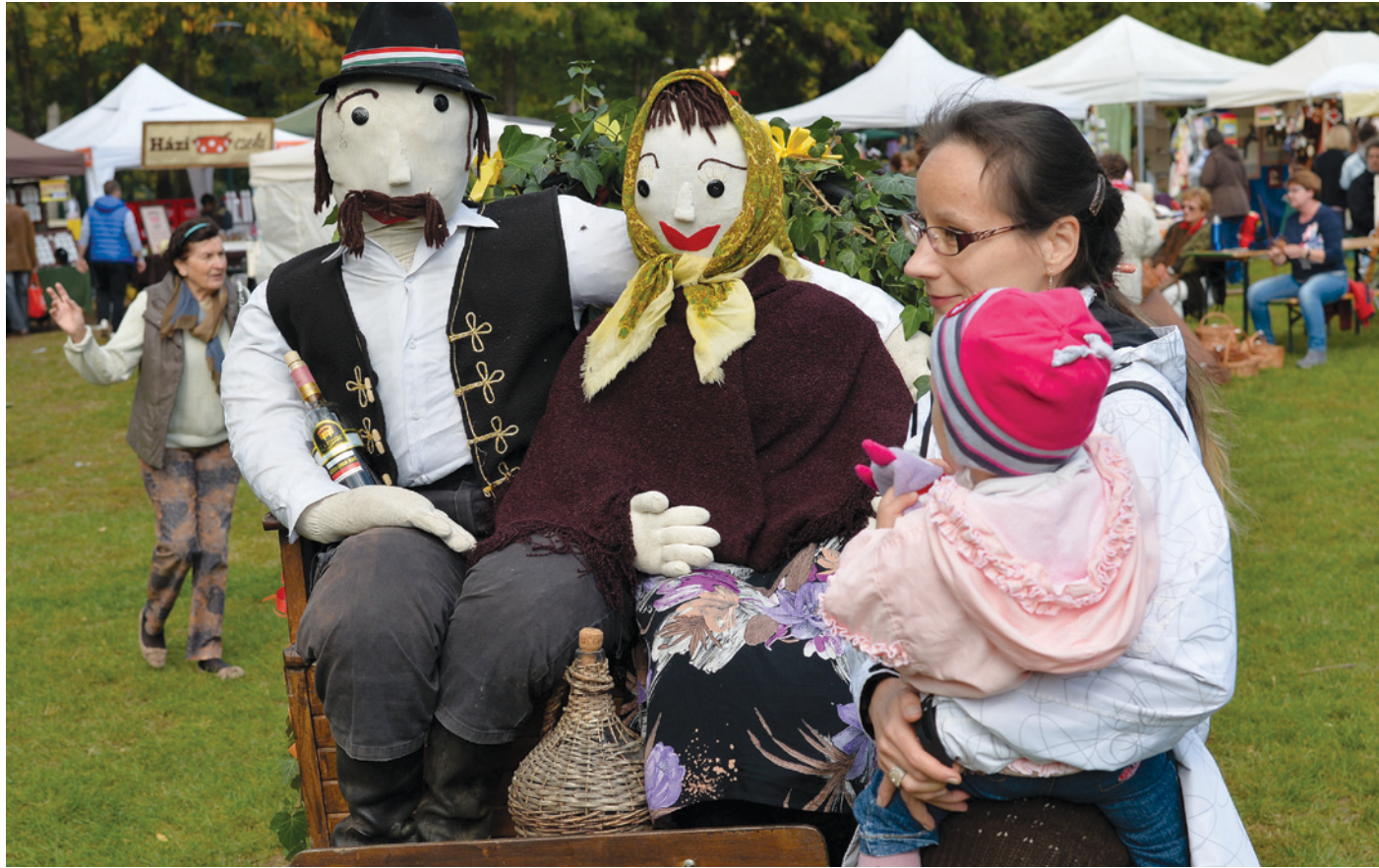
A vidám hangulatú vásárra idén is több ezren voltak kíváncsiak

A keretek az elmúlt másfélszáz évét idézik, de tartalmi