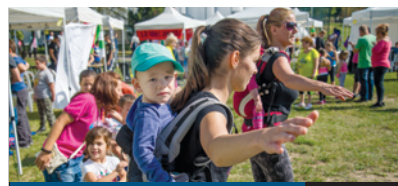
ÍZLELTÜK A SPORTOT

A hagyományos falusi vásárok hangulatát idézi ismét a Vasármapi Vásári Vigadalom, amelyet október 9-én hatodik alkalommal rendeznek meg a Bókay-kertben. A szervező Zöld Sorompó Egyesület célja nem csupán az egykori vásárok hangulatának a felidézése, hanem az is, hogy a minőségi kézműves árut közvetlenül az előállítóktól vehessük meg.