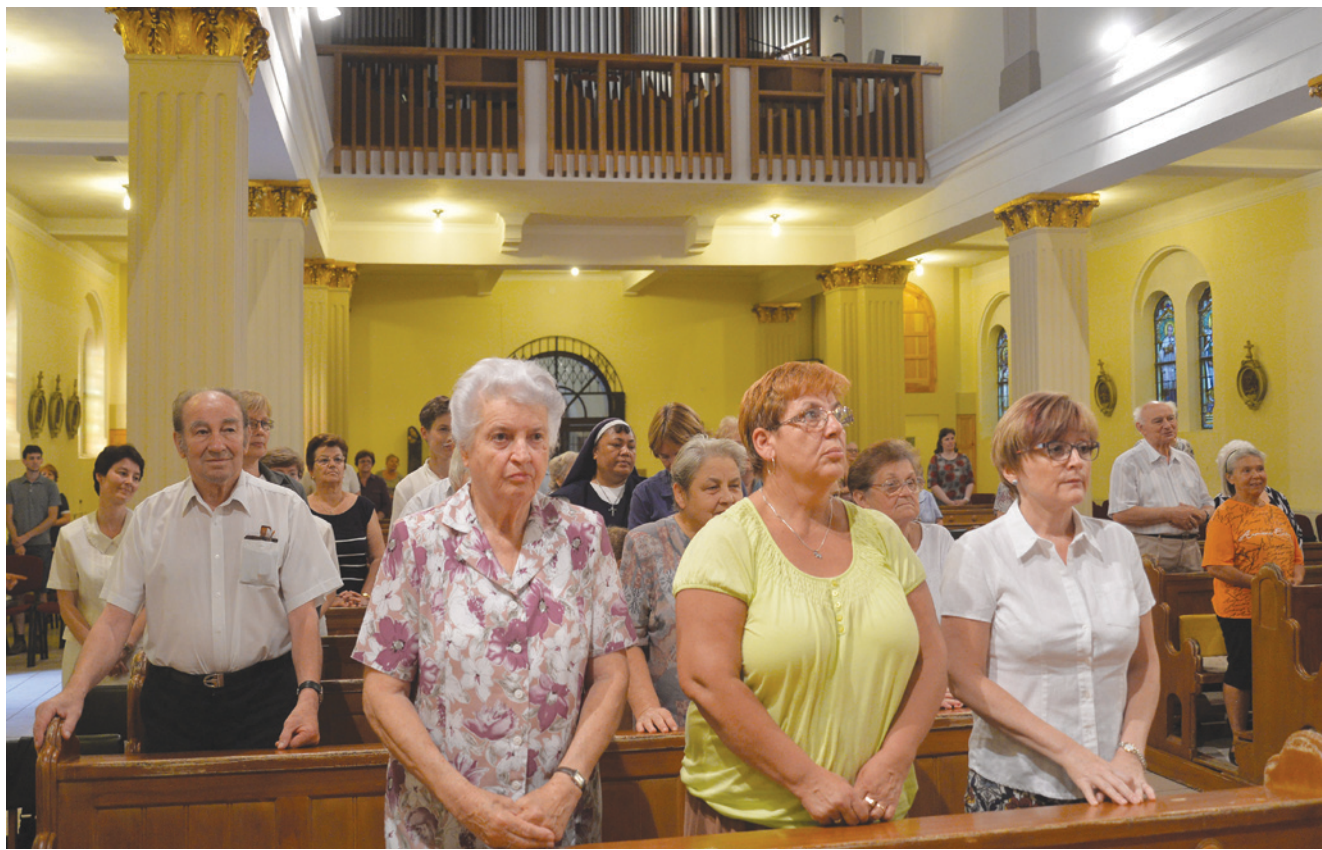
Az ünnepi szentmise minden jelenlévőnek emlékezetes marad

Kilencvenéves a Mária Szeplőtelen Szíve-plébániatemplom