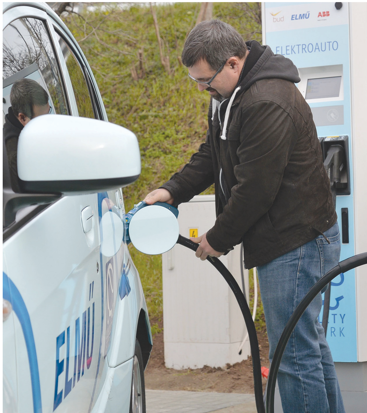
A tervek szerint a kerületben első lépésként két helyen létesítenek elektromos töltőállomást

Apró, de fontos dolgokról szavazott a képviselő-testület