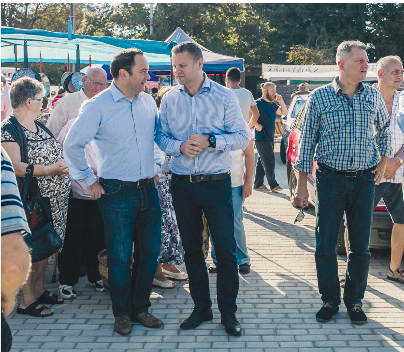
Az új piac nem csupán bevásárlóhely, hanem a pestszentimreik találkozási pontja is