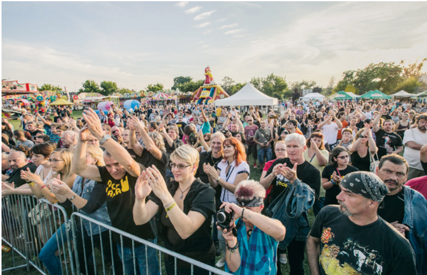
A Szeptemberi Kóstolóra minden évben sok ezren látogatnak ki a Bókay-kertbe

A hajdan volt A3 televízió előtt eltöltött klipnézetős délutánok is felidézhetőek azokban, akik rápillantanak a szeptember 9–11-i hétvégén zajló Szeptemberi Kóstoló programjára: a mai negyvenesek ugyanis a húszas éveikből ismerhetnek jó néhányat a fellépők közül, akik e csatornán voltak láthatók rendszerint egymást követően. Ez nem véletlen, hiszen manapság a „retro” jegyében már a kilencvenes évtized iránti nosztalgia idejét éljük, a közönség szívesen hallgatja újra az akkori nagy slágereket. A rendezvény főnapján, vagyis szombaton a Nagyszínpadon fellépő sztárok zöme ebben a korszakban vált ismertté: az azóta is töretlenül népszerű Irigy Hónaljmirigy, a Fekete Vonat után szóló előadóként és televíziós személyiségként is sikeres L.L. Junior, a futball-Eb magyar szurkolói himnuszát (Az éjszaka soha nem érhet véget) megalkotó Soho Partyból ismert Betty Love és a korszak talán legjobb partizenekara, a Kozmix.