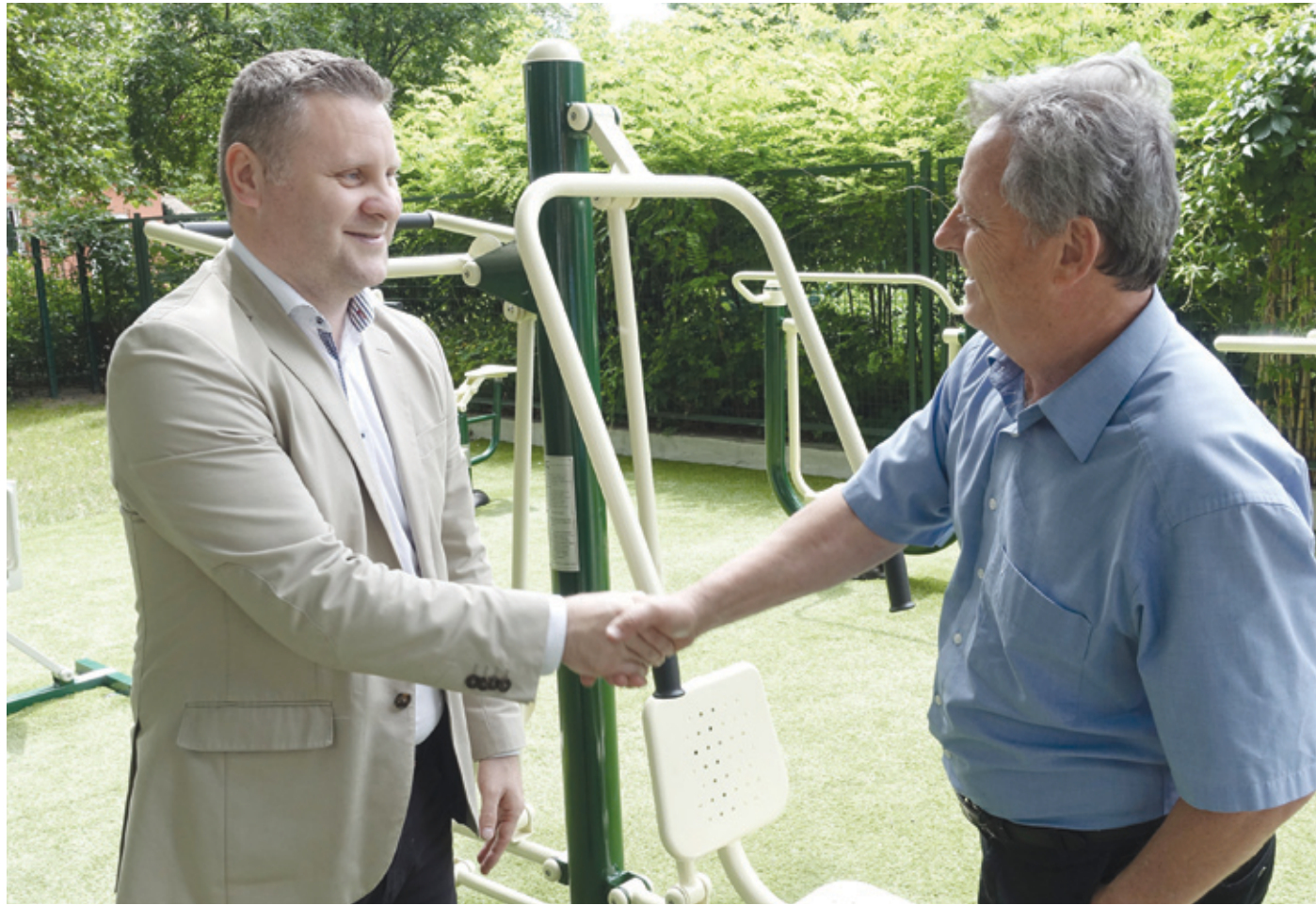
A tavasszal átadott szabadtéri fitnessparkok után hamarosan további 12 létesülhet

A szabadtéri edzés terjedését mostantól a Nemzeti Szabad-