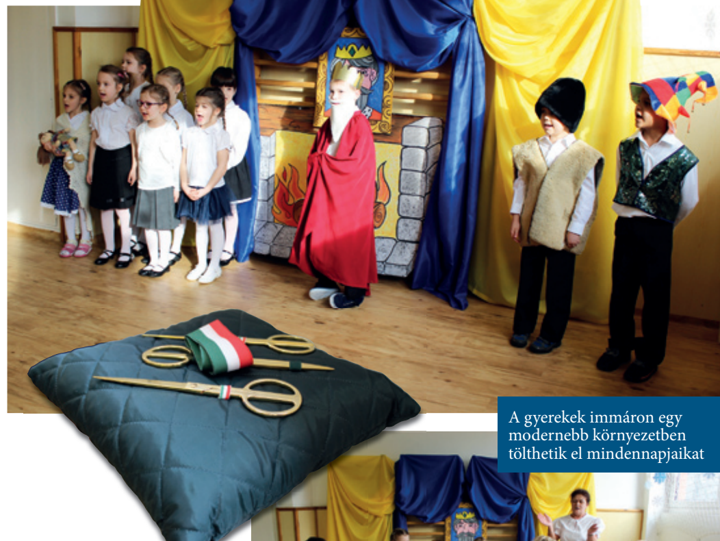
A gyerekek immáron egy modernebb környezetben tölthetik el mindennapjaikat