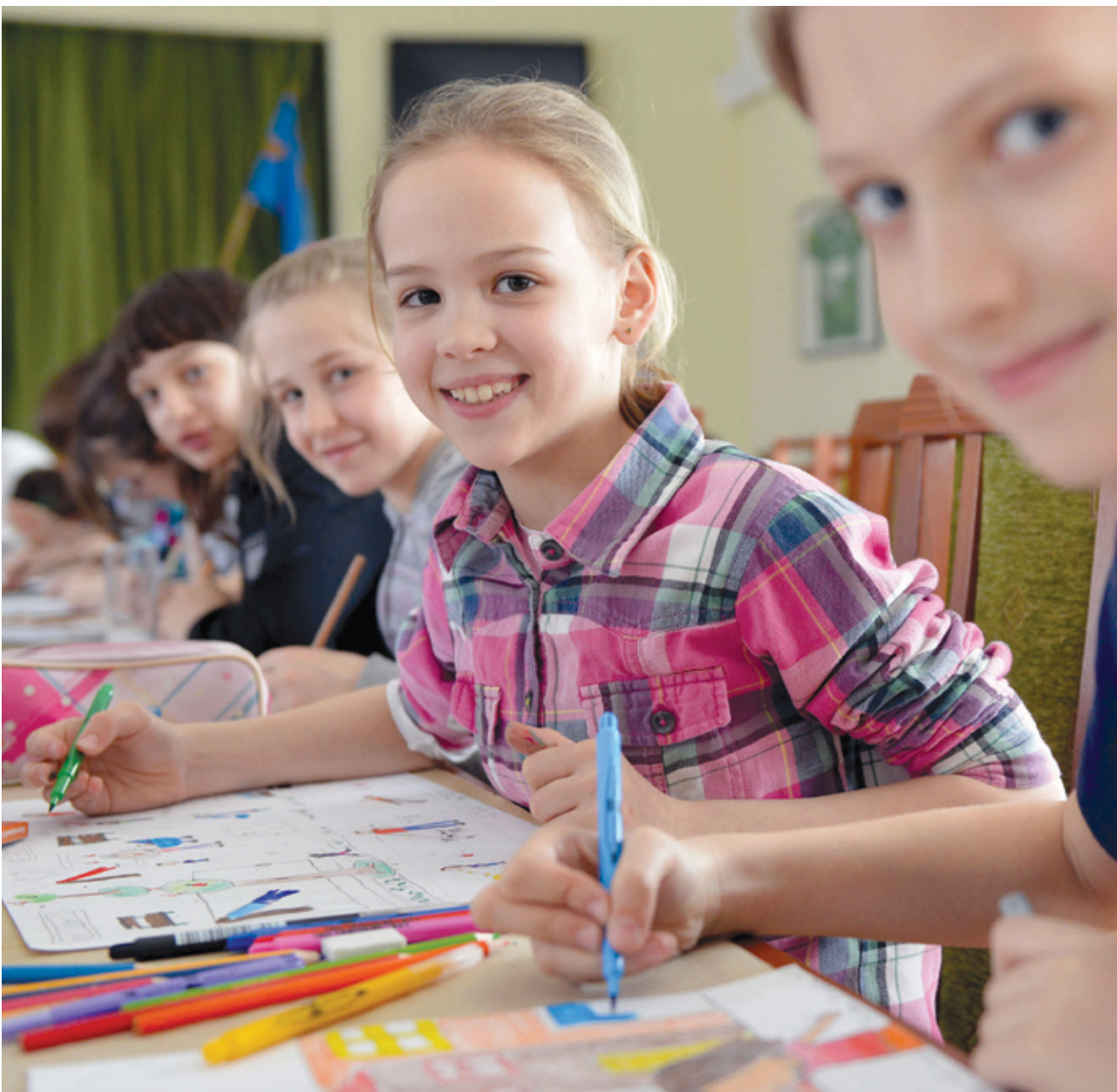
A füzetek borítója évek óta egyedi tervezésű, az előző tanévben kiírt „Kedvenc tantárgyam” rajzpályázat legjobb munkái díszítik

Harmadik éve segíti az iskolakezdetet ingyenes füzetcsomaggal Pestszentlőrinc-Pestszentimre önkormányzata. A tanévnyitó alkalmával ezúttal 8632 kerületi általános iskolás kapja meg a csomagot.