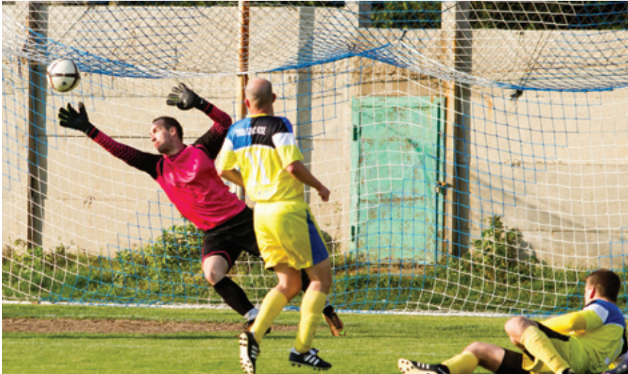
KOMOLY CÉLOK A LEGPATINÁSABB LŐRINCI KLUB ELŐTT

A nemzeti labdarúgó-bajnokság harmadosztályában szeretne játszani a felnőtt csapattal öt év múlva az 1908 SZAC-Budapest. Mindezt egy újszerű, kifejezetten a kerületi fiatalokat ösztönző utánpótlás-nevelési rendszer létrehozásával igyekeznek elérni.