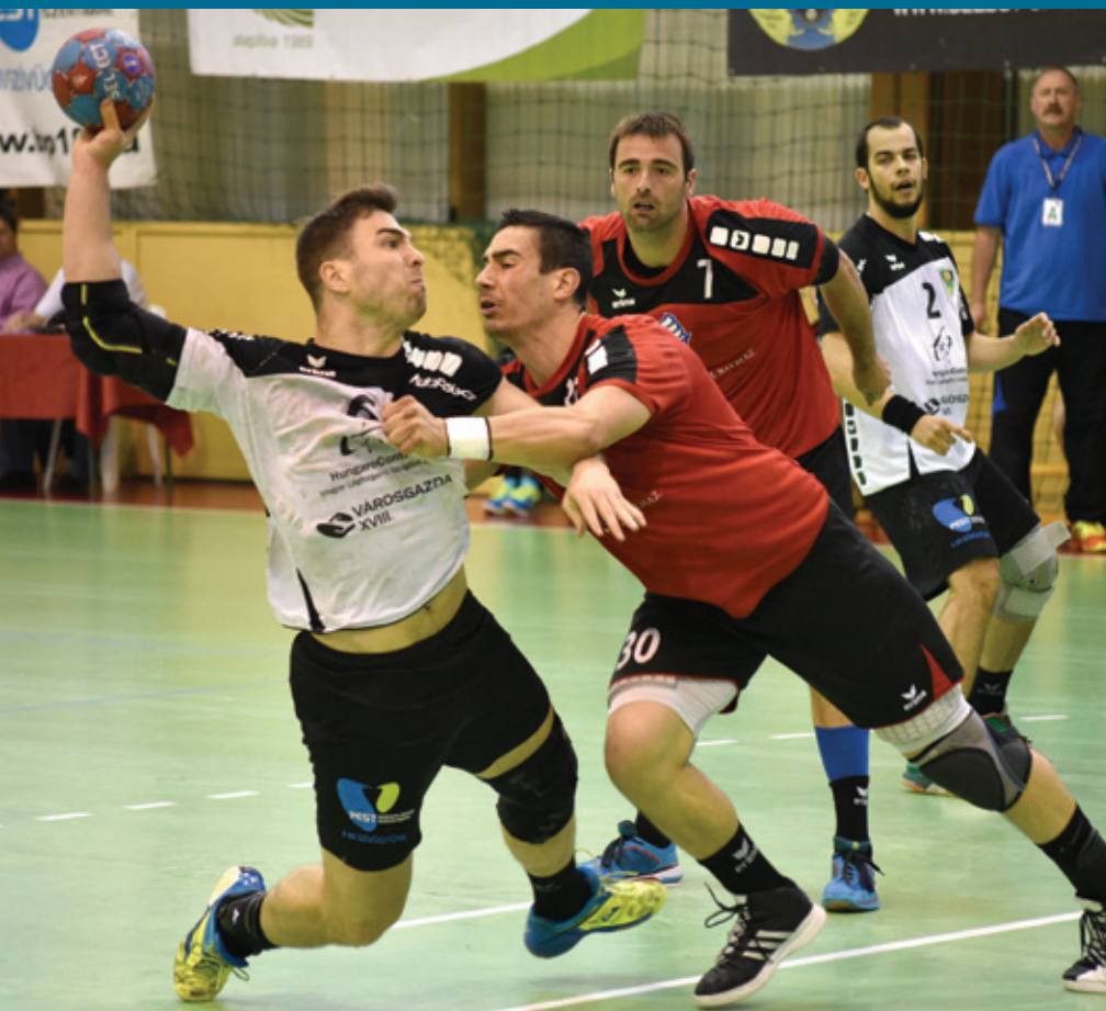
A GYERMEKEKTŐL A FELNŐTTEKIG DOBÁLJÁK A LASZTIT