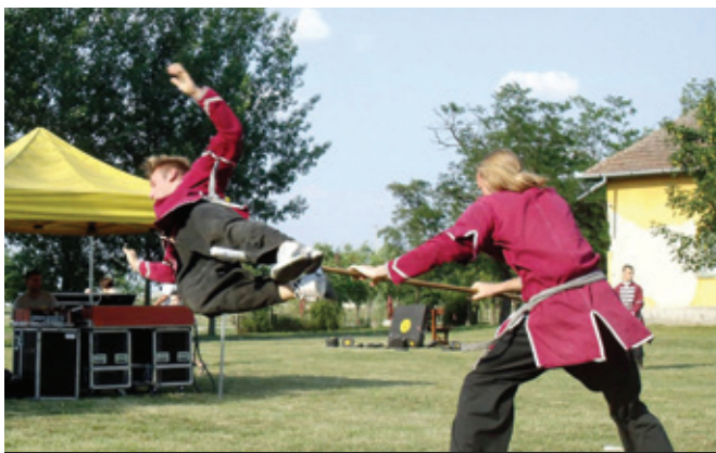
Béri Balogh Ádám Baranta Egyesület