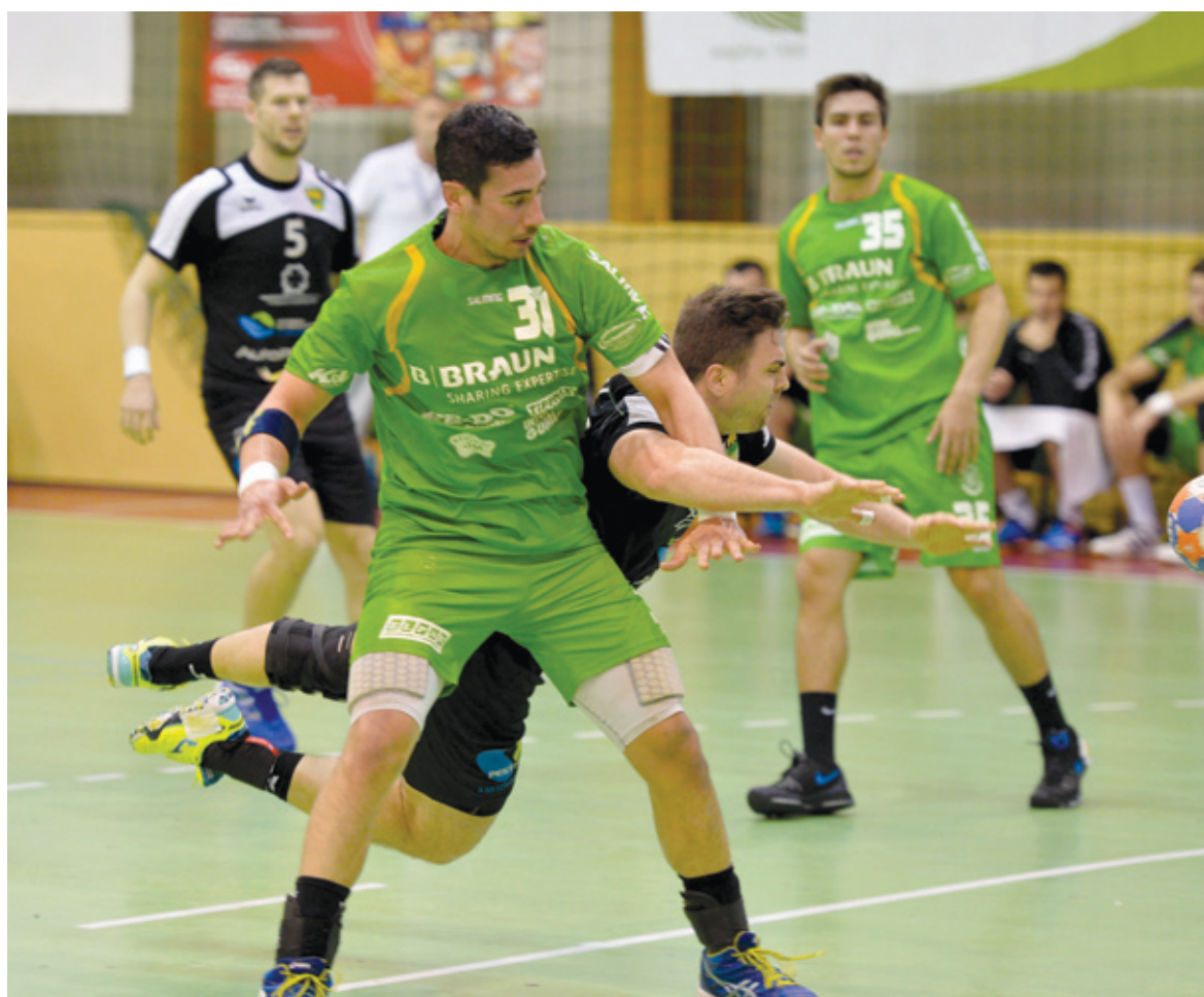
A Gyöngyös és az Orosháza elleni győzelemmel a PLER elkerült a kiesőzónából

Erőltetett menetben játszotta a mérkőzéseit március 19. óta a lőrinci kézilabdacsapat, ugyanis az alapszakasz után megkezdődött a bajnokság legizgalmasabb és tán legkegyetlenebb szakasza. Az alsóházi rájátszás, amelynek a végén két csapat búcsúzhat az első osztálytól, míg a többi boldog lesz, hogy az őstől is a legjobbak között szerepelhet. Az első négy fordulót három sikerrel, egy vereséggel vívta meg a PLER-Budapest.