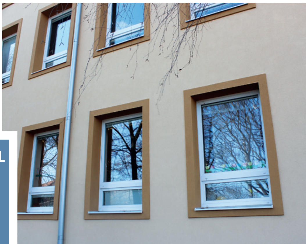
A sikeres fejlesztések a gyerekek jövőjét életre szólóan meghatározzák

” A FEJLESZTÉS HOZZÁJÁRUL AHHOZ, HOGY AZ ISKOLA TOVÁBBRA IS MEGHATÁROZÓ SZEREPET TÖLTSSÖN BE A KERÜLETBEN. ”