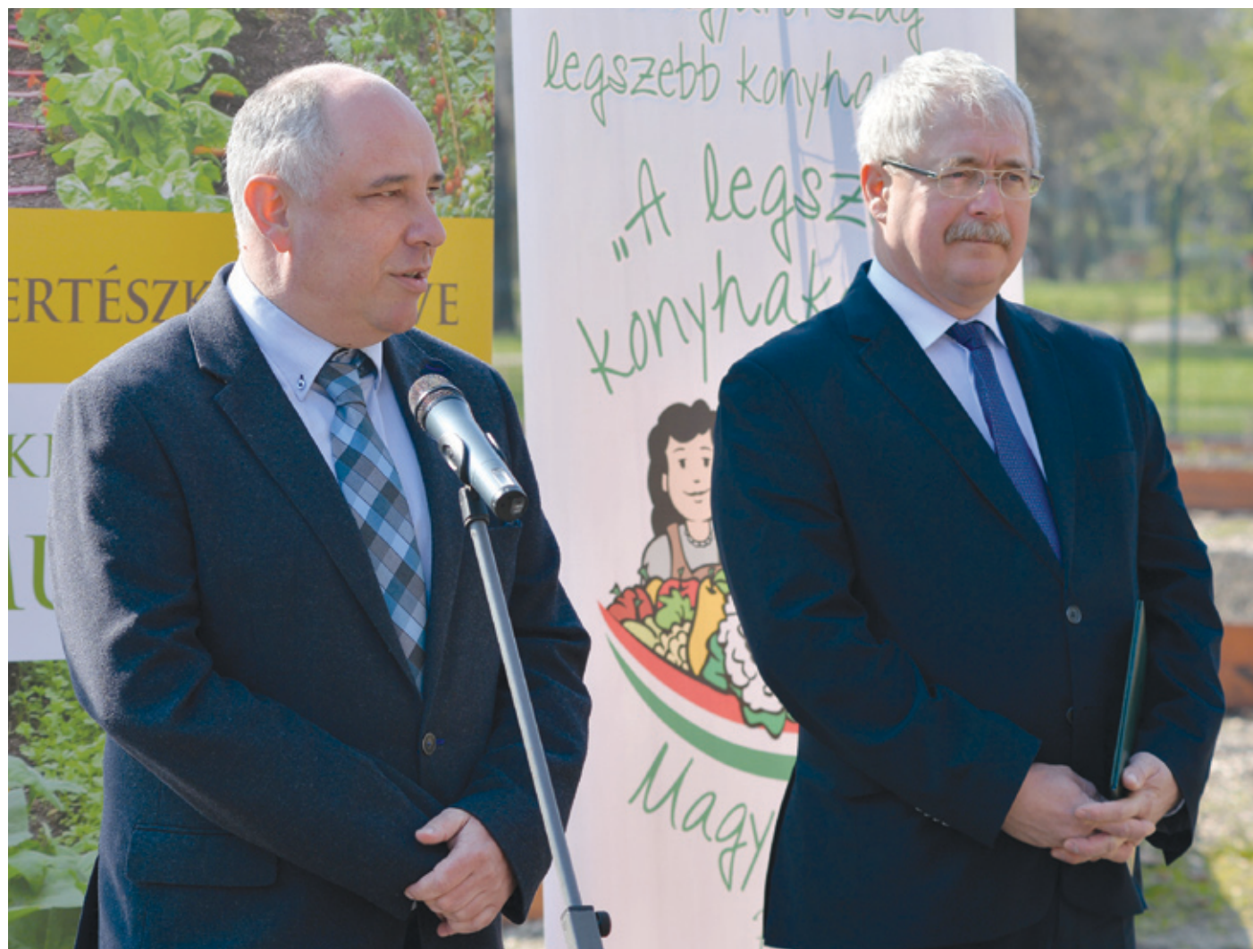
Ughy Attila polgármester és Fazekas Sándor földművelésügyi miniszter indította el a Kertészkedés Éve programsorozatot

– A kertészeti ágazatok összes kibocsátása 2015-ben mintegy 377 milliárd forint volt, ami a teljes mezőgazdasági kibocsátás 15,4 százalékát tette ki. Ezen alapul a magyar zöltség- és gyümölcsfogyasztás is, amely tavalyelőtt átlagosan csak mintegy 75 kilogramm zöltséget és mintegy 39 kilogramm gyümölcsöt jelentett. Emiatt a programsorozat célkitűzése az is, hogy a magyar emberek minél több zöltséget és gyümölcsöt termeljenek, vásároljanak és fogyasszanak. A szaktárca a zöltségfogyasztást évi 85 kilogrammra, a gyümölcsfogyasztást 45 kilogrammra kívánja emelni – mondta Fazekas Sándor földművelésügyi miniszter Gyümölcsoltó Boldogasszony napján a XVIII. kerületi Szi-