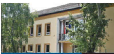
FELÚJÍTÁSOK 3. oldal

Mintegy ötven társasház megközelítőleg 700 albetéjének átfogó képviselőségét látja el a kerületi lakótelepeken és kertes házas övezetekben a TH18 Létesítménygazdálkodási Kft. A társaságot a Városgazda XVIII. kerület Nonprofit Zrt. alapította 2008 októberében. A cég a kerületben számos ház képviselőségét látja el a társasházi törvény előírásai szerint.