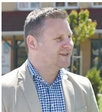
Lévai István Zoltán alpolgármester

Lévai István Zoltán alpolgármester többször kifejtette már, hogy a kerület vezetése, amellyel együttműködik a jelenlegi térfigyelő hálózatot, keresi a lehetőséget a meglévő kamerák karbantartásához, felújításához szükséges források előteremtésére.