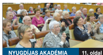
NYUGDÍJAS AKADÉMIA 11. oldal

Civil kezdeményezés indított újtárra egy olyan színházi előadást, amelyik a magyar közelmúlt egy fontos mozzanatát dolgozza fel: a Vasvári egyesület több bemutatót szervezett és szervez az 1990-es marosvásárhelyi eseményeket és azok következményeit felidéző darabnak. A civil szervezet országos nyilvánosságot szeretne a Puczi Béláról szóló előadásnak.