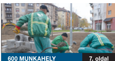
600 MUNKAHELY 7. oldal

Energetikai beruházás lezárásával kezdődött az év a Bókaytelepen. Már naperőműve is van a Szélmalom utcai Mocorgó óvodának. Az intézmény erre a zöldenergiát hasznosító eszközre egy átfogó energetikai korszerűsítés révén tett szert. A januárban átadott beruházás a kormány támogatásával, az Új Széchenyi Terv keretében valósulhat meg.