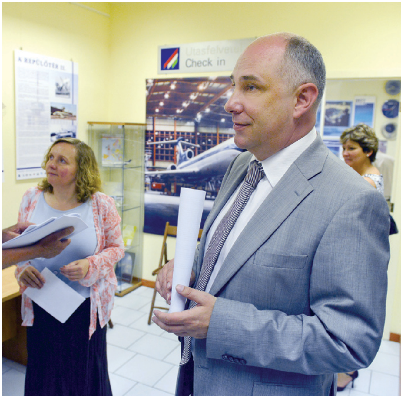
A Liszt Ferenc Nemzetközi Repülőtér ünnepi programsorozata tavaly a repüléstörténeti kiállítással kezdődött

Tavasszal két évfordulóval folytatódik a programsorozat