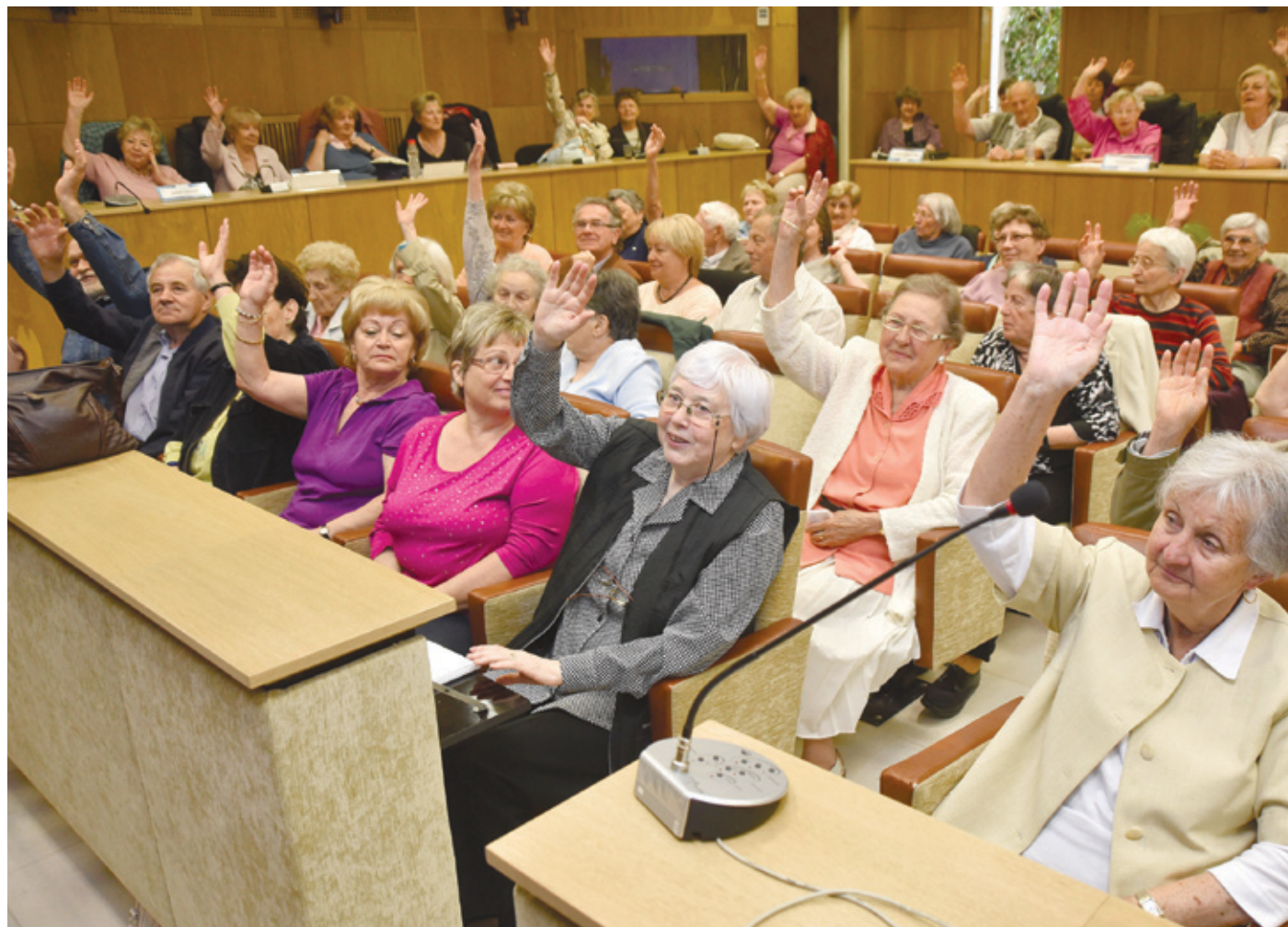
A Nyugdíjas Akadémia második szemeszterének első programja február 20-án lesz

A tanfolyamok népszerűségét bizonyítja, hogy az akadémia mára kinőtte a városháza épületét. A több mint 500 fős létszám megfelel egy iskolának,