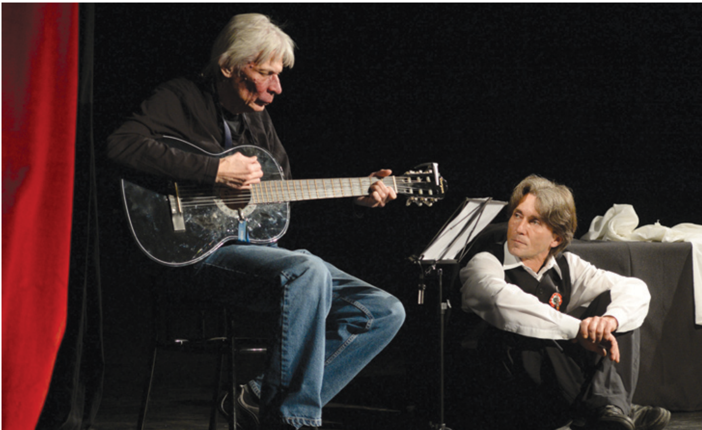
Puczi Béla történetében egyszerre jelenik meg az erdélyi magyarok és az erdélyi magyar cigányok sorsa

Az 1990-es marosvásárhelyi eseményekre mindenki élénken emlékszik, aki érett fejjel érte meg a kelet-európai rendszerváltozások éveit. Sütő András súlyos sebesülése, a magyarokat lincshangulatban körülzáró tömeg, a „Ne féljete magyarok, megjötték a cigányok” felkiáltással a románokra rontó magyar cigányok látványa a fotók-