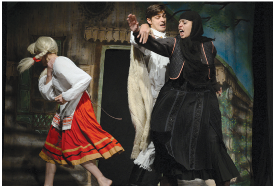
Az önkormányzat támogatási szerződést köt a Lőrinci Színpad Kulturális Közhasznú Egyesülettel

■ 34. Tájékoztatók, bejelentések A képviselő-testület a napirendi pontban nem hozott határozatot.