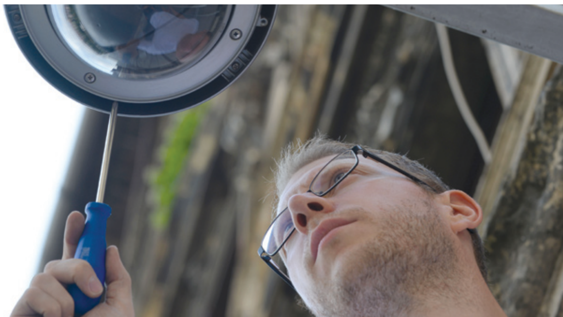
A 360 fokban elforgatható optika vandálbiztosnak nevezhető

Újabb térfigyelők ügyelnek a biztonságra