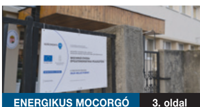
ENERGIKUS MOCORGÓ 3. oldal

Energetikai beruházás lezárásával kezdődött az év a Bókaytelepen. Már naperőműve is van a Szélmalom utcai Mocorgó óvodának. Az intézmény erre a zöldenergiát hasznosító eszközre egy átfogó energetikai korszerűsítés révén tett szert. A januárban átadott beruházás a kormány támogatásával, az Új Széchenyi Terv keretében valósulhat meg.