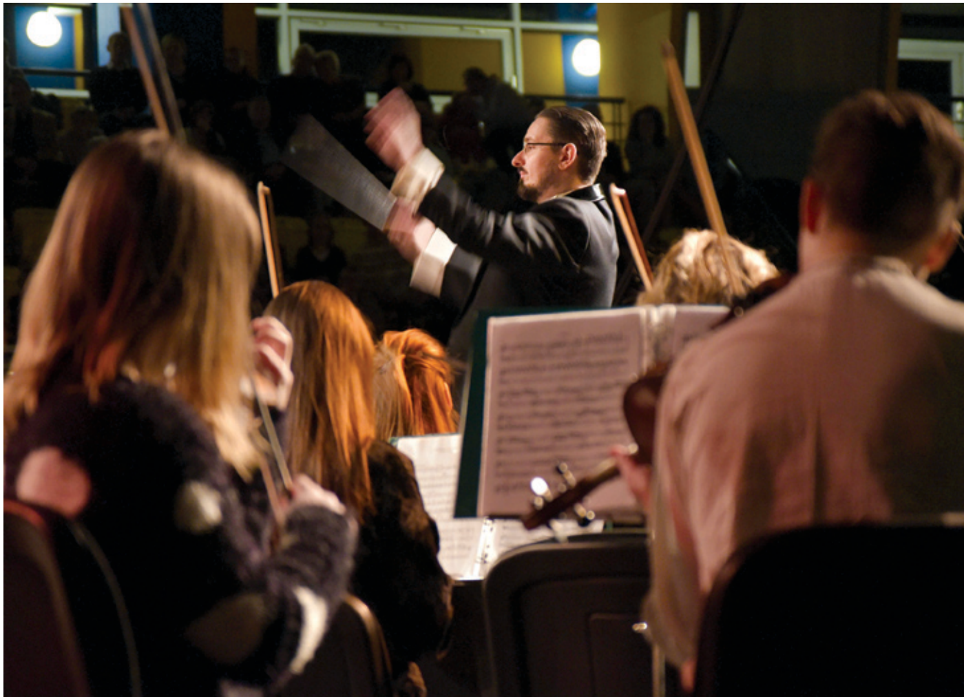
Ide ismét a Pestszentimrei Sportkastélyban indul a koncertév

Az új esztendő első vasárnapjára időzített hangversenyt eleinte felváltva tartották a Lőrinci Sportszarnokban és a Pestszentimrei Sportkastélyban, de úgy tűnik, mára az utóbbiban találta meg végleges otthonát a rendezvény.