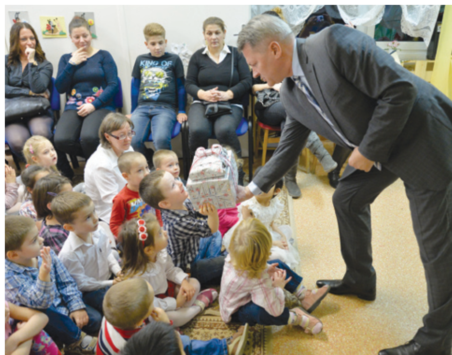
Kucsák László országgyűlési képviselő ajándékot is vitt az óvodásoknak az intézményátadásra

Befejeződött egy felújítási folyamat a Zenevárbán. A Reviczky Gyula utcában lévő óvoda energetikai korszerűsítése során szigetelték a homlokzatot és a tetőt, s új nyílászárókat építettek be.