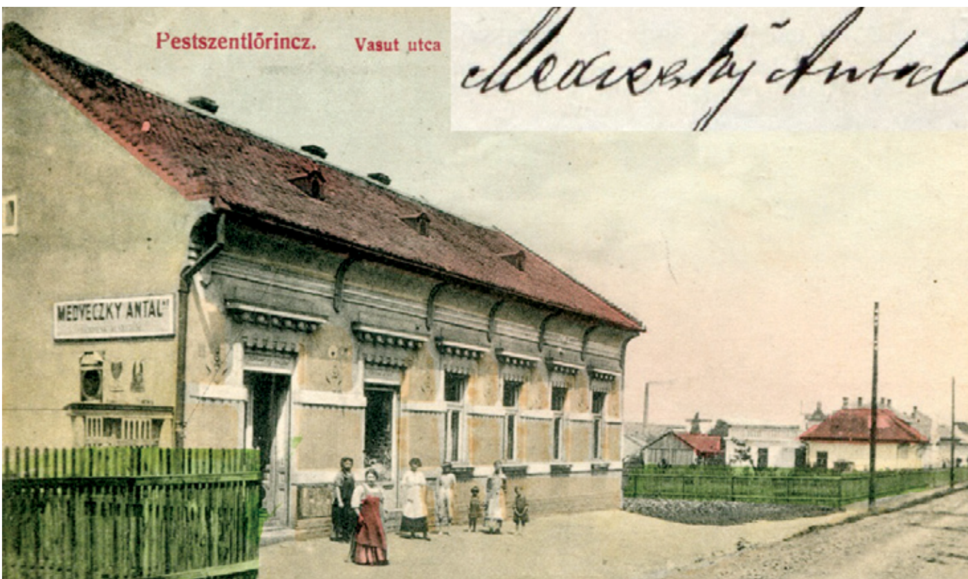
Az önállósodás idején, 1910-ben még hatalmas beépítésre váró területek fogadták a Pestszentlőrincre érkezőket

Lőrinc a szabad, levegős terek, a zavartalan továbbépülés helye