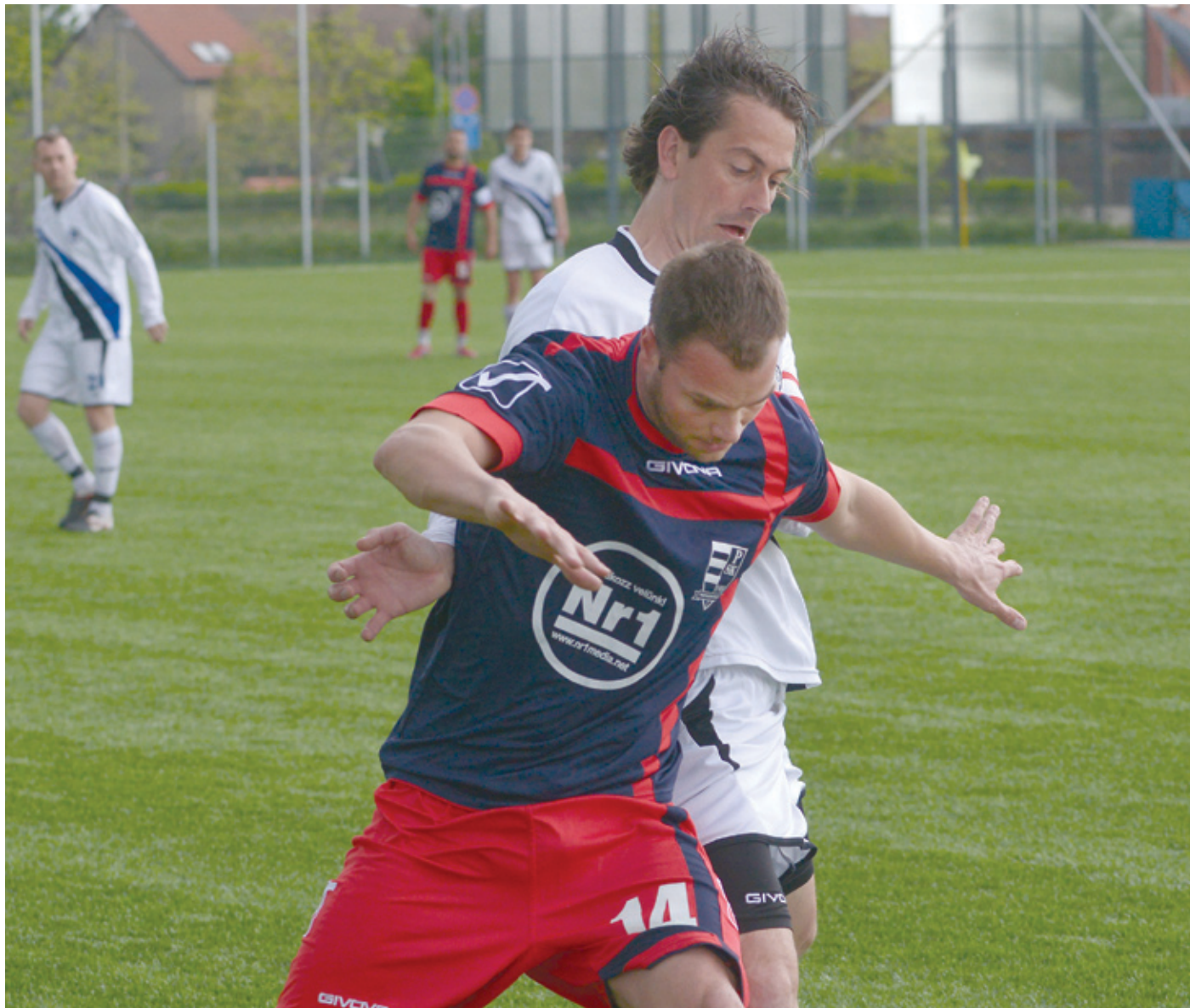
A PSK ősszel elkápráztatta a szurkolóit, érthető, ha tavaszra még merészebb terveket szőnek