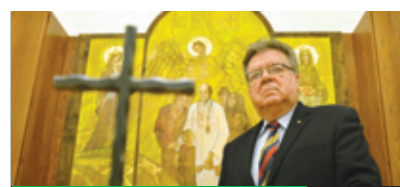
GYÓGYÍTÁS ÉS HIT 20. oldal