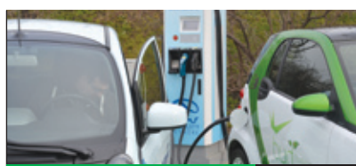
VILLANYAUTÓ 3. oldal

A két pestszentlőrinci önkormányroda összeköltözésével új helyszínen, az Üllői út 445. szám alatt várja a kerületi polgárokat a kormányiroda. A hivatalban a klasszikus kormányablakoknál intézhető ügykörök mellett önkormányrodai ügyekkel is foglalkoznak. December 16-án Vargha Tamás, a Honvédelmi Minisztérium parlamenti államtitkára adta át a korszerű intézményt.