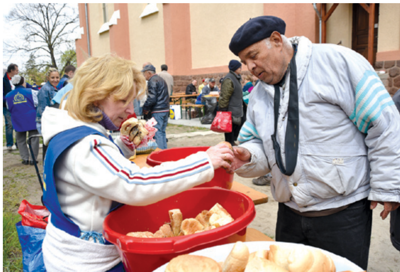
A pestszentimrei híveknek köszönhetően rengeteg házi sütemény várta a rászorulókat