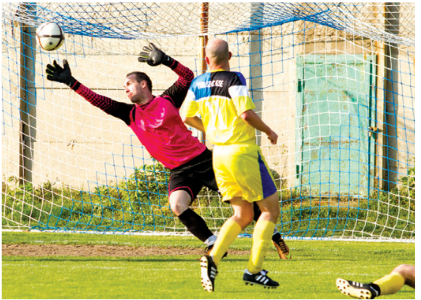
Rangadóhoz méltó izgalmakat hozott az összecsapás, a SZAC az utolsó pillanatban egyenlített ki

A tabellán elfoglalt helyezések alapján és presztízsből is érdekesnek ígérkezett a Pestszentimrei SK és az 1908 SZAC KSE rangadója. A lőrinciek az élmezőny végén kapaszkodnak, míg az imrei együttes stabilan áll a középszakaszban. A PSK-pályára kilátogatók nem is csalódtak a deriben.