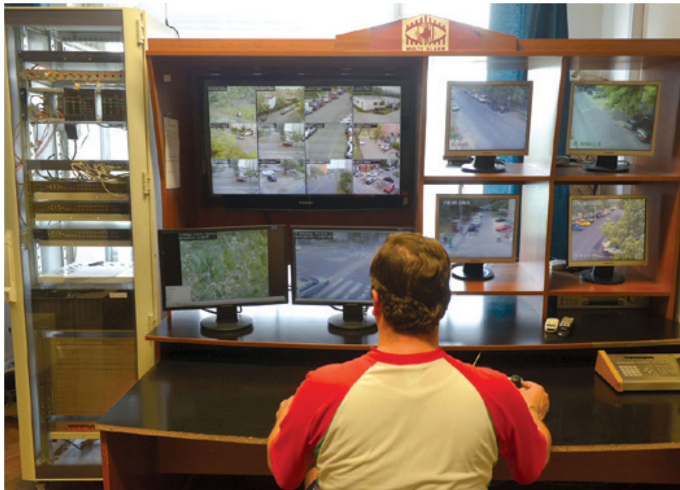
A kerületben 82 kamera erősíti a közbiztonságot, és az év végéig továbbiakat adnak át

Amikor szükséges fokozzák a járőrök jelenlétét