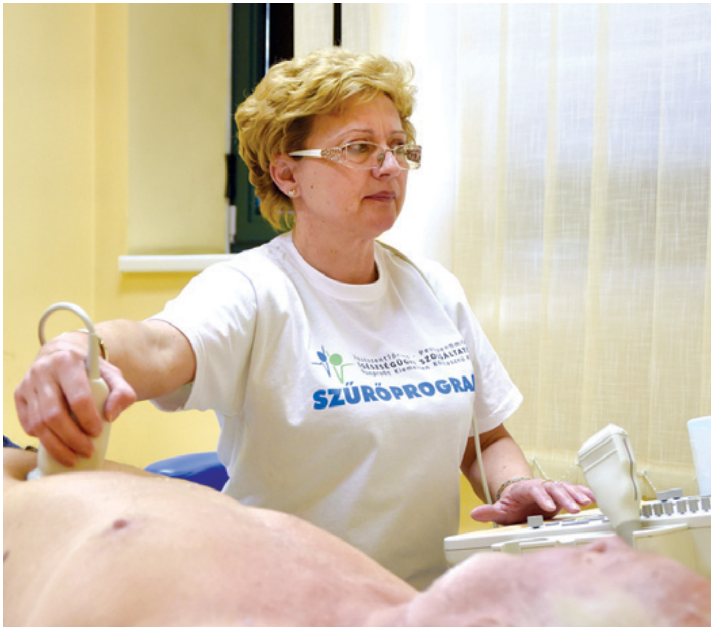
A májusi szűrőnapon a kezdést követően gyorsan beteltek a helyek

Egyre népszerűbbek az egészségügyi szűrésekre