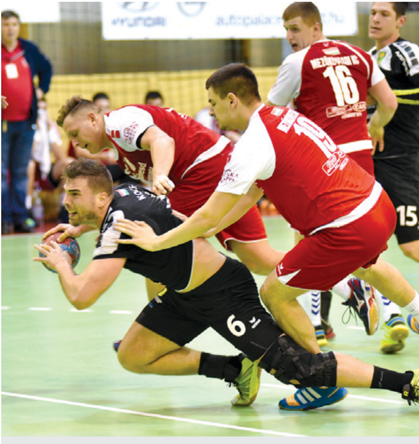
A PLER hatgólos hátrányból fordítva önérből harcolta ki a bent maradási Komlón