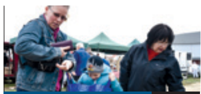
PIACOL A VÁROSGAZDA 2. oldal

Számos területen kapott idén új feladatokat az önkormányzattól a Városgazda XVIII. kerület Nonprofit Zrt. A cég munkájára többek között az oktatási intézményekben megvalósuló fejlesztésekben, az állomások, vasúti megállóhelyek, valamint a március végén újra megnyitott és folyamatosan bővülő pestszentimrei piac üzemeltetésében számít a kerület vezetése.