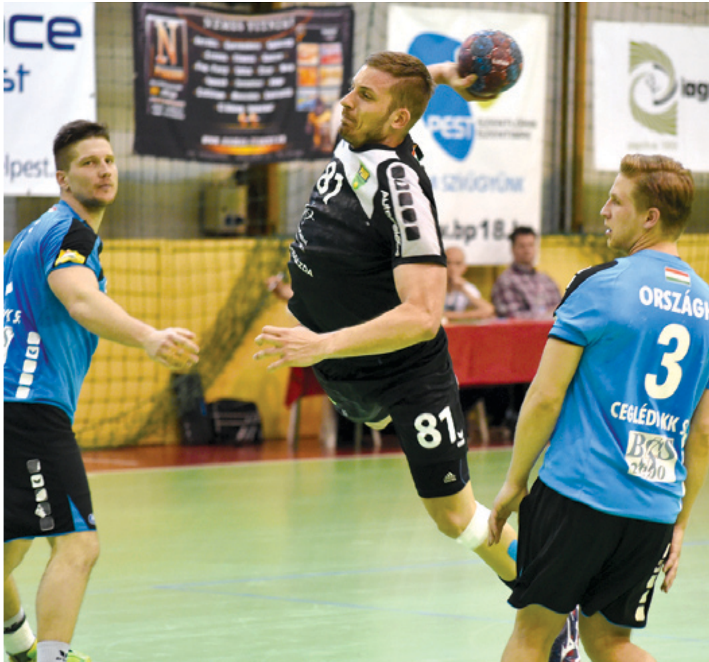
A Cegléd ellen hiányzott a rutin, most már bravúrok kellene

Rosszul kezdődött a PLER-Budapest kézilabdacsapat számára a rájátszás második fordulója: Mezőkövesden egy góllal (23-22) alulmaradt a csapatunk. A folytatásban, a Cegléd elleni április 10-i hazai meccsen is kis különbséggel (31-29) szenvedett vereséget, s nehéz helyzetben várja a folytatást.