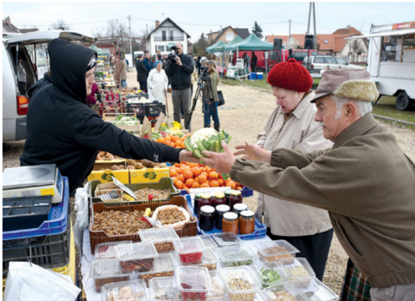
A megújult piac március 28-án nyílt meg a Pestszentimrei Sportkastély mögötti területen

Évről évre több feladatot lát el a Városgazda