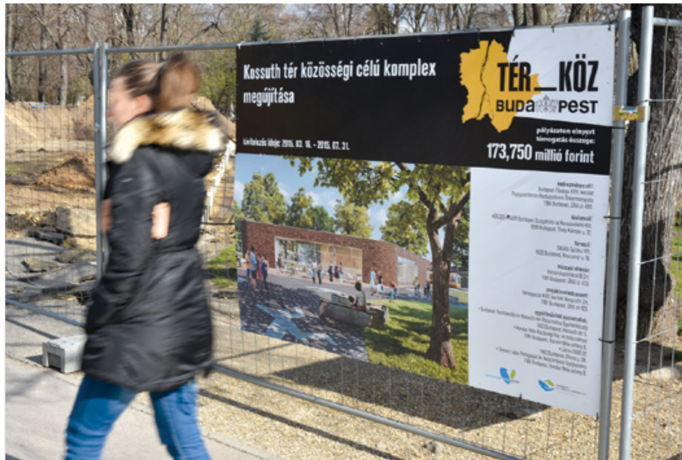
Már javában épül az új, központi pavilon, amely többféle funkcióval várja majd a látogatókat

párhuzamosan automata öntözőrendszer is kiépül. Korszerűsítik a tér világítását, s a járókelők, a pihenni vágyók kényelmét új padok, izgalmas, formabontó ülőfelületek, valamint hulladékgyűjtők és kerékpártárolók is szolgálják majd.