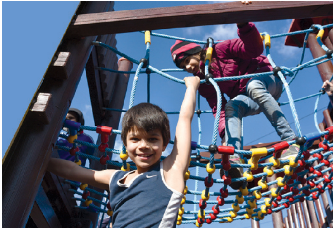
A legmodernebb játszótérek a gyerekek kreativitása is szerephez jut

területen belül ne legyen sérülést okozó éles tárgy. A játszótérek felújítása a biztonsági szempontok mellett sokszor az előírások változása miatt is szükséges. Van olyan játszóeszköz, amelynek a telepítésekor az akkori szabványoknak megfelelően kialakított esési teret az új paraméterek szerint kell felújítani, átalakítani.