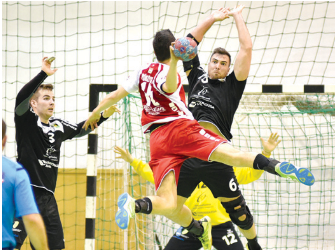
A Mezőkövesdet itthon átugrta a PLER, Cegléden azonban a hajrában elbukott