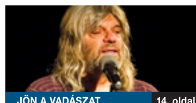
JÖN A VADÁSZAT

A Kondor Béla Közösségi Ház tizenötödik alkalommal rendezte meg a középiskolások képző-, ipar- és fotóművészeti kiállítását és díjkiosztó ünnepségét a kerületi Gyermekek és ifjúsági művészeti találkozó keretében. Idén országosra 36 iskolából 396 alkotó 839 munkája érkezett be a pályázatra. A képek és a fotográfiák a fiatalok kreativitását mutatják.