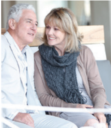
Ha túl sokat várunk, akkor lehet, hogy már késő lesz.

Szilveszterkor sokan elhatározzák, hogy egészségesebb és teljesebb életet fognak élni, mint azelőtt. Talán nem is gondolnánk, hogy hallásunk egészsége milyen óriási hatással van életünkre. Miért érdemes megfogadnunk, hogy sokkal inkább odafigyelünk hallásunk épségére? Érdemes elolvasni!