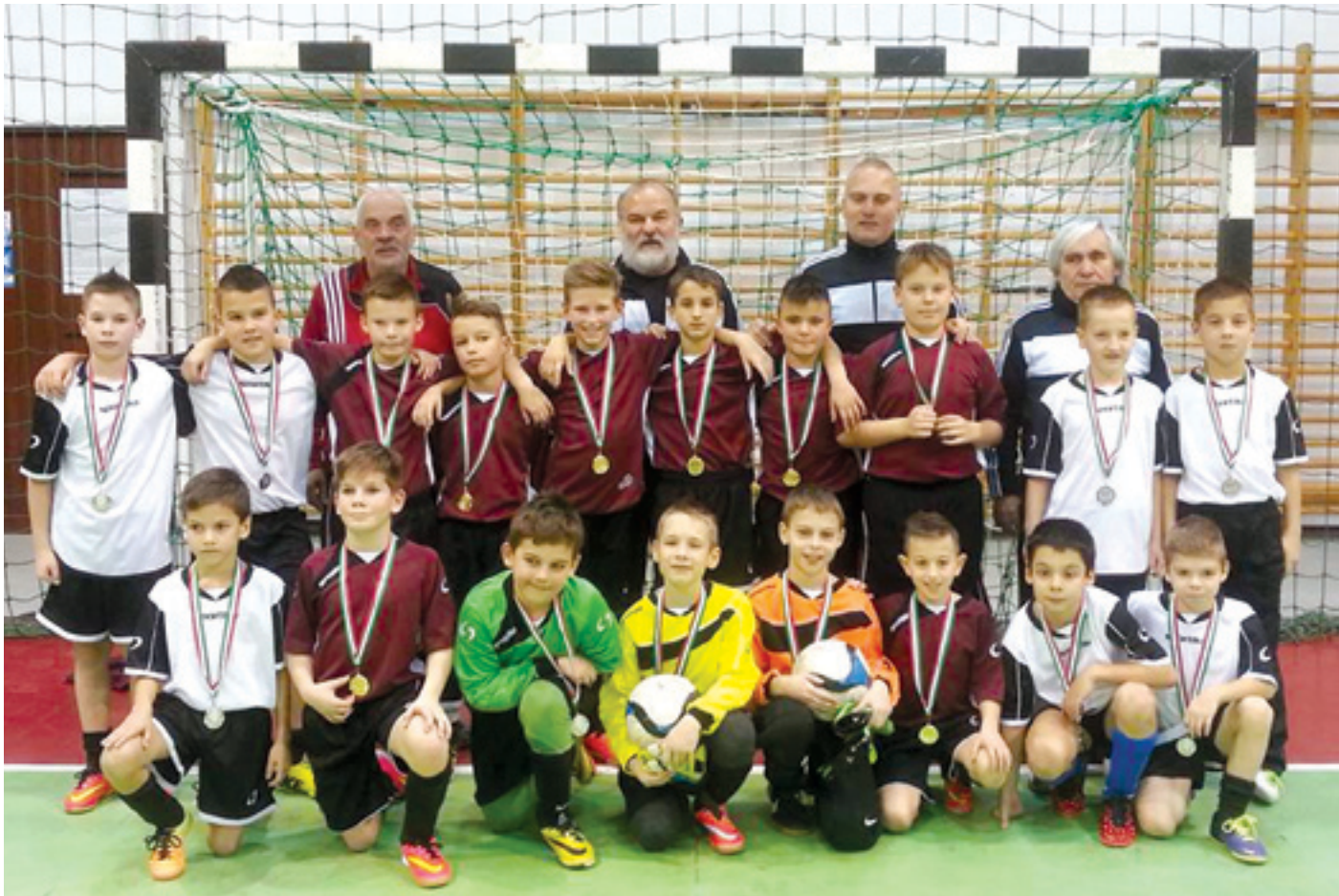
A glorietaesek a döntőben fölényes győzelemmel igazolták félelmetes híreiket