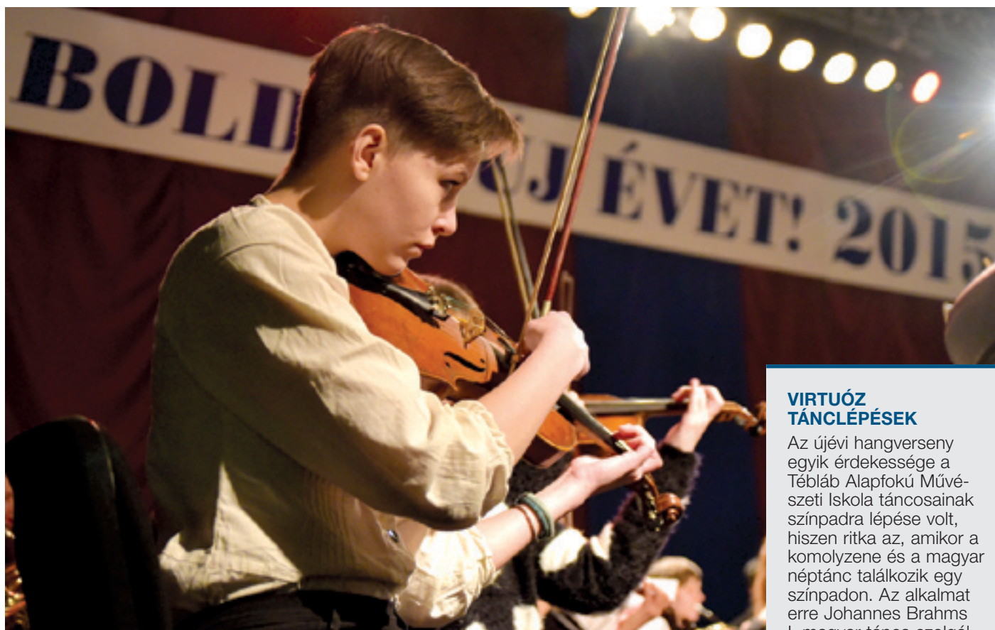
A zeneiskola immár 13. éve köszönti a zeneirodalom gyöngyszemeivel az új esztendőt

A zene nyelvén szóltak a kerület polgáraihoz