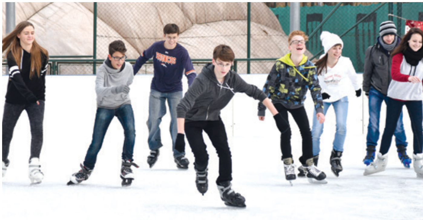
A jégpályát felváltva használhatják korcsolyázásra a kerületi intézmények és a kikapcsolódásra vágyók

Korcsolyával a lábunkon sokszor a valósnál nagyobb tudást