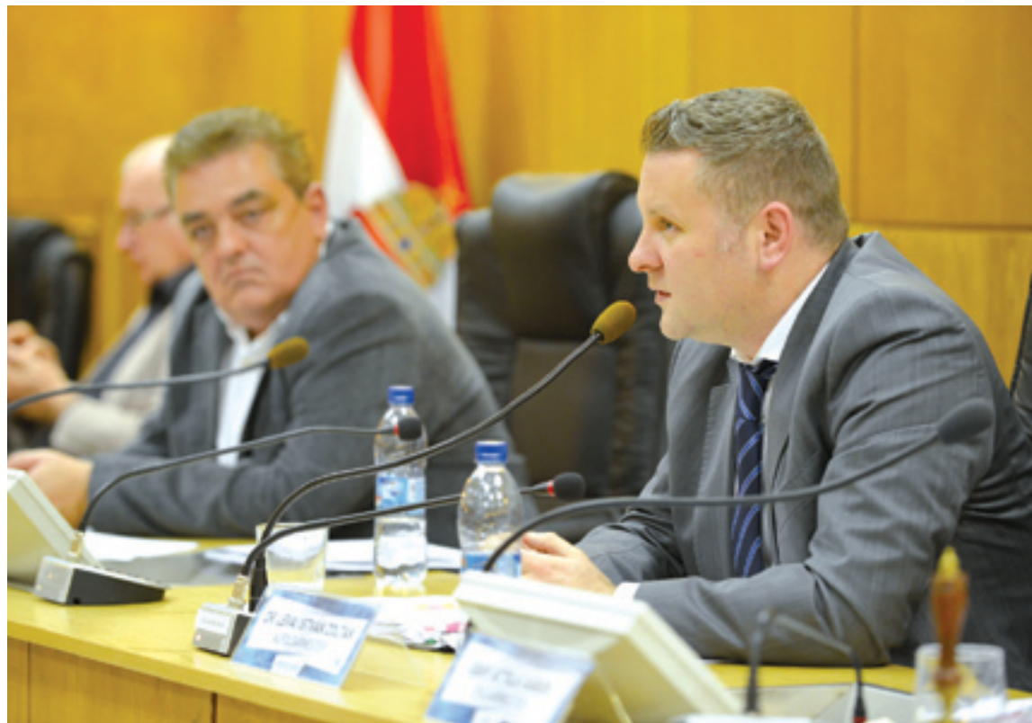
A rendőrség támogatása mellett sportegyesület és szociális feladatot ellátó alapítvány támogatásáról is döntött a testület

A december 4-i este programjában központi szerep jutott a civileknek, ugyanis egyidejűleg tárgyalták az egyes szervezetek támogatásáról szóló napirendi pontokat, illetve tartottak közmeghallgatást az üléshöz kapcsolódóan, amelynek tárgya ugyancsak a civilek és az önkormányzat kapcsolata volt. A testület döntött arról, hogy az önkormányzat 2015-re is ellátási