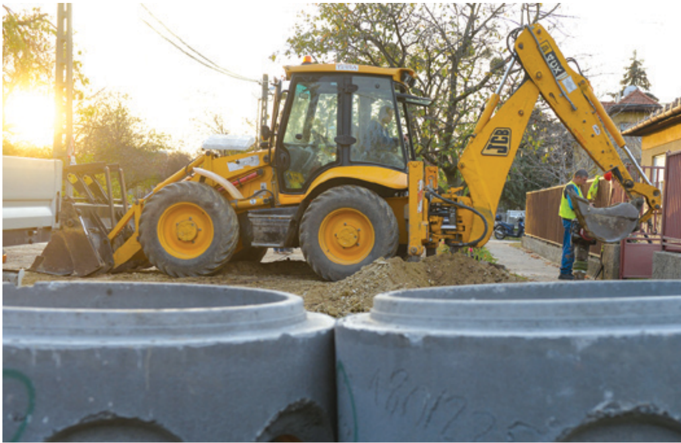
A szennyvízvezető hálózatra legkorábban akkor lehet csatlakozni, amikor a csatornaszakaszokat üzembe helyezték

Egyre többen élvezhetik a szennyvízcsatorna kényelmét