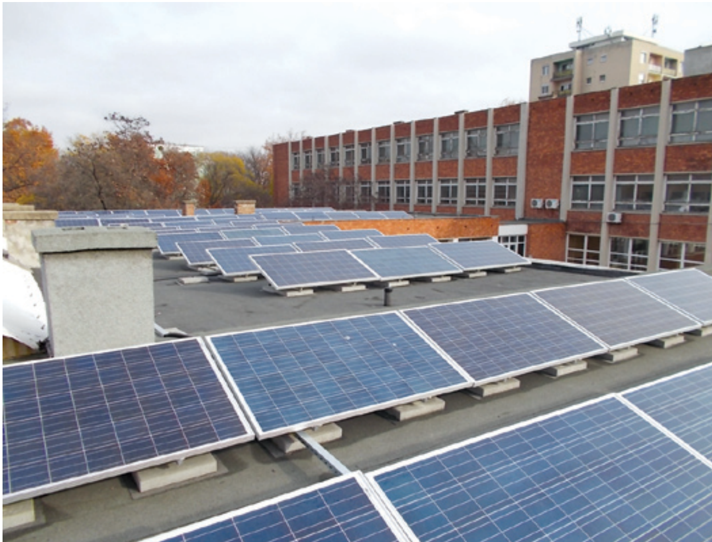
Az Eötvös-iskola tetején 208 polykristályos napelemmodul termeli a környezetbarát energiát

szinten jelentősen növekszik az iskolában a megújuló energia-hordozó bázisú villamosenergia-termelés, és 39,92 tonnával kevesebb üvegházhatású gázt bocsátanak ki.