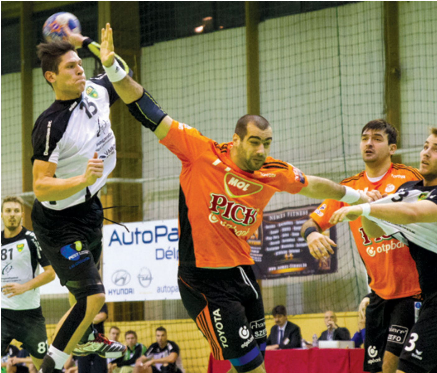
A sokkal erősebb Tatabányától csak nagy küzdelemben kapott ki a PLER