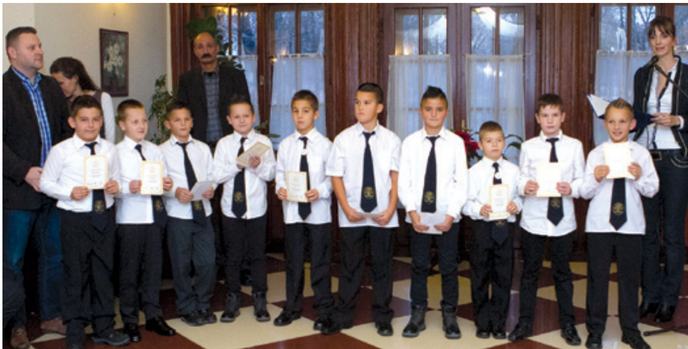
Oly sok a kerületi tehetség, hogy majdnem szűknek bizonyult az egyébként tágas Új Tündé kert Étterem

A közeledő év vége is emlékeztet maradhat a kerület sportos fiainak és lánykájainak. Az önkormányzat december 4-én köszöntötte a 2013-14-es diákolimpia országos versenyen dobogós helyezést elérő kerületi fiatalokat. Oly sokan voltak, hogy majdnem szűknek bizonyult az egyébként tágas Új Tündé kert Étterem. A versenyeken száznál több arany-, ezüst- vagy bronzérmes szerző sportolók, valamint a felkészítő edzőik és tanáraik voltak a főszereplők.