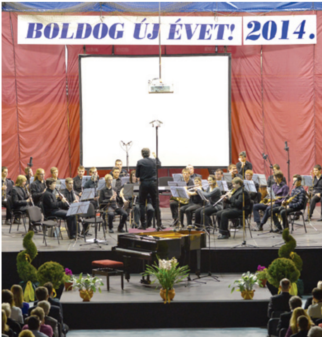
A január 4-i koncertet közkedvelt dallamokkal vendégművészek fellépése színesítik

Az újévi hangverseny immár több mint egy évtizedes múltra tekint vissza. Az első, 2002-es hangversenyt a Karinthy Frigyes Gimnáziumban rendezték,