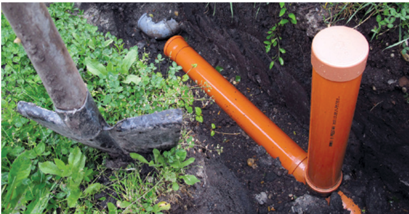
A szennyvízcsatornázás magasabb komfortszinttel és az ingatlanok felértékelődésével jár

Érdemes rácsatlakozni az új szennyvízcsatornára