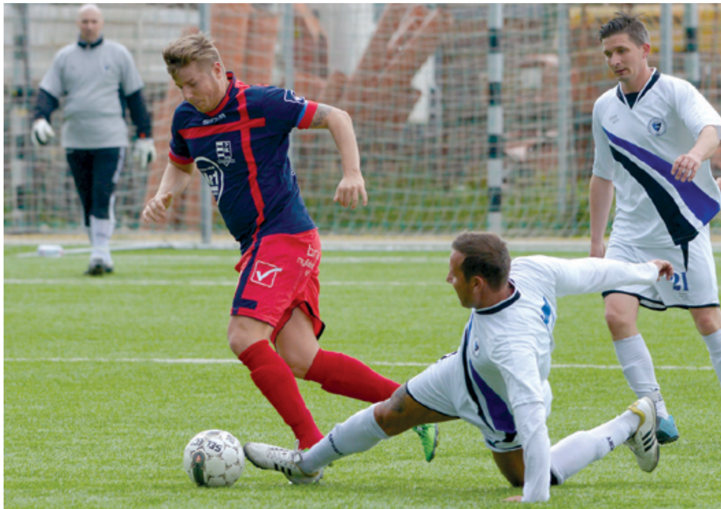
Mindkét kerületi csapat eredményesen kezdte a bajnokságot augusztusban

➤ Az elmúlt hét végén már a harmadik fordulót rendezték meg a BLSZ-bajnokság II. osztályában, amelyben két kerületi csapatunk is érdekelt. Az 1908 SZAC KSE és a PSK célja az, hogy kiegyensúlyozottabban szerepeljen, mint tavaly. Mindkét szakvezető véleményére kíváncsiak voltunk – vajon milyen reményekkel vágnak neki az őszenek?