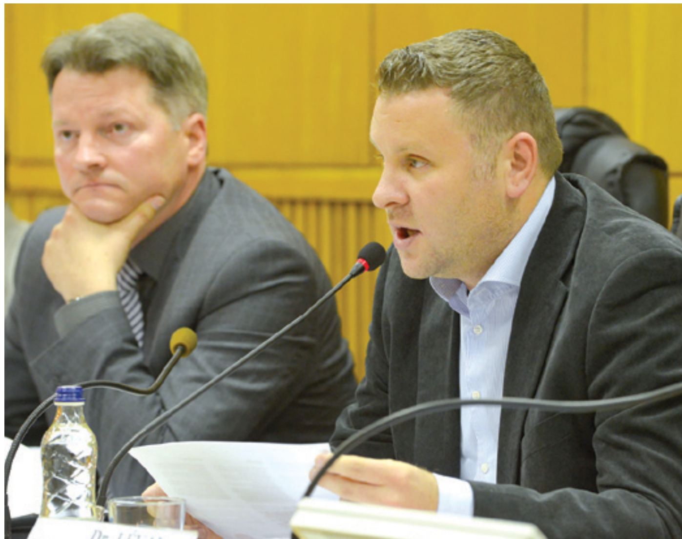
Az önkormányzat korábban is minden lehetőséget megragadott arra, hogy hozzájáruljon a kerületi társasházak felújításához

mogatással vagy visszatérítendő kamatmentes kölcsönrel tehetette meg. Előbbi – az augusztus 28-ig érvényben lévő önkormányzati rendelet értelmében – csak abban az esetben volt lehetséges, ha az adott társasház részt vett állami szerv által kiírt pályázaton, és maradéktalanul megfelelt az abban előírt feltételeknek. A társasházak azonban keresik a pályázaton kívüli lehetőségeket is, hiszen előfordulhat, hogy a felújítás annyira halasztóhatatlan, hogy nem tudják megvárni a kiírást, vagy a tulajdonosok elegendő anyagi fedezettel rendelkeznek ahhoz, hogy más finanszírozási formát válasszanak. Ilyen például a hitel. A társasházak képviselői az elmúlt