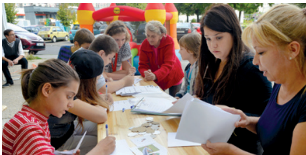
A gyerekek lelkesen töltik ki a Havanna-totót

Szendviccsel, üdítővel, tombolával, arcfestéssel vártak mindenkit a Kővár Lakossági Információs és Szolgáltató Iroda új ügyfélszolgálatának átadásán augusztus utolsó hetében a Havanna utca 50. számú ház földszintjén. A „Kővár szükség idején” programot 2013. november 1-jén indította útjára a Jövő Ifjúságáért Egyesület.