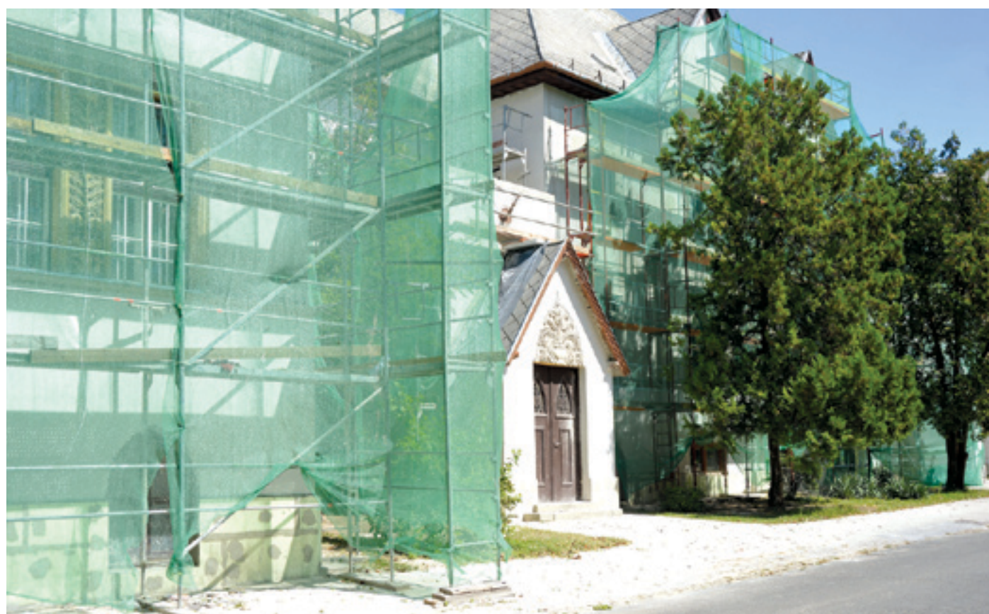
A Szehlo Gábor gimnázium homlokzata is megszépül idén

Megszépül az evangélikus és a katolikus iskola