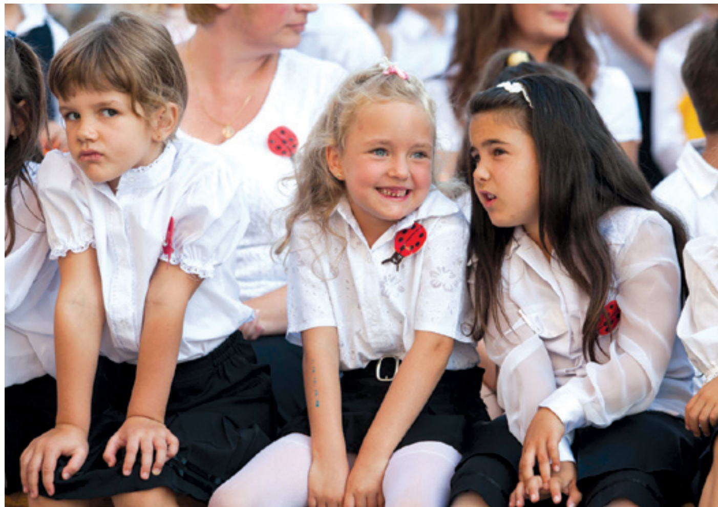
Az első osztályosok minden évben izgatottan és félszegen lépnek be az iskolába

– Az iskola így válik az oktatás mellett a nevelés intézményévé is. Kijelöli azokat a kereteket, amelyek között a későbbi, felelősségteljes életünk zajlani fog. Tudatosul a gyerekekben, hogy nincsenek egyedül. A kerületi iskolák minden évben számtalan olyan elismerésben részesülnek, amelyek bizonyítják, hogy a helyi pedagógusok érzékenyen, elkötelezetten segítik a diákok tudásának gyarapodását, a felnőtté válás nehéz, de szép folyamatát – mondta a polgármester, hozzátéve, hogy az önkormányzat továbbra is mindent megtesz a kerület okta-