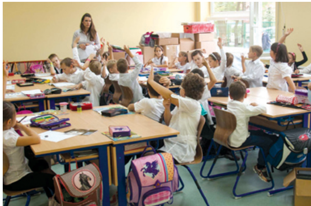
A környékre költöző családok érdekében halaszthatatlan volt az iskola bővítése

Két harmadik és egy második osztály vette birtokba szeptember 1-jén a Kandó Téri Általános Iskola új épületét. A régi élelmiszerbolt alapjaira épített iskolarészleg a három tanterem mellett egy tágas előtérből, fiú- és lánymosdóból, akadálymentesített mellékhelyiségből, valamint egy teakonyhából áll. A 75 millió forintért megvásárolt épületre, illetve környezetének a rendbetételére csaknem 80 millió forintot fordított az önkormányzat.