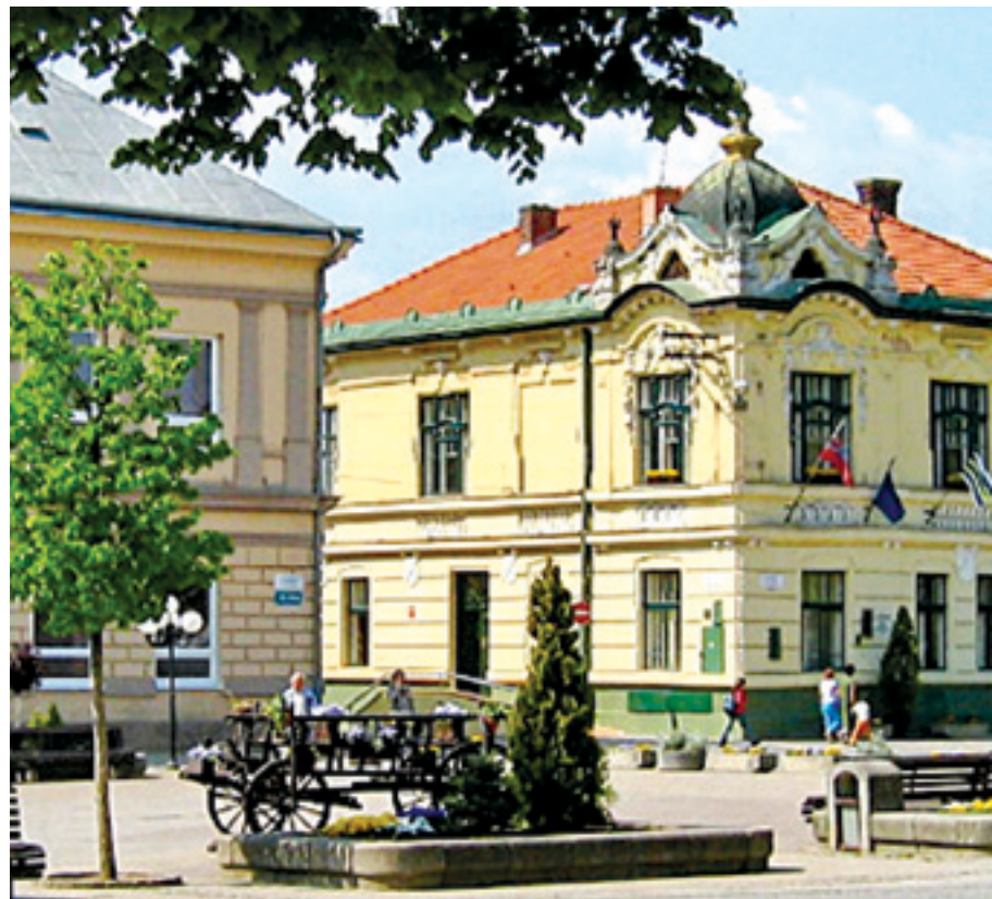
Szepszi főtere a város büszkesége

Itt született az első magyar nyelvű útleírás szerzője és Bocskai írnoka: a kerület új testvérvárosa a 800 éves felvidéki város, Szepszi.