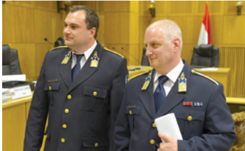
■ Új, az eddigieknél is hatékonyabb járőrszolgálat jön létre azáltal, hogy a képviselő-testület megszavazta a kerületi rendőrkapitányság számára a következő egy évre a támogatást

A testület 19 igen szavazattal és 1 tartózkodással úgy döntött, hogy a Sport és Ifjúsági Szálló Nonprofit Kft. felügyelőbizottsági tagjainak megbízatása határozatlan idő-