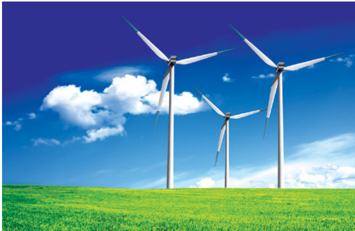
A szélergia az egyik leggyorsabban fejlődő megújuló energiaforrás

A napkollektor egy család melegvíz-fogyasztásának akár 60 százalékát is fedezi