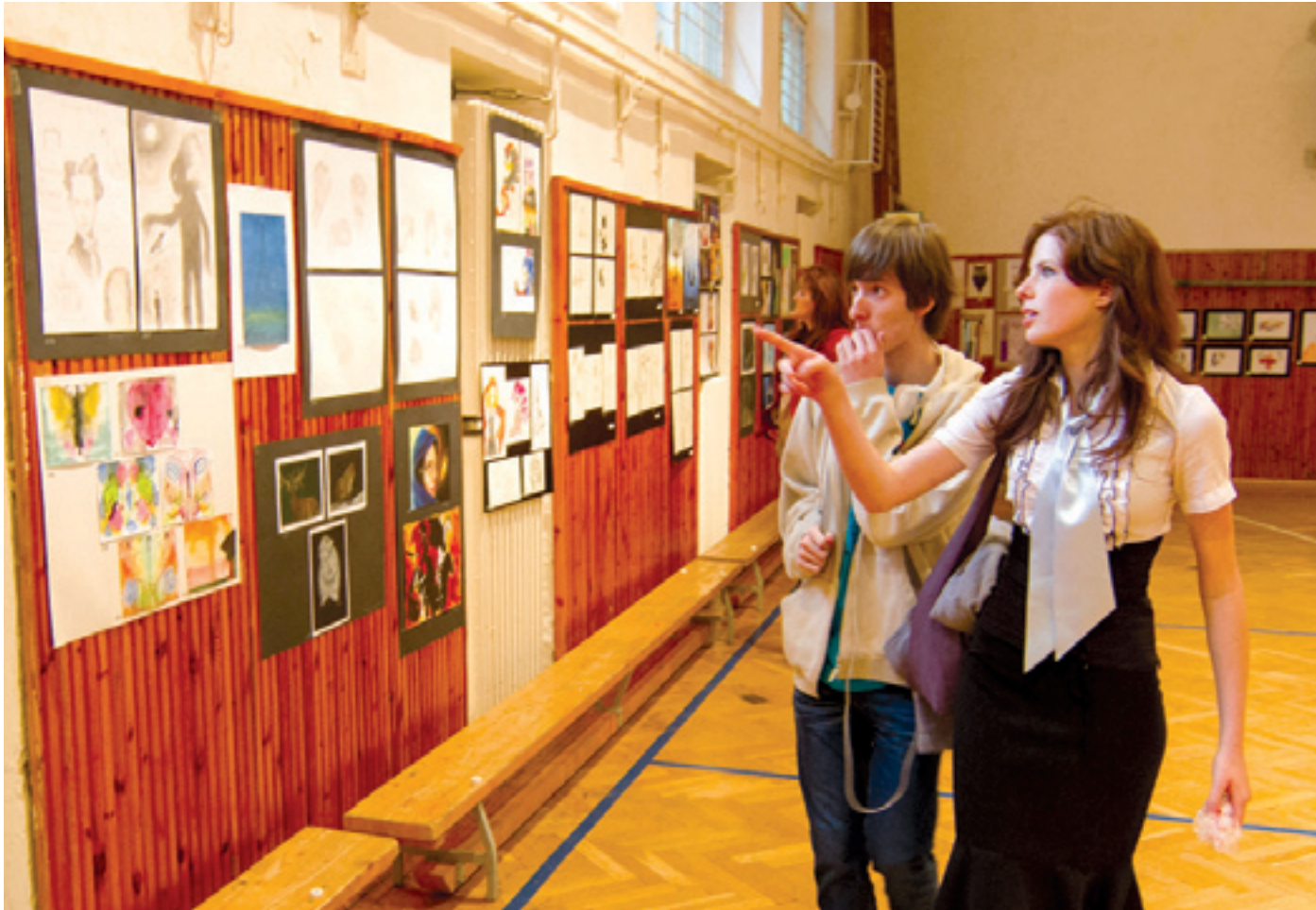
A tornateremben kiállított 150-nél több rajz, grafika, akvarell arról mesélt, hogy hasznosan teltek az elmúlt hónapok

Szinte kínálta magát, hogy a sztehlósok támogassák az afrikai diákok feltételeinek a javítását. Ötforintosokat gyűjtenek, ami csak addig tűnik semmisségnek