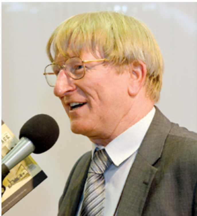
Egész életében azt vallotta, hogy nem érdekcsoportokat kell támogatni, hanem ügyeket

jutott először az 1954-ben született fiatalember: egy egyetemi program keretében a nyíregyházi tanárképző főiskola meghívására utazhatott át, addig az, ami nekünk, itthoniaknak a mindennapi létezés tere – a főváros nevezetes utcái, műemlékei, a Balaton és sok más –, számára, számukra csak a televíziós adásokból ismert képek voltak.