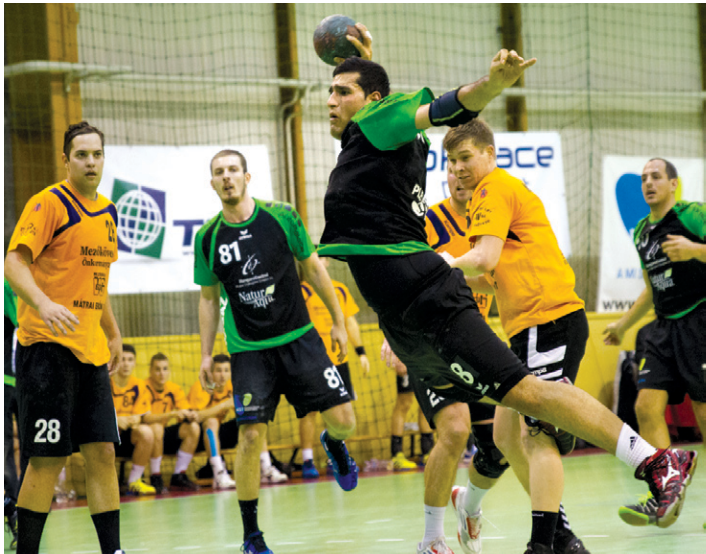
A Mezőkövesd ellen veszített helyzetből is fordítani tudott a megacélosodott csapat

Három kemény és fontos mérkőzésen van túl a PLER-Budapest, és nem is rossz mérleggel. A Mezőkövesd, a Győr és az Orosháza ellenében megszerezhető hat pontból ötöt szerzett meg a csapat. Most már nem a mezőny „fenekét” nézi, s megnőtt az esélye a bennmaradásra.