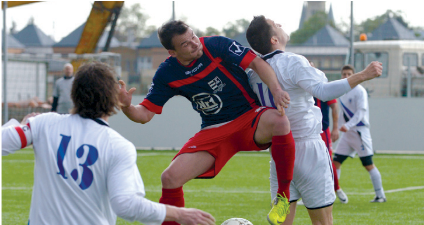
A szeles idő többször is megtréfálta a játékosokat

➤ A BLSZ-bajnokság tavaszi szezonjának sorsolásakor kiderült, hogy a kerületi derbit, a SZAC-PSK összecsapást nagyszombaton tartják, így az is kérdésként vetődött fel, hogy „kit szeret” majd a nyuszi. A meccs után kiderült, hogy teljes mértékben egyik csapatot sem, mert a mérkőzés gól nélküli döntetlent hozott, így egyik fél sem lehetett maradéktalanul elégedett.