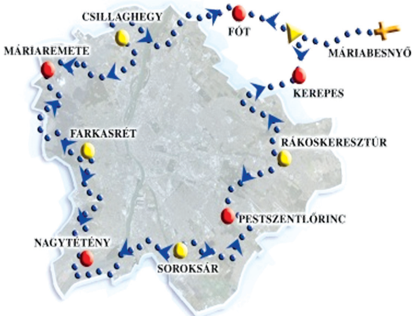
A Budapestet körbeölelő zarándoklat során Rákoskeresztúrról és Soroksárról is a kerületünkbe jönnek a hívek

Két szakasza is lesz a kerületben az Élő rózsafűzér zarándoklatnak