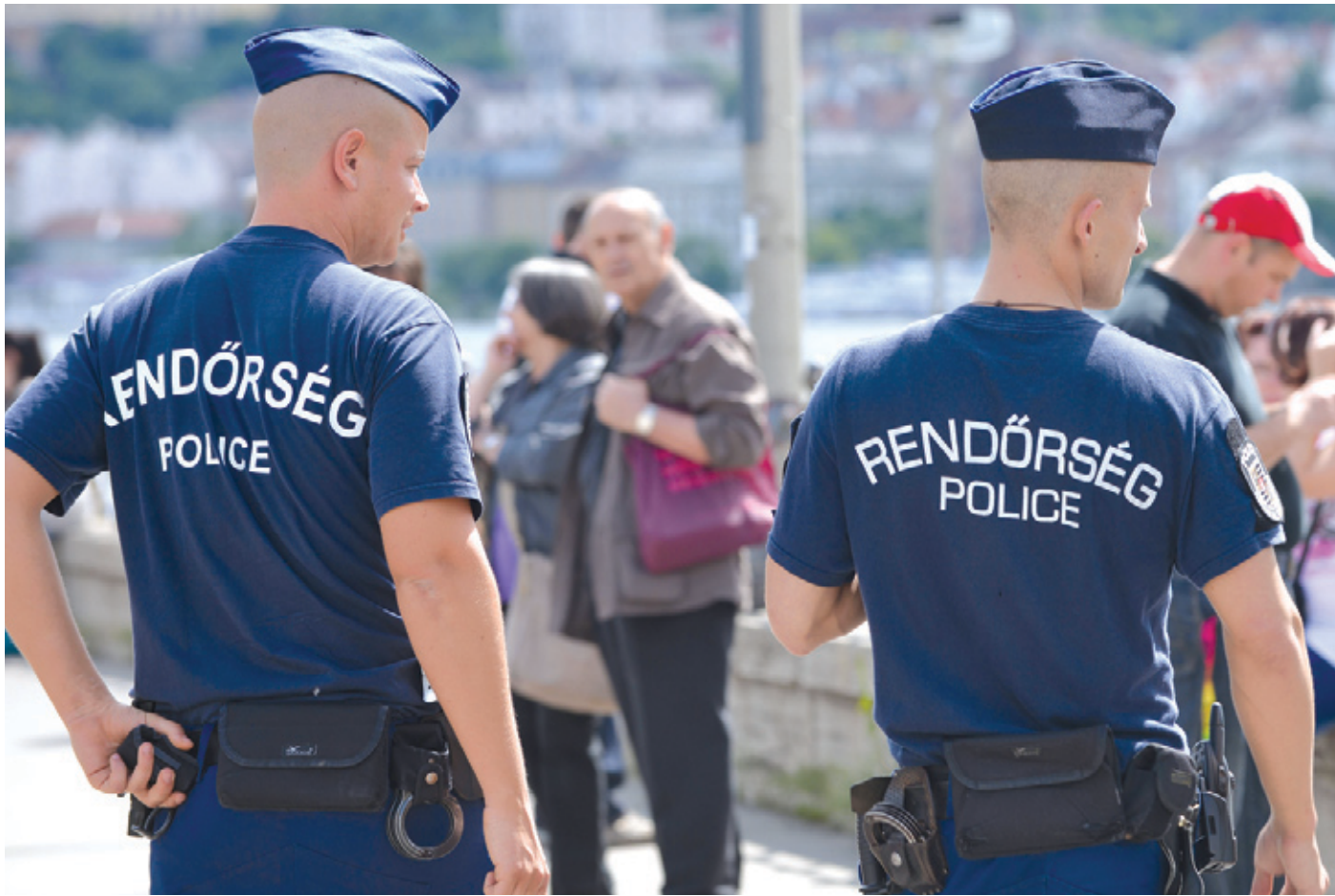
Az önkormányzat a rendőrséggel közösen készíti el a benyújtandó pályázatot

Már a nyár végén működhet a térfigyelő rendszer az Alacskán