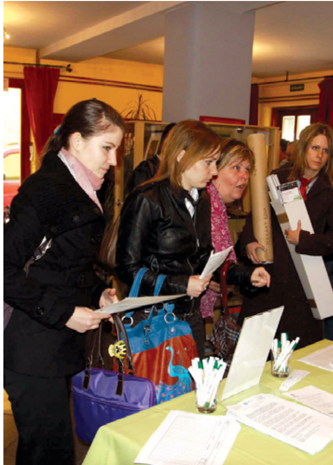
Az önéletrajz fontos lehet a börzén

Az álláskeresőket 20-25 munkáltató várja majd aktuális munkalehetőségekkel