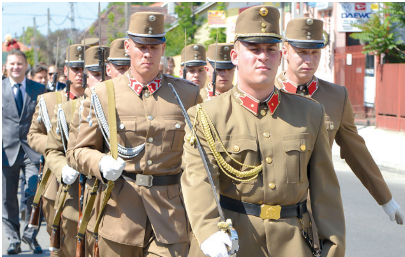
A honvédség díszegyenruhás felvonulása minden évben látványos program

A száz éve kitört első világháborúra is emlékeznek