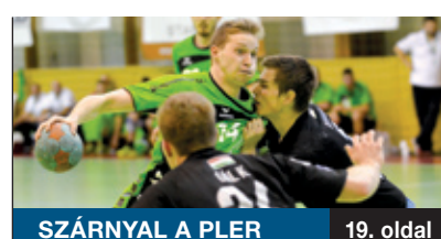
SZÁRNYAL A PLER 19. oldal

Nehéz elképzelni, milyen volt az az években tartó állóháború, amelynek katonák néztek szembe egymással. Az idei Vasvári-napok, amelyek tematikus programját a szervezők a száz éve kitört első világháború emlékének szentelték, ebbe is bepillantást nyújt június 6–8. között a Pestszentimrei Sportkastély melletti téren.