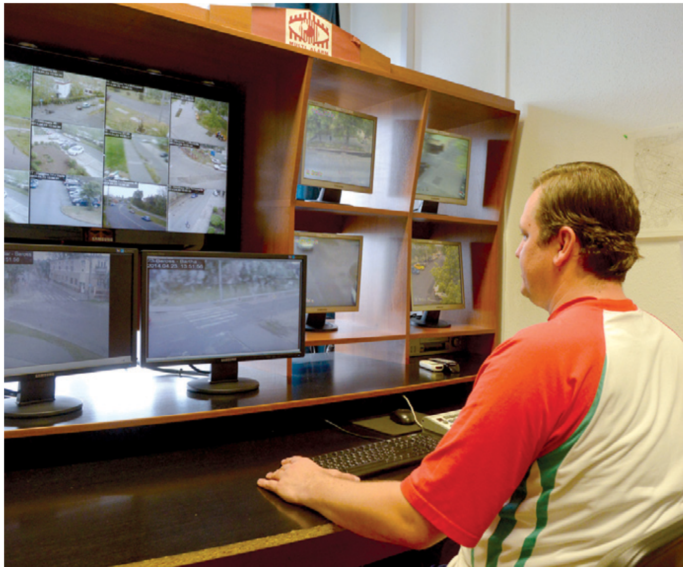
Egyre többen tudatosan élnek a térfigyelő kamerák nyújtotta előnyökkel

Az Alacska mellett több csomópont is bekerül a biztonsági rendszerbe