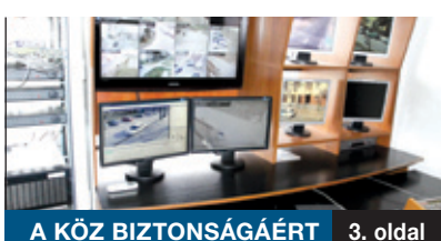
A KÖZ BIZTONSÁGÁÉRT 3. oldal

A közbiztonság ügye volt a legfontosabb téma a képviselő-testület április 25-i rendkívüli ülésén. A képviselők döntése értelmében az önkormányzat részt vesz azon a pályázaton, amely pénzügyi forrást nyújt a térfelügyelő rendszer kiépítéséhez az Alacskai úti lakótelepen és több fontos közterületen. A remények szerint már a nyár végén működhetnek a kamerák.