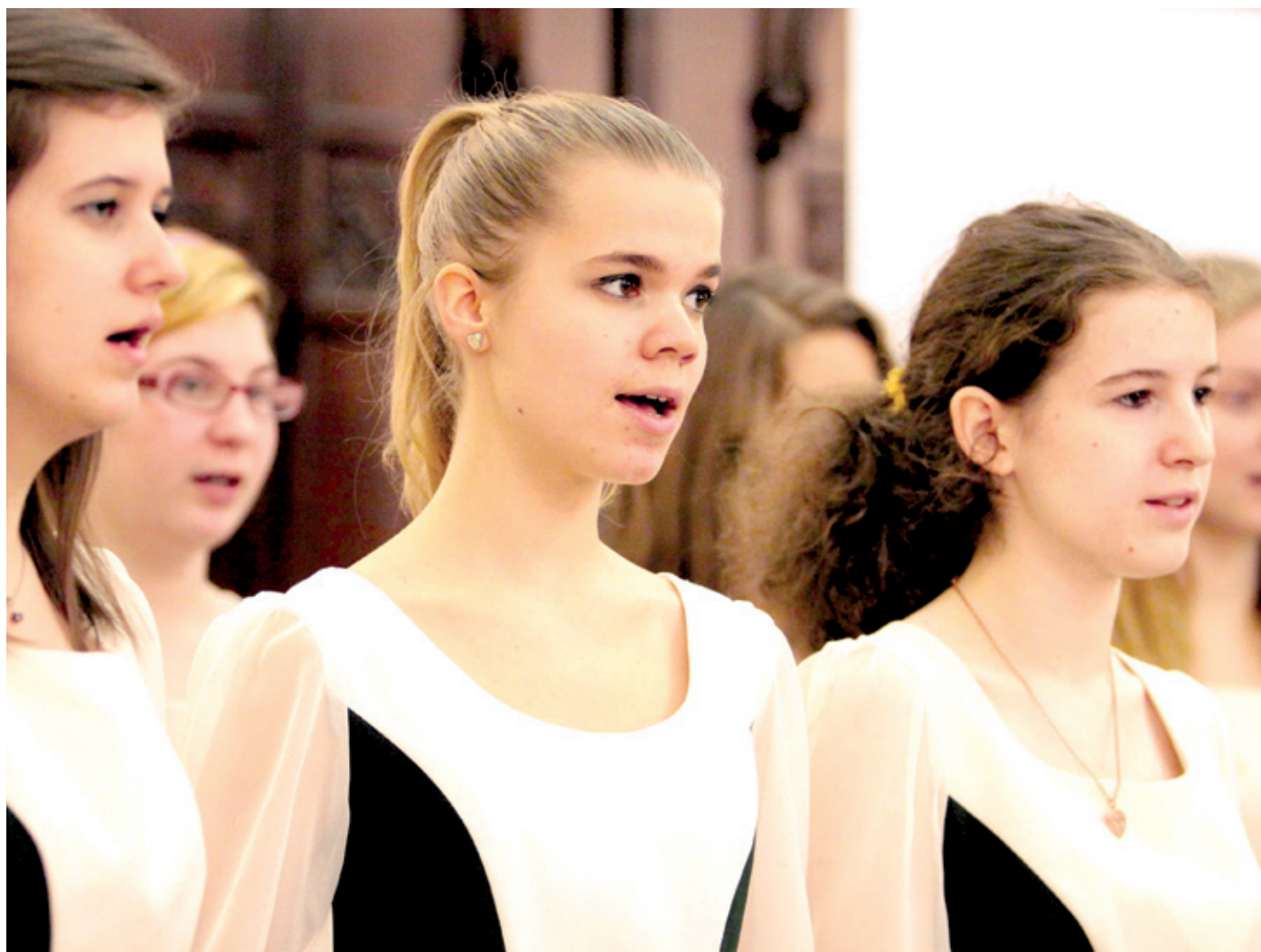
A Sztehlo mellett a Karinty Frigyes, a Vörösmarty Mihály és a Pogány Frigyes iskola diákjai szavalnak majd

„A Sztehlón túl a Karinty Frigyes, a Vörösmarty Mihály és a Pogány Frigyes iskola diákjai szavalnak majd, s reméljük, minél többen. Am nem arról szól ez a közös szaválás, hogy résztvevői rekordot döntünk, sokkal inkább arról, hogy a diákok minél többen jöjjenek el saját maguktól is erre a bizonyára számukra és a hallgatóság számára egyaránt élményt nyújtó irodalmi eseményre. Aki látott, hallott már ilyet, az egyetérthet azzal, hogy felemelő érzés...”