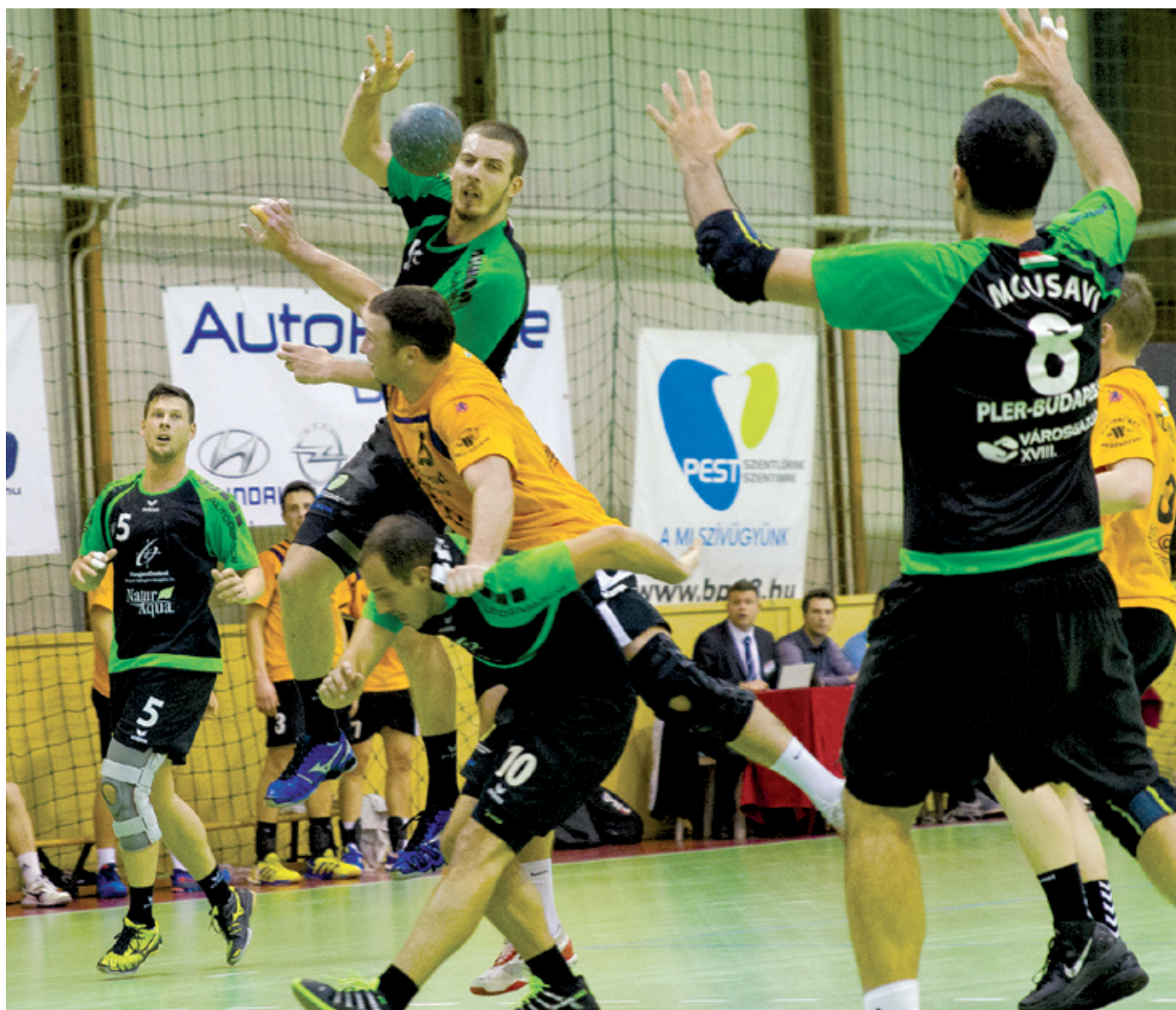
A Mezőkövesd elleni birkózásból a vendégcsapat jött ki jobban

Kellemetlen vereséget szenvedett a PLER-Budapest február 22-én a Mezőkövesd ellen, megnehezítve ezzel saját magának a rájátszást, hiszen ez a két pont nagyon kellett volna ahhoz, hogy elérje a célját, az első osztályban való benntartását. A kétfőlős, 30-28-as vereség hidegzuhanyként érte az együttest.