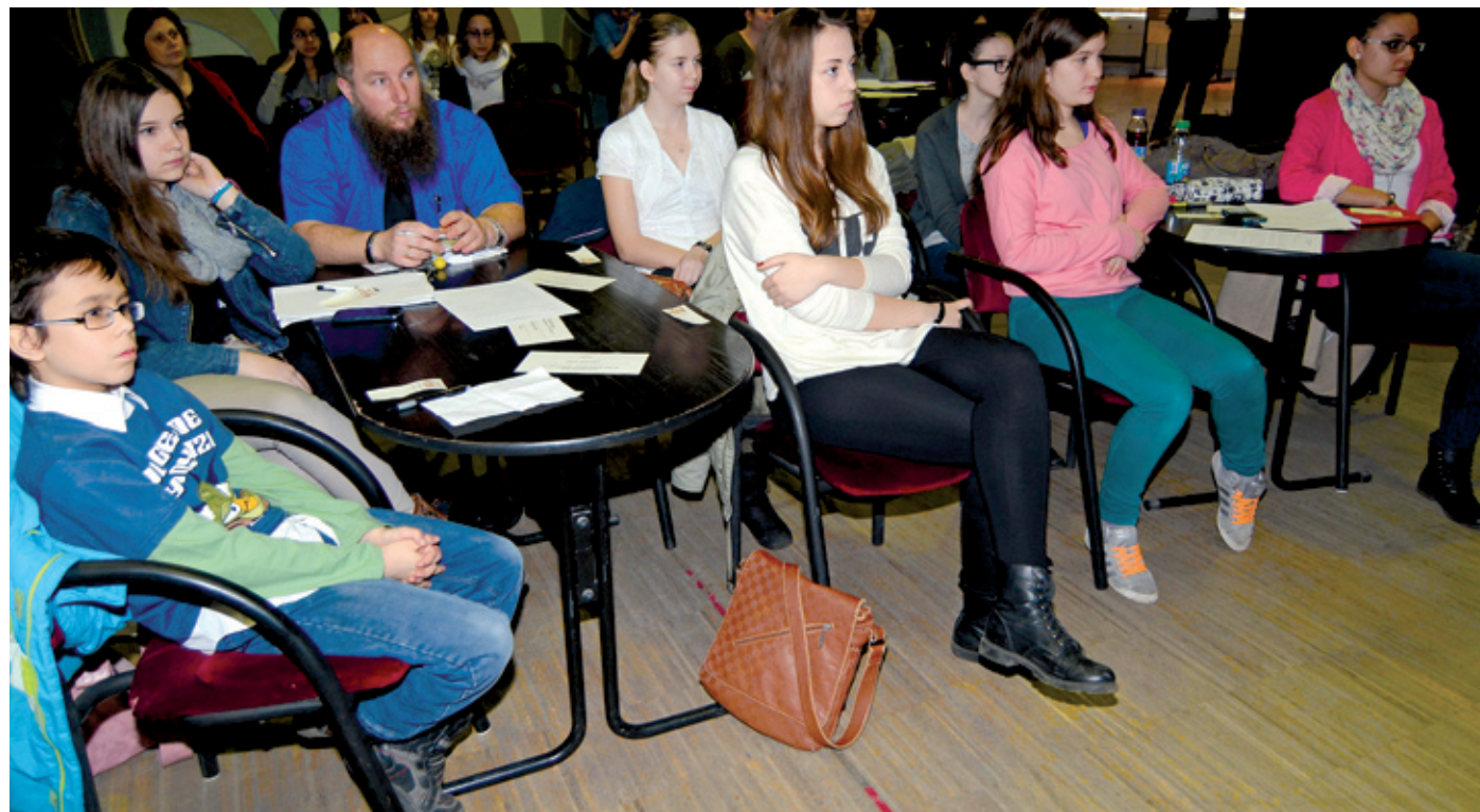
Ebben az esztendőben 14 iskola képviseltette magát a diákszemléleten

Idén is összeült a kerületi diákszemlélet