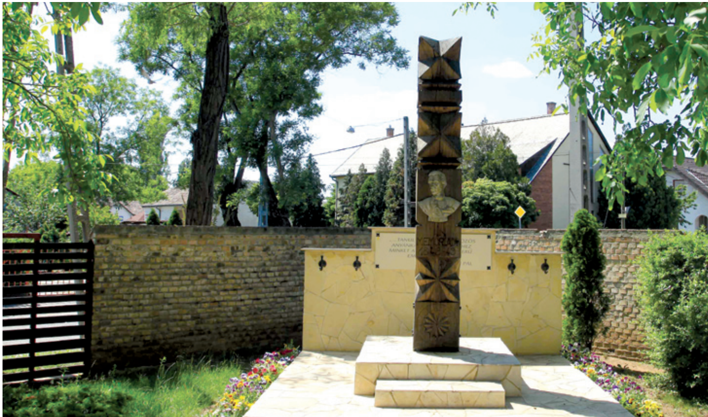
A Vasvári-kopjafa a kerület legfiatalabb 1848-as emléke

A XIX. század közepének társasági életét jellemzi egy érdekes intermezzo, amelyet néhány forrás említ: az ifjú Petőfi még a Szendrey Júliával való