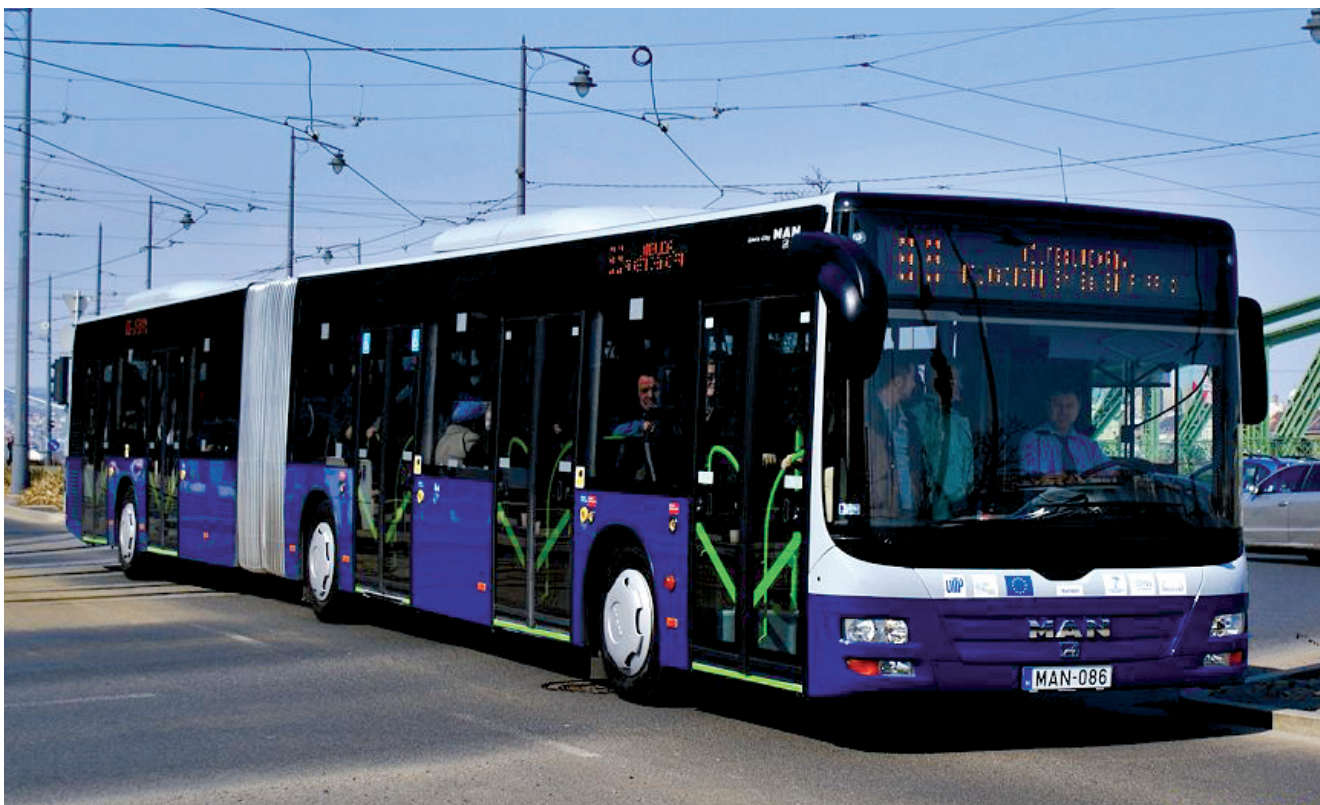
A járművek az uniós károsanyag-kibocsátási normáknak megfelelő motorral

A Nemzeti Fejlesztési Minisztérium és a Fővárosi Önkormányzat 2013 szeptemberében egyezett meg arról, hogy a Budapest határát elhagyó, de a főváros buszhálózatába szervesen illeszkedő járatok működtetését a jövőben is a Fővárosi Önkormányzat rendeli meg közlekedésszervezőjén, a Budapesti Közlekedési Központon (BKK) keresztül. A járatok útvonalát, menetrendjét, az érvényes viteldíjakat tehát továbbra is az érintett települési önkormányzatok és a BKK határozza meg, de a járatokat