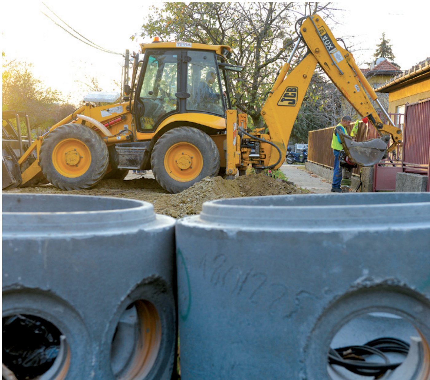
A kedvező téli időjárásnak köszönhetően megfelelően tudtak haladni az építéssel

A kivitelező cégek munkatársai a lakosság türelmét kérik