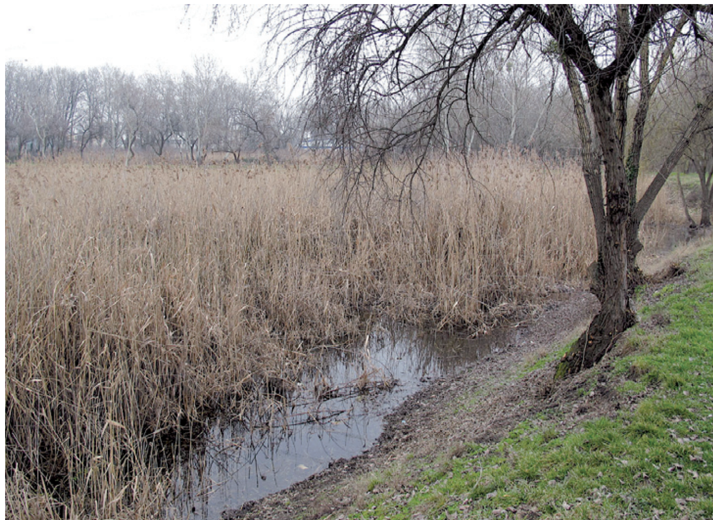
Az Erőmű-tó megmentése már 2011-ben elkezdődött

Az idei év egyik legnagyobb környezetvédelmi beruházása