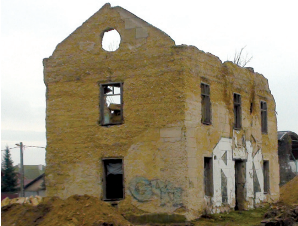
Az év elején elbontották a Krepuska-kastély maradványait