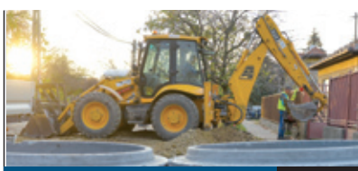
HALAD A CSATORNÁZÁS

Nem lehet gondja a választással annak a szülőnek, aki kerületi szervezésű nyári táborba szeretné beírni gyermekét: Pestszentlőrincen és Pestszentimrén iskolák és művelődési házak kínálnak napközis jellegű, illetve bentlakásos táborokat, a Bókay-kertben pedig egész szünetidőben rendszeres étkezés-sel, egész napos programmal várja a vakációzókat a napközis tábor.