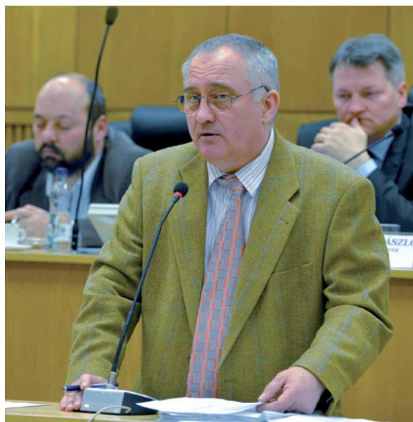
A testület elvi hozzájárulását adta ahhoz, hogy az önkormányzat beadja pályázatát a Pándy Árpád Gyűjtemény Alapítvány által szervezendő első világháborús megemlékezési ünnepség támogatására

A testület 17 igen szavazattal egyhangúlag felkérte és felhatalmazta