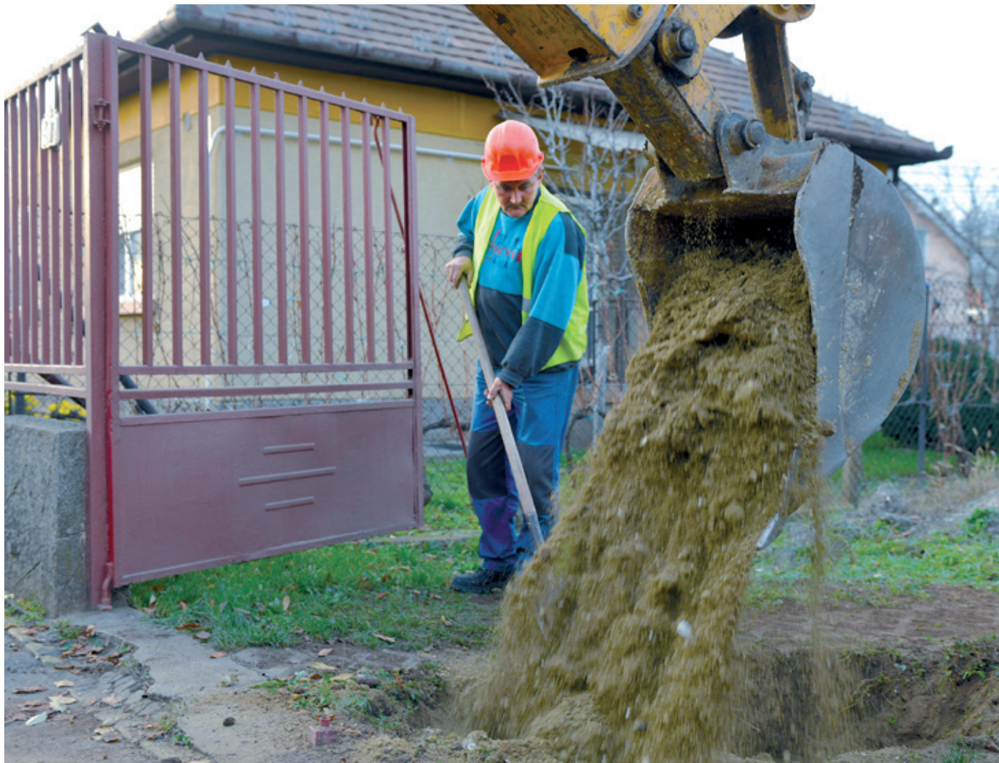
Érdemes a Városgazda szolgáltatását választani, hiszen a városüzemeltető cég jótállást és szavatosságot is vállal

A szolgáltatás iránt érdeklődők a házi hálózat kiépítésére a Fővárosi Csatornázási Művek által engedélyezett tervek birtol-