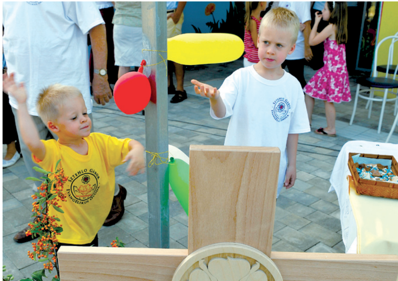
Nem egészen kilenc hónap alatt teljesen megújult és megszépült az óvoda

Sárga galambok, zöld halacsokák, kék hajók a Fecskefészek óvodában