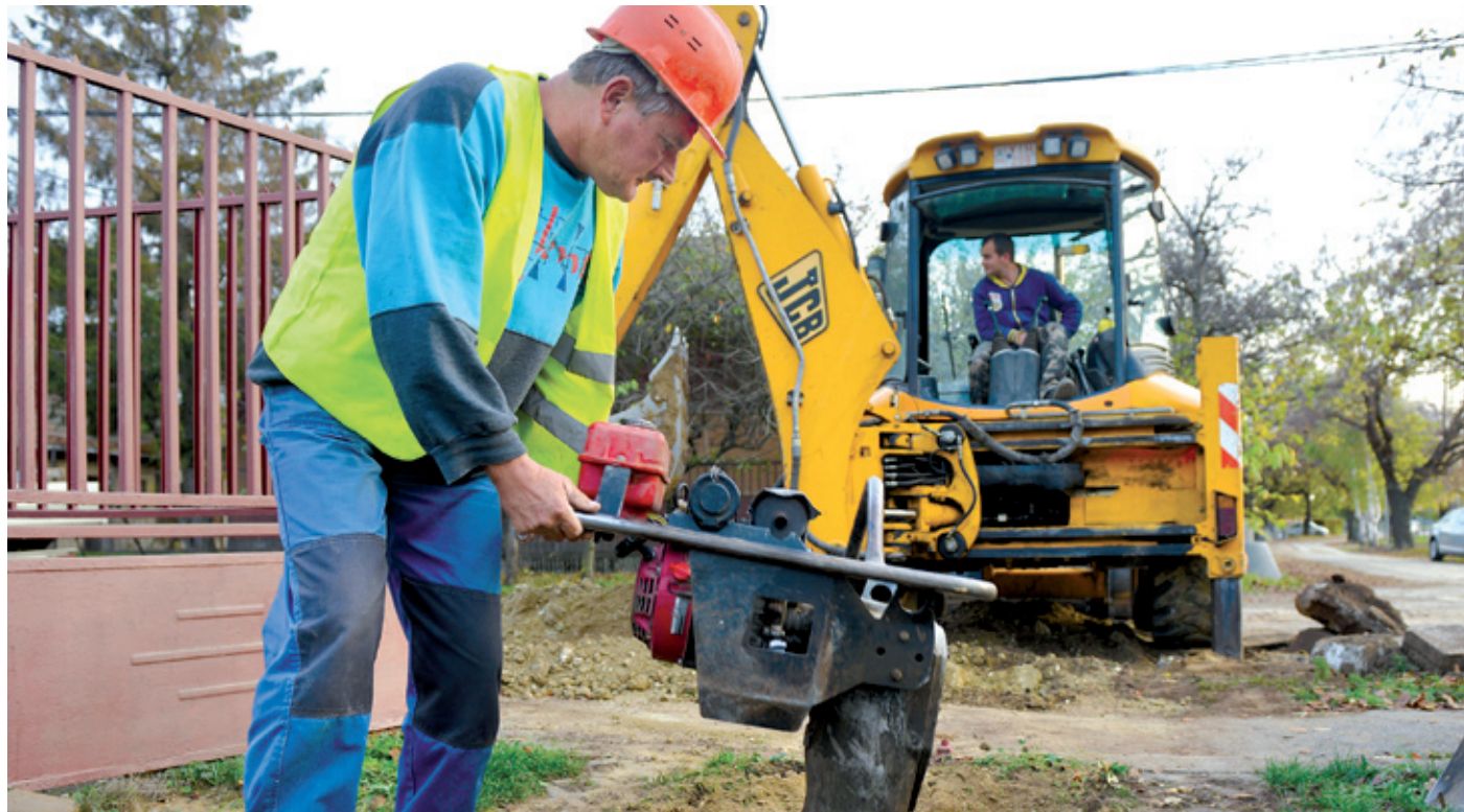
A városüzemeltető cég mind a tervezéshez, mind a kivitelezéshez megfelelő szakmai háttérrel rendelkezik

Jó ütemben zajlanak a csatornázási munkálatok a XVIII. kerületben. Vannak olyan utcák, amelyekben a szeptember 20-i indulás óta már be is fejeződött a munka. A kerületben összesen 90 kilométernyi hálózat épül ki 2015 júniusának végéig, és ez 7200 háztartás életét teszi végre komfortossá, igazodva a XX. századi igényekhez. A mintegy 34 milliárd forintba kerülő teljes fejlesztéshez 23,5 milliárddal járul hozzá az Európai Unió.