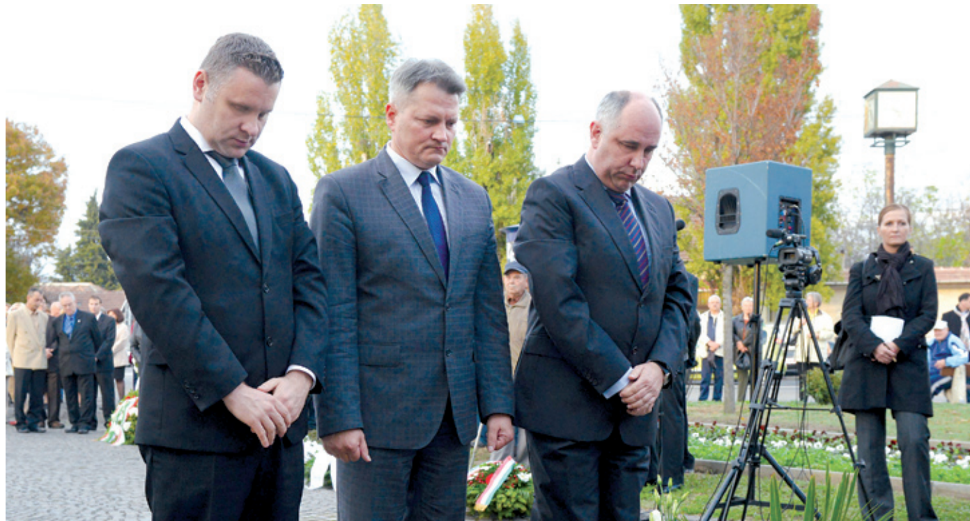
A Béke téri kopjafánál az önkormányzat vezetői együtt tisztelegtek a szabadságharcosok emléke előtt

A szabadság mámorító erője hatalmas szellemi energi-