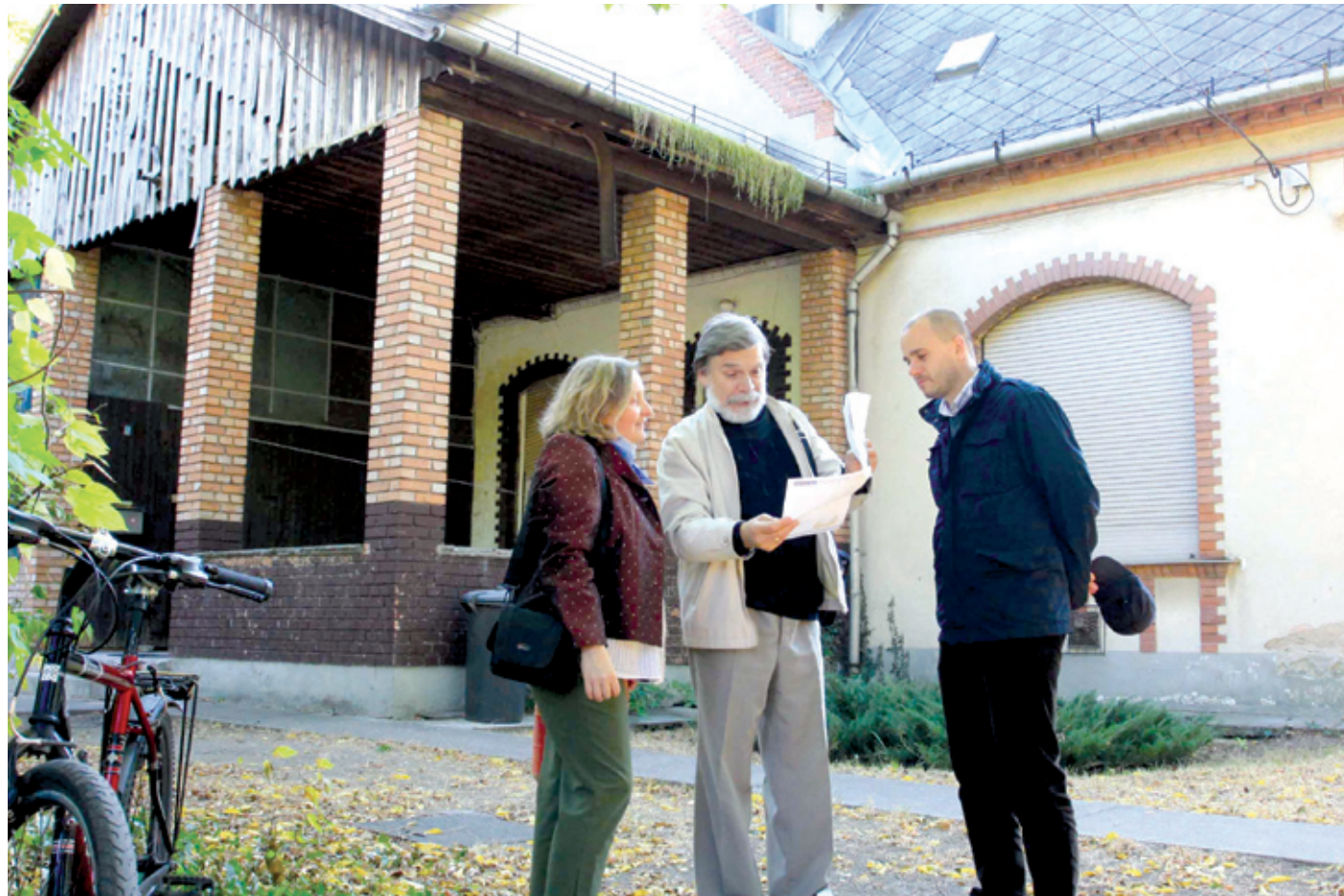
A Herrich-Kiss-villa méltó központi épülete lehetne a megújuló Bókay-kertnek

Megférnének egymás mellett a tradíciók és az újítások