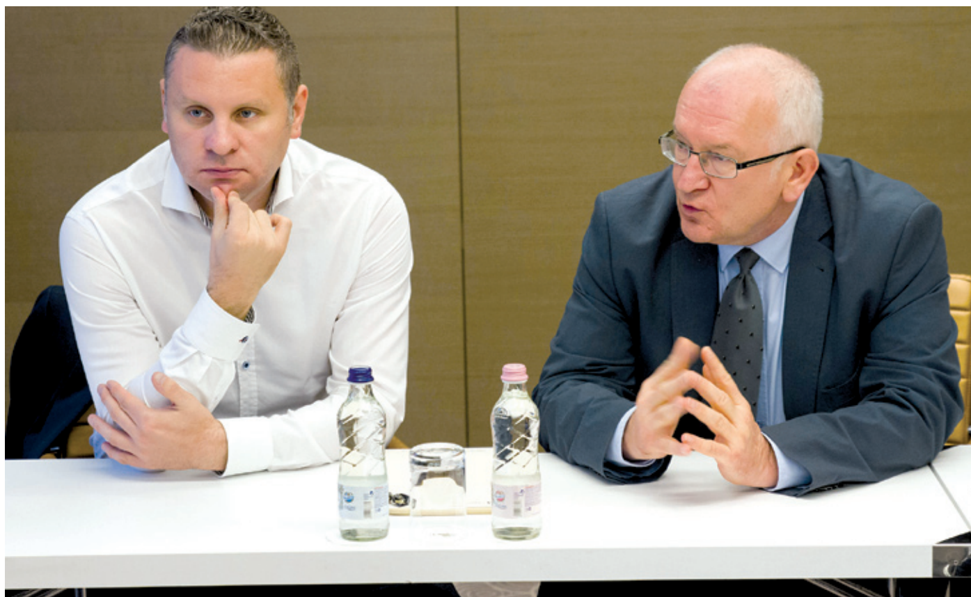
A RE-SEETIES a következő költségvetési ciklus kiemelt fejlesztéseire teremthet alapot

Bemutatták a projekthez készített alaptanulmányt