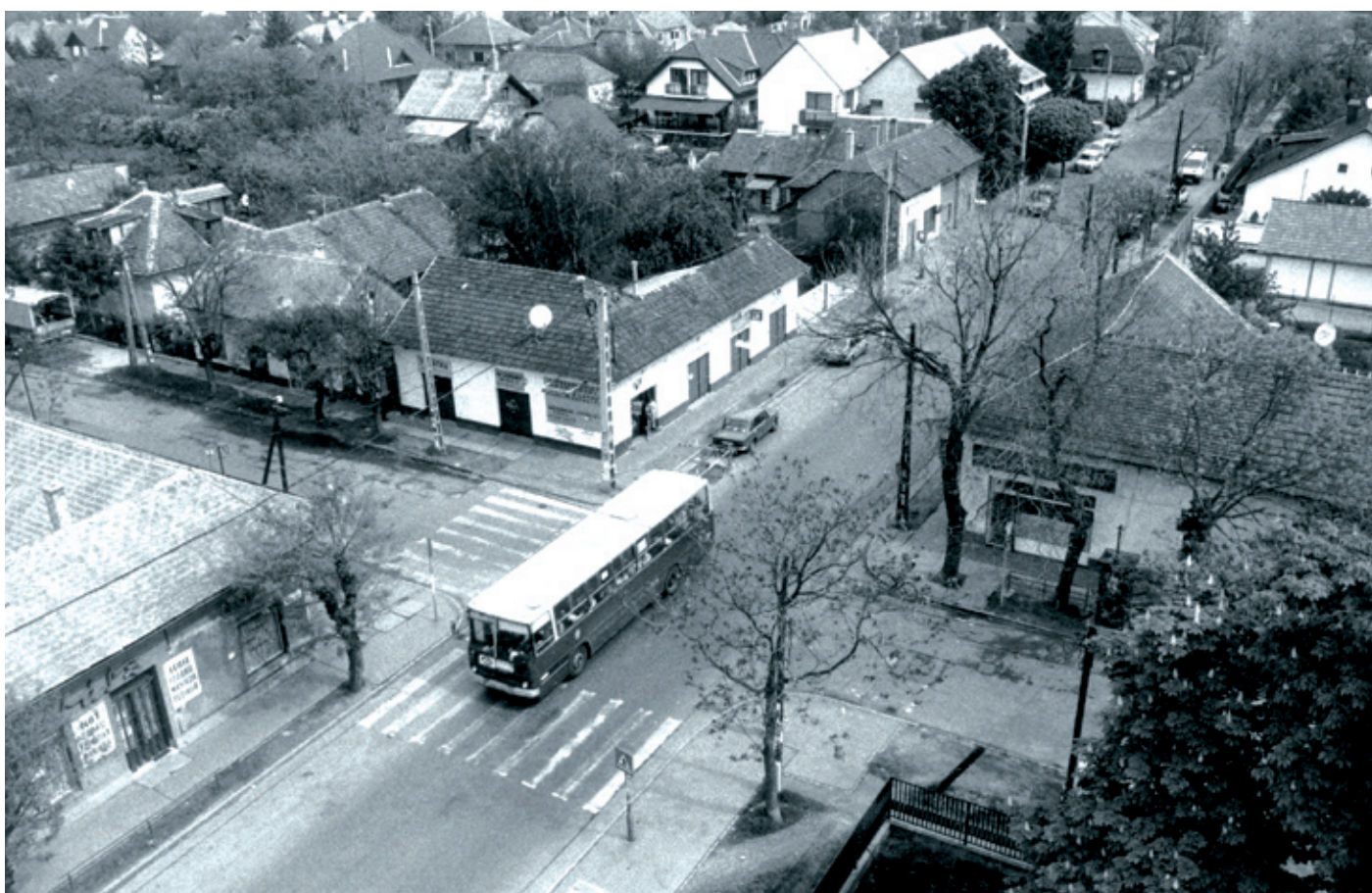
A Nemes utca és az Ady Endre utca környéke 1956-ban a béke szigete volt, mint Pestimre nagyobb része is

A harckocsik parancsnoka szerencsére nem az emberekre lőtt