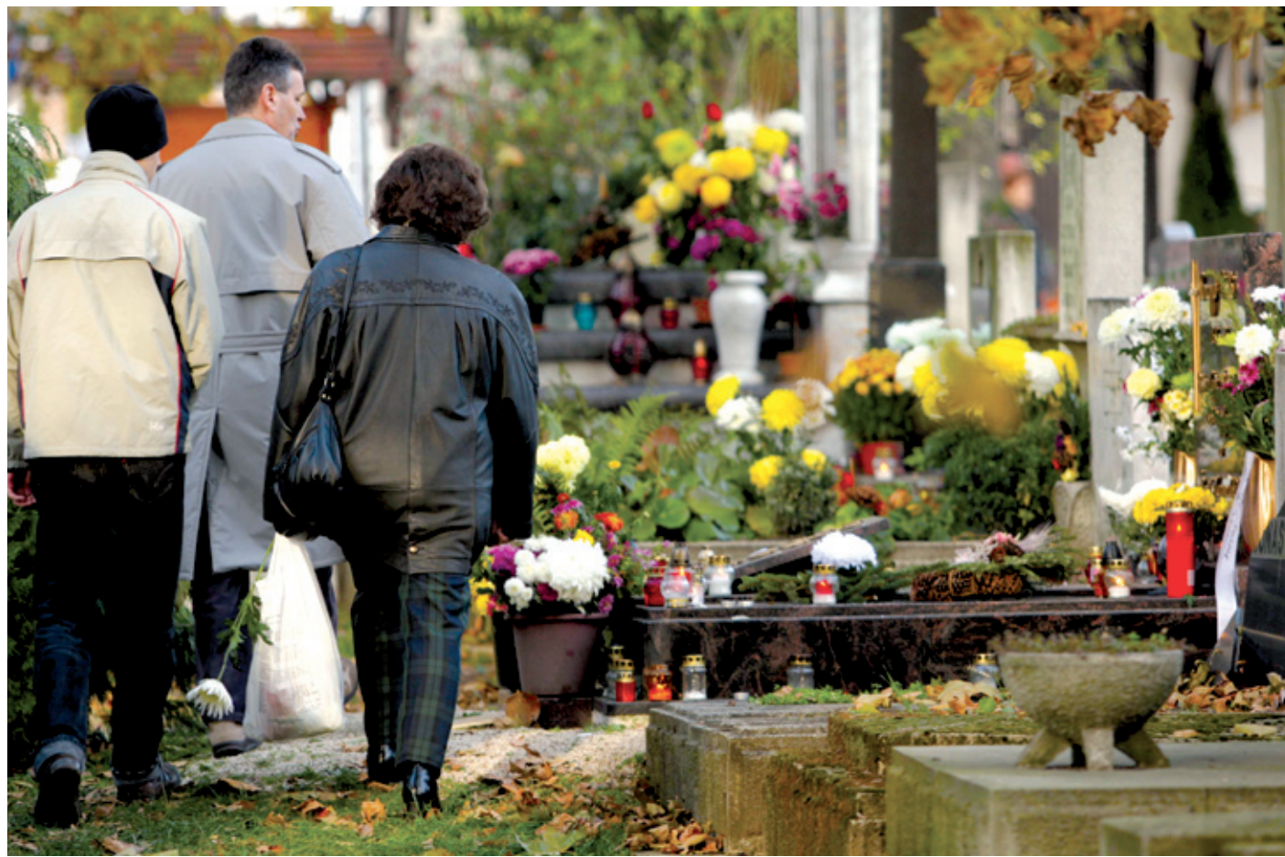
Fontos, hogy a fiatalok is megértsék: a halállal csak a földi lét zárul le

Keresztény családként gondolnak és emlékeznek az eltávozott szeretteikre