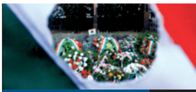
A SZÉPSÉGES OKTÓBER

Egyre többen tapasztalhatják, hogy a kerületben szeptemberben megkezdődött csatornázás gőzerővel zajlik, dolgoznak a munkagépek. A fejlesztés kapcsán tartott lakossági fórum mellett közreadjuk azon pestszentlőrinci és pestszentimrei utcák listáját is, amelyekben megfelelő időjárás esetén még az idén megkezdődik és be is fejeződik a csatornahálózat kiépítése.