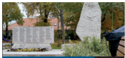
SZEBB A KÖRNYEZET