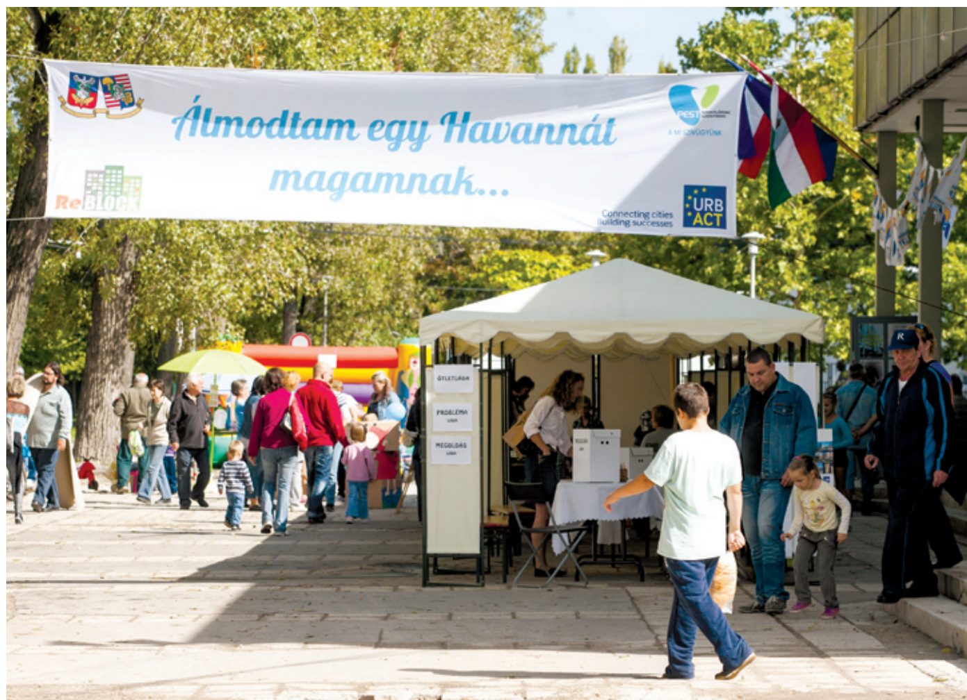
A Havanna-napokon a lakosság is elmondhatta a véleményét a szükséges fejlesztésekről

– Ezért minden sikeres rendezvény öregbíti lakóhelyünk jó hírét, vendégeink hírt adnak azokról saját környezetükben. Ellenzéki képviselőként sem annyira kritizálni szeretnék, mint inkább rávilágítani a továbbra is előttünk álló közös munka fontosabb elemeire. Úgy vélem, hosszú távon tarthatatlan a Bókay-kert tömegrendezvényekre történő igénybevétele. Kell talánunk olyan helyet a kerületben, ahol azok a nagy zajjal és jelentős környezeti terheléssel járó rendezvények is lebonyolíthatók, amelyek után a kert szinte egy elhagyott csatárképét mutatja. Az önkormányzat nyáron a lakosság véleményét kérte a kert jövőbeni sorsával kapcsolatban. Kíváncsian várom, milyen fejlesztési elképzelések kerülnek előtérbe ennek eredményeképp. Ehhez kapcsolódóan felhívom a mostani vezetés figyelmét egy, a korábbi önkormányzati ciklusban folytatott „jó gyakorlat” hiányára. Egy-egy fesztivál, ahol sok, nagyon különböző érdekű és gondolkodású kerületi