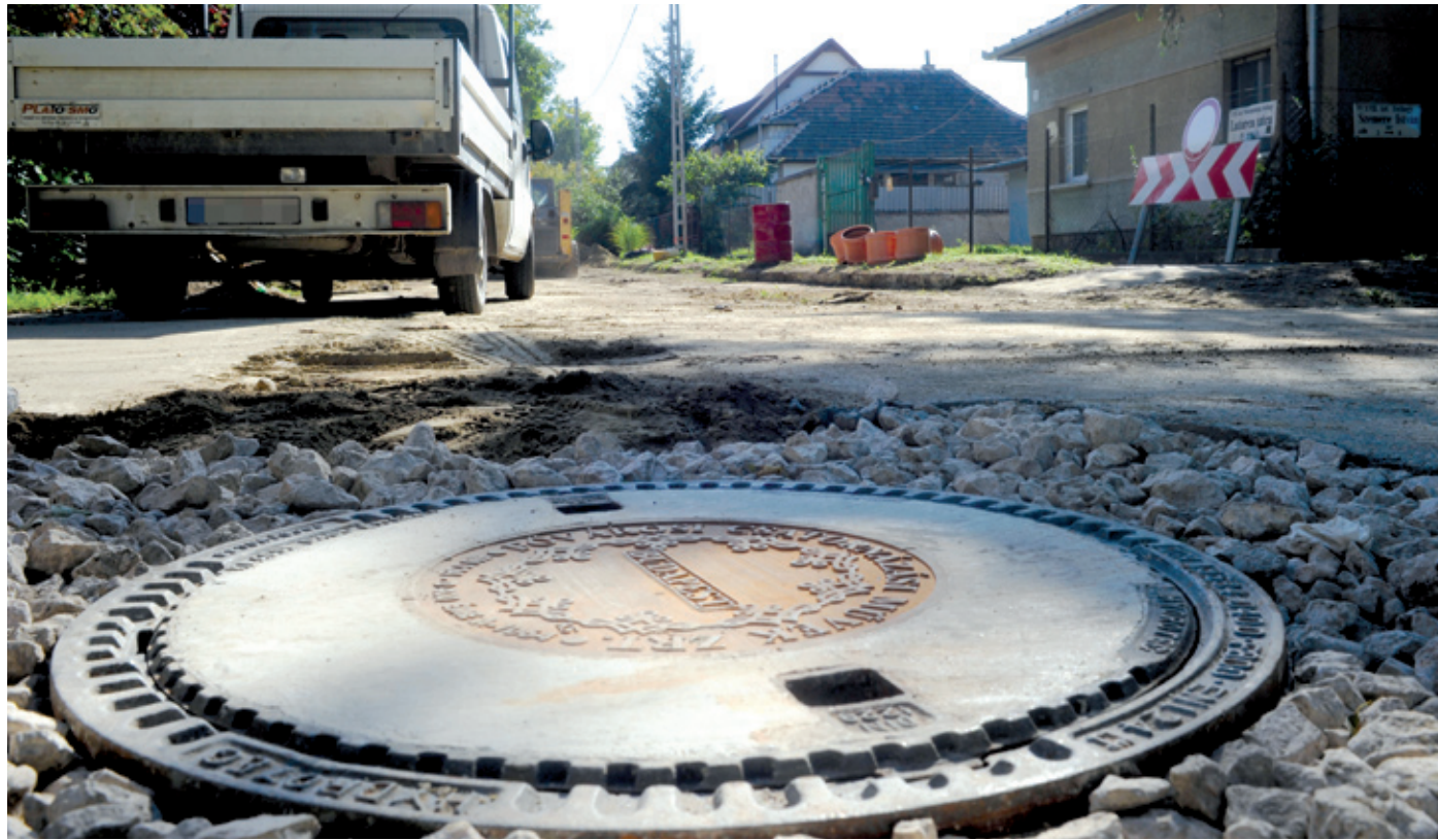
A telken belüli bekötésekkel az önkormányzat a Városgazda XVIII. kerület Nonprofit Zrt-t bízta meg

A csatornázással végre korszerű közműhálózat jön létre a fővárosban