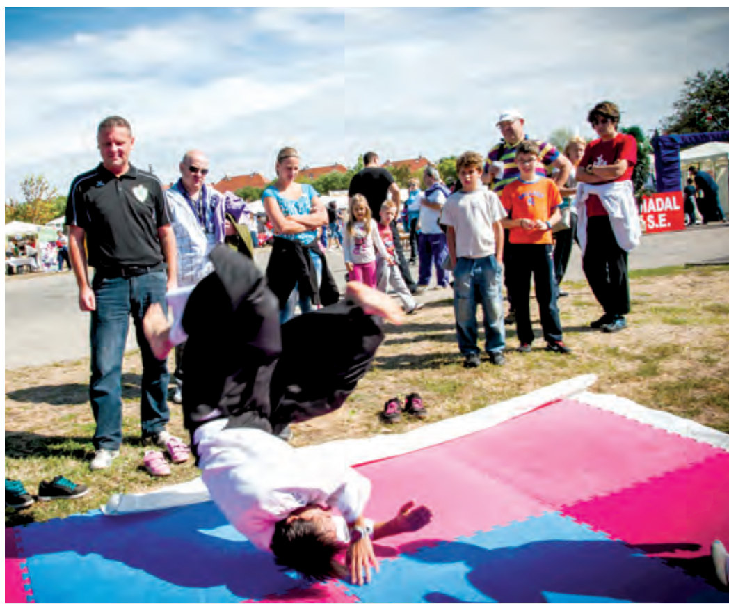
A Sportizelítőn mintegy 30 sportág képviselői tartanak majd bemutatót

Sportágak tömegből választhatnak azok, akik szeptember 22-én kilátogatnak a Bókay-kertbe. Délelőtt 10-től este 6-ig minden a sportról, a mozgásról, az egészségről szól e napon.