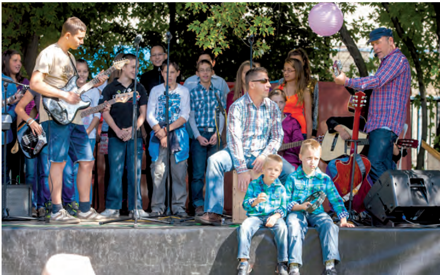
Ilyen egy családias hangulatú rendezvény, ahol szinte mindenki ismeri egymást

Kitartó munkával összekovácsolódott a közösség