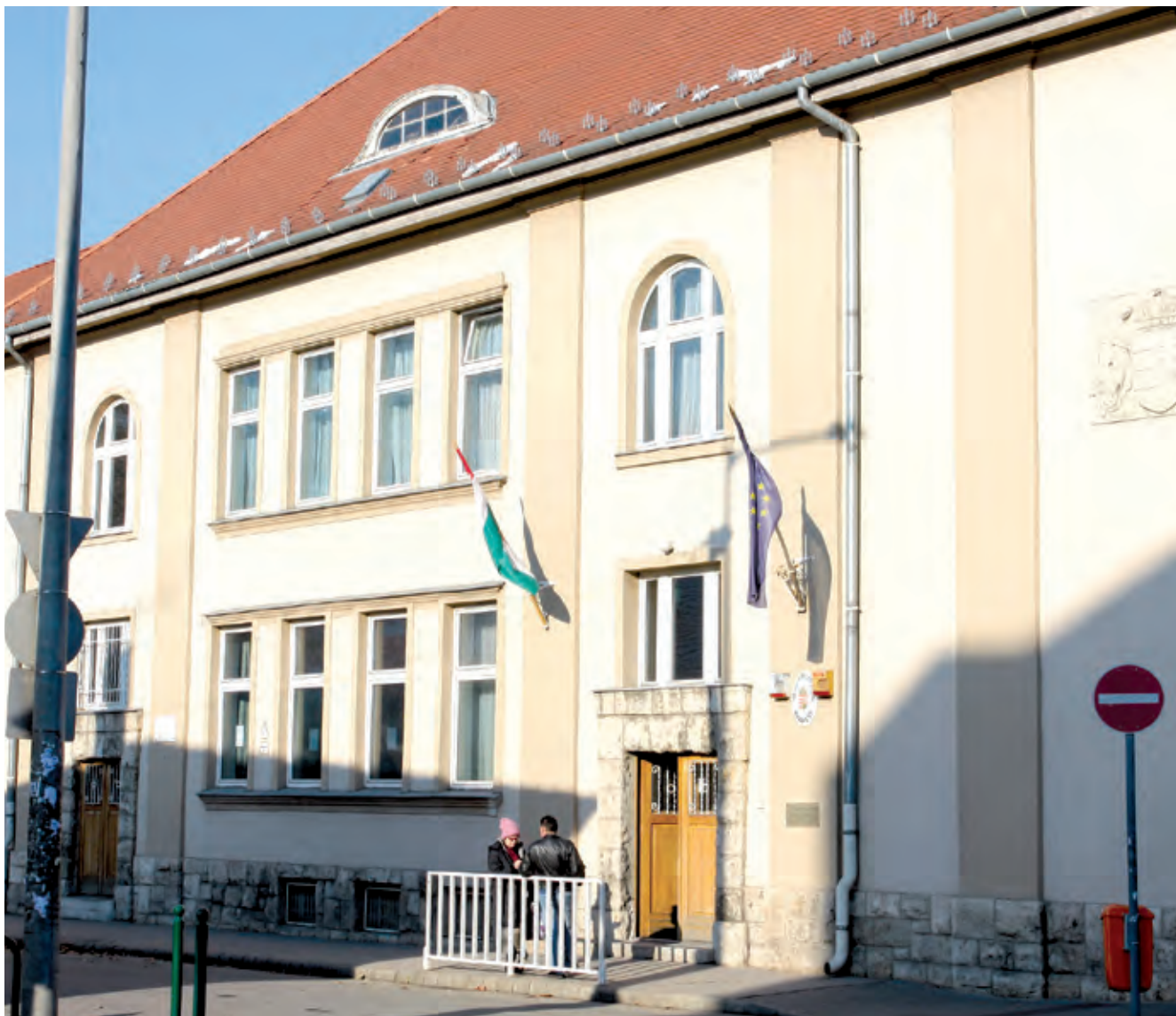
Eddig csupán egy ügyet tárgyalta a bíróság, de közel harminc esetet még vizsgálnak a hatóságok

➤ Az önkormányzat által még 2010 végén felállított elszámoltatási munkacsoport több mint harminc feljelentést tett az előző önkormányzati ciklusok alatt tapasztalt szabálytalanságokkal kapcsolatban. A bíróság idén májusban hozott elsőfokú ítéletet az egyik ügyben, a többien pedig folyik még a nyomozás.