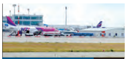
CSENESEBB REPTÉR 3. oldal

A Liszt Ferenc Nemzetközi Repülőtér a XVIII. kerület egyik legjelentősebb szomszédja. Fontosságát mindenki ismeri, ám a légi forgalommal járó zaj miatt számos kritika is megfogalmazódik. Szarvas Gáborral , a Budapest Airport igazgatójával az elmúlt időszakban végrehajtott fejlesztésekről, a változásokról és a várható további lépésekről beszélgettünk.