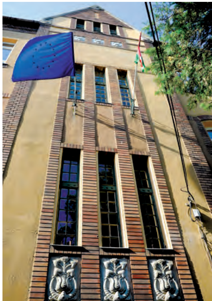
A kerület több iskolájában végeztek felújítást, a legjelentősebb átalakítás a Bókay Árpád Általános Iskolában zajlott

Intézmények és közterületek is megújultak a nyáron