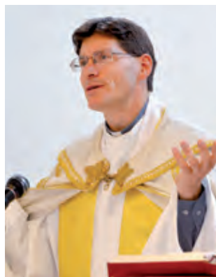
„A közösséget itt hagyni nem volt könnyű, de az éppen

Gödölle atyát akár „pestszentimrei templomépítőnek” is nevezhetjük, mert oly sokat tett az épületegyüttes megújításáért. Talán elég, ha a 2011-ben épített urnatemetőt, a templomtetőt 2012-es újjáépítését vagy a szentély felújítását említjük, amely nemrég fejeződött be.