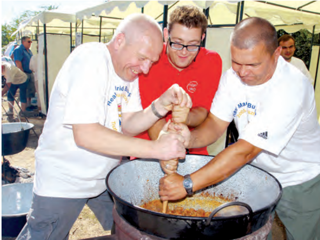
A közös főzés során derül ki, milyen az összhang a csapatokban

Cseh és magyar ételkülönlegességek a Szeptemberi Kóstolón