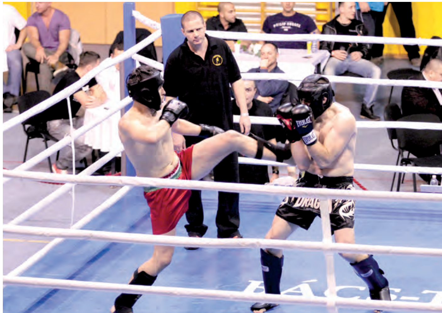
Tavasszal az egyesület a thai box világbajnokság hazai válogatóját hozta el kerületünkbe