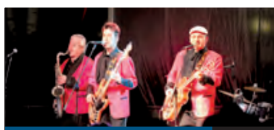
EGY HÉT A HAVANNÁN 17. oldal

Ritkán tapasztalható csúcsforgalom volt a Szent László utcában augusztus 31-én, szombaton, ugyanis ekkor avatták a Sztehlo Gábor evangélikus óvodát, amely a Fecskefészek nevet is viseli. Rekordidő, nyolc hónap alatt készült el az új intézmény, amely szeptember közepétől várja a kiscsereket, akiknek korábban csak egy egycsoportos óvodájuk volt.