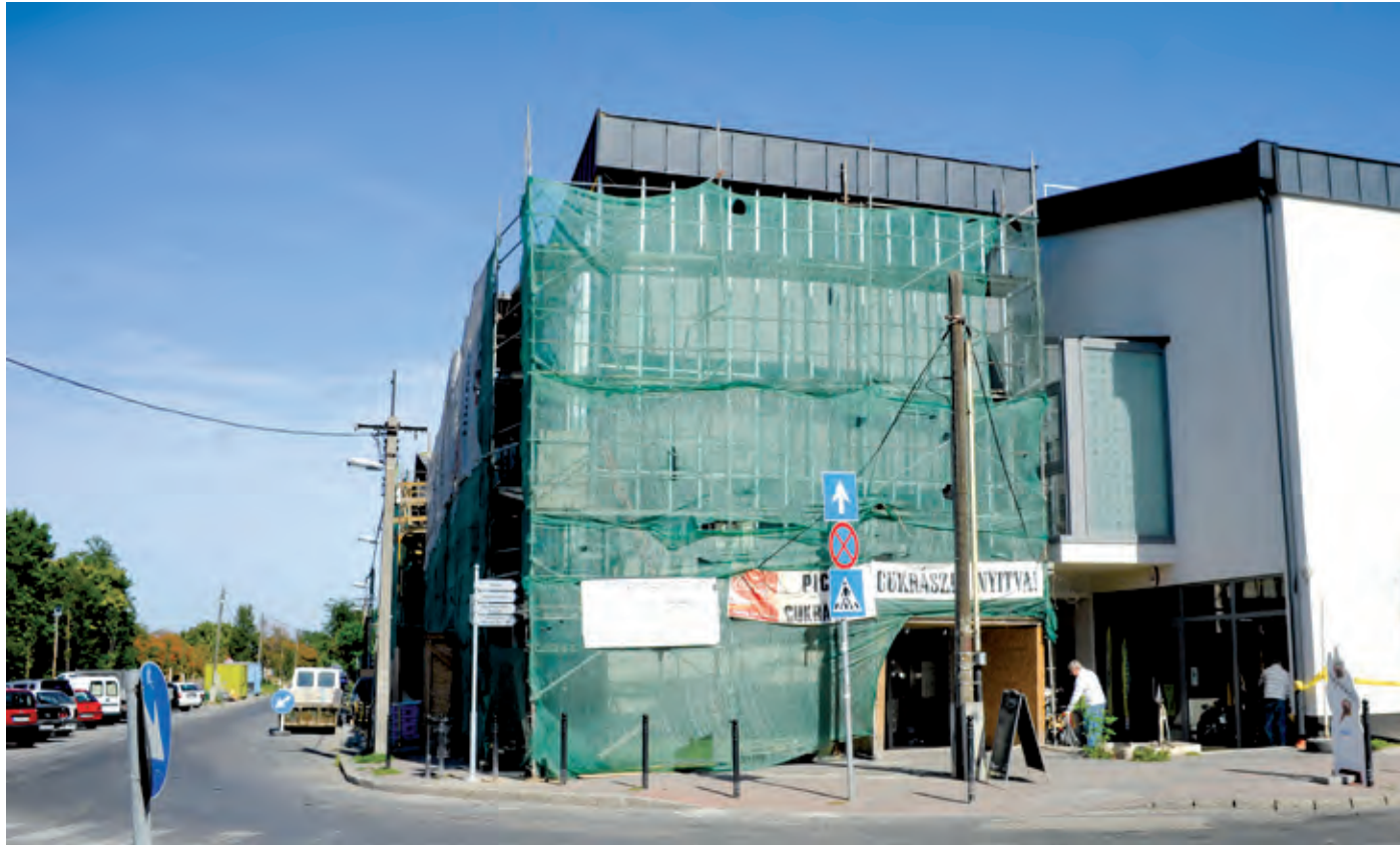
A régi PIK helyén egy új, modern, minden igényt kielégítő kulturális intézmény létesül

funkcióját megtartja a közösségi ház, s a valamikori szolgáltatóházzal egybeépülve új helyiségekkel is bővül – mutatott rá Péterszegi Imre . – A belső tér átalakul, és jelentős változást jelent például az, hogy az elő-