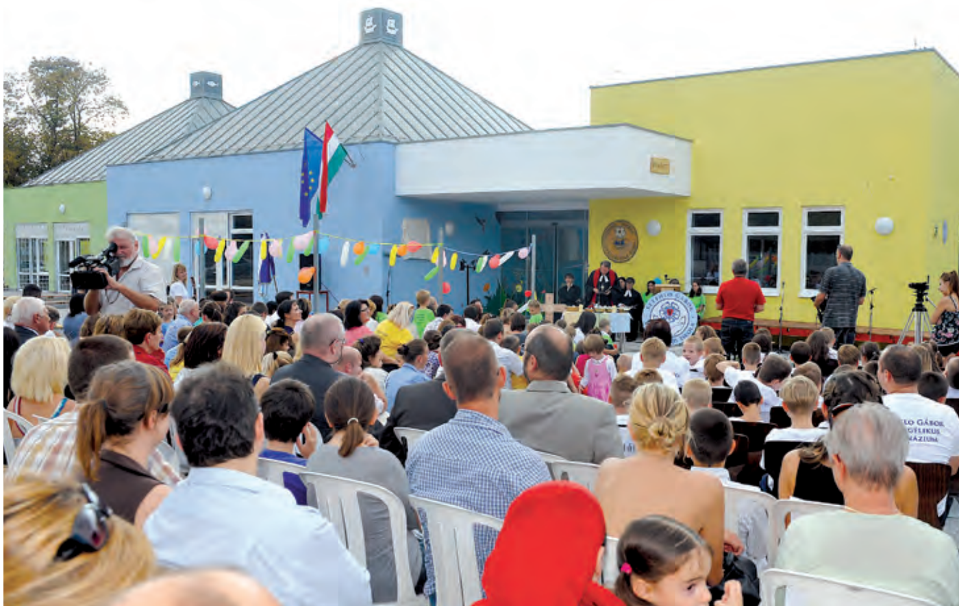
A keresztény jelképeket viselő csoportok más és más színű épületben töltik majd a napjaikat

Hajók, halak és galambok a Szent László utcában