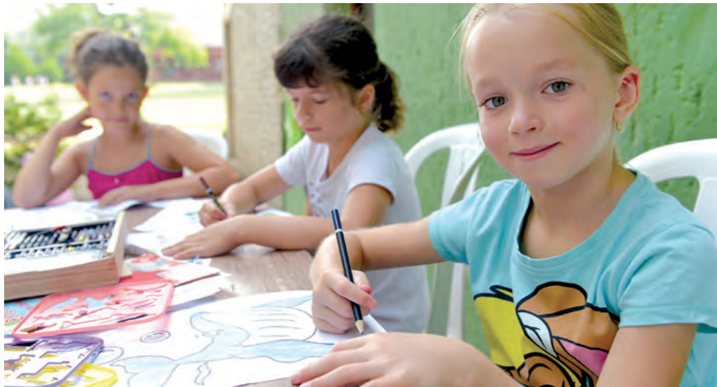
A különböző korosztályú gyermekek foglalkoztatása mindig nagy kihívás a pedagógusoknak

– A csoportok kialakításakor az egyik fontos szempont a korosztály volt. A tábor az első három hét alatt volt a legnépesebb, akkor a közel 600 gyerek felügyelete, foglalkoztatása igazi kihívás volt az egyébként gyakorlott pedagógusoknak. Később, a nyaralási főszezonban