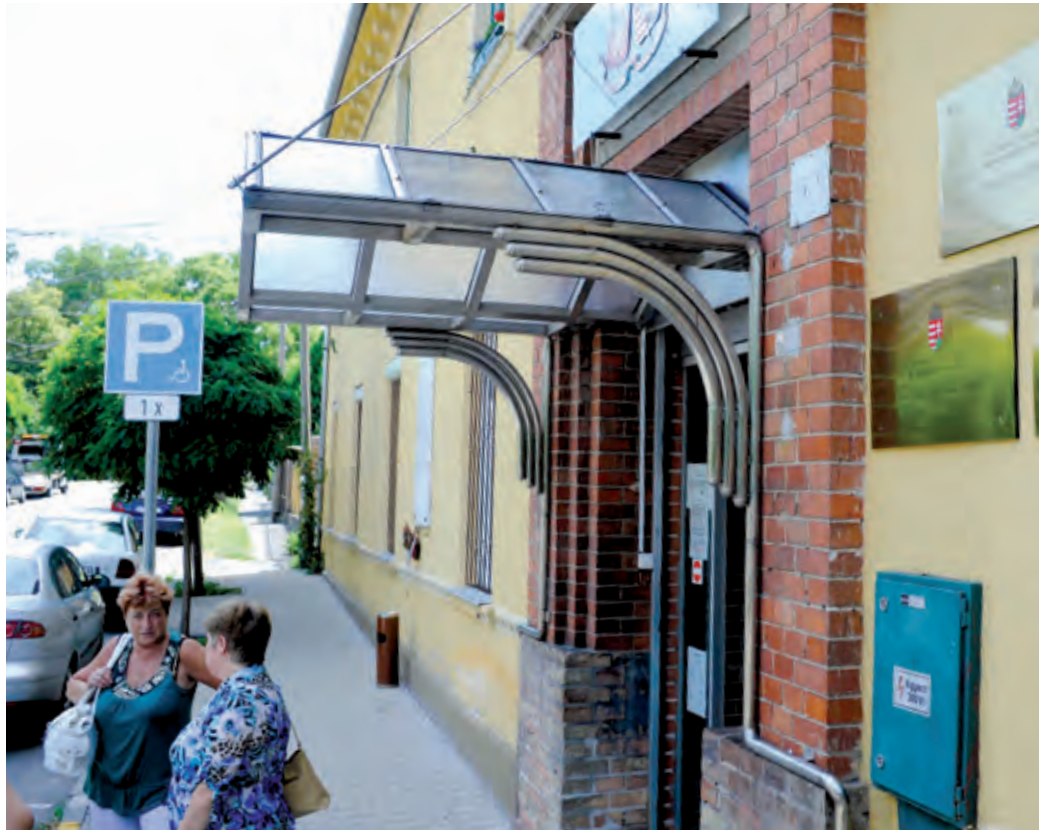
Az önkormányzat újabb helyiségeket enged át a kormányhivatalnak

– Saját kérdőívekkel folyamatosan szondáztuk az ügyfelek igényeit, és ezeknek megfelelően változtattunk, amin lehetett. A legfontosabb a nyitva tartás meghosszabbítása volt. Két olyan nap is van – a hétfő és a szerda –, amikor 18 óráig kereshetnek fel bennünket az ügyfelek, egy újabb döntésnek