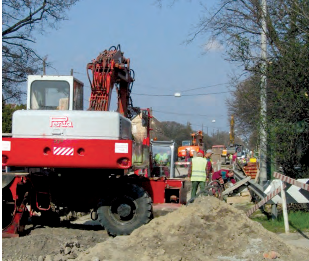
A házi bekötések díját pályázat útján támogatja majd az önkormányzat

– A házi bekötések díját pályázat útján támogatja majd az