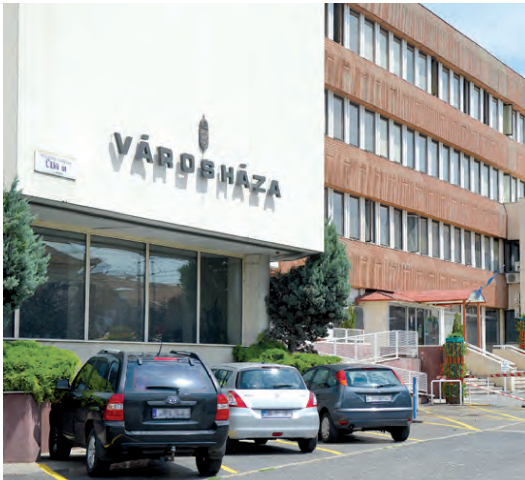
Az önkormányzat a sikeres gazdálkodásnak köszönhetően tavaly nem vett fel új hitelt

Vita keresztútjában a kerületi adósságállomány