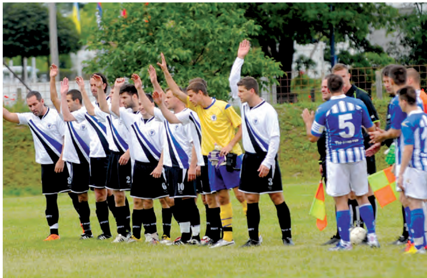
A PSK elleni rangadón nemcsak köszöntötték a szurkolókat, hanem többen búcsút is intettek