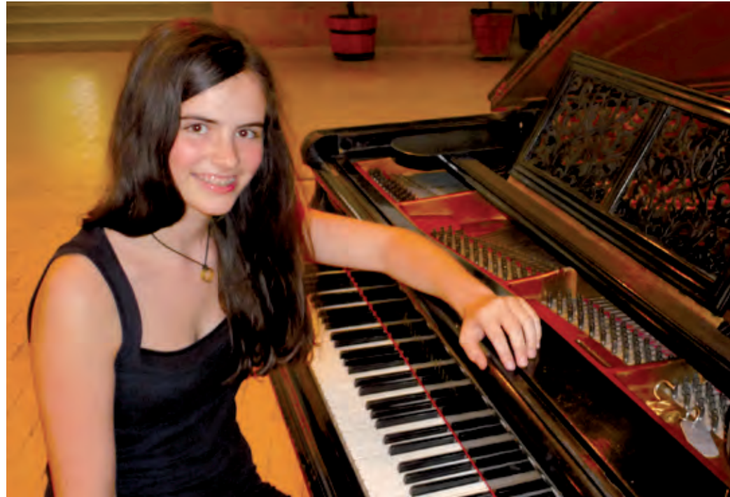
Naponta minimum négy-öt órát gyakorol, de a versenyek előtt ennél is többet

– Sokat tanultam, és jó volt a bizonyítványom. Szerencsére a tanárain, az osztályfőnököm és az osztálytársaim megbecsül-