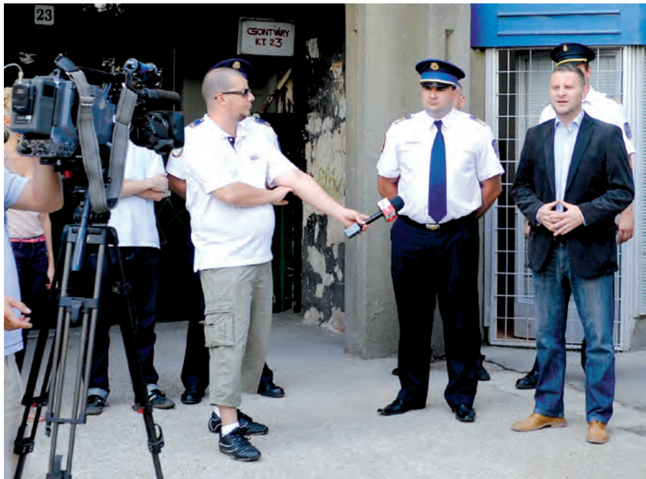
A cél az, hogy a lakótelepen élők biztonságérzete javuljon

Rendőrségi iroda nyílt a Csontváry utcában