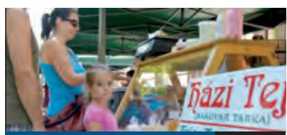
INDUL A PIAC