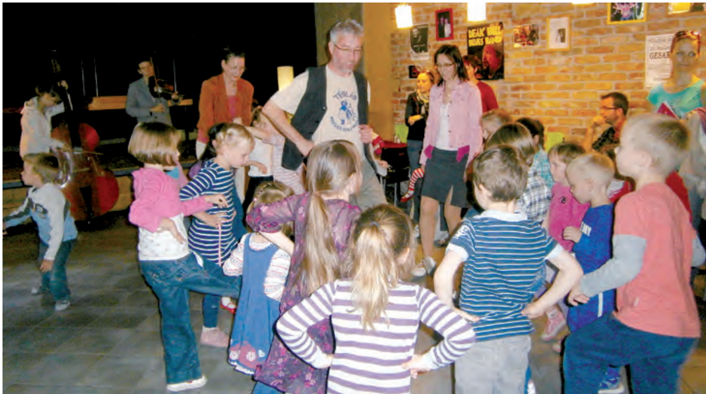
A gyermekek szüleikkel együtt hagyományörző dalokat és játékokat tanultak

– Az óvodai nevelésben a verseny fogalma még nem jelenik meg, a gyermekeknek a képességeik kibontakozására kapott szabad alkotási lehetőség nyújt örömet – hangsúlyozta Tóthné