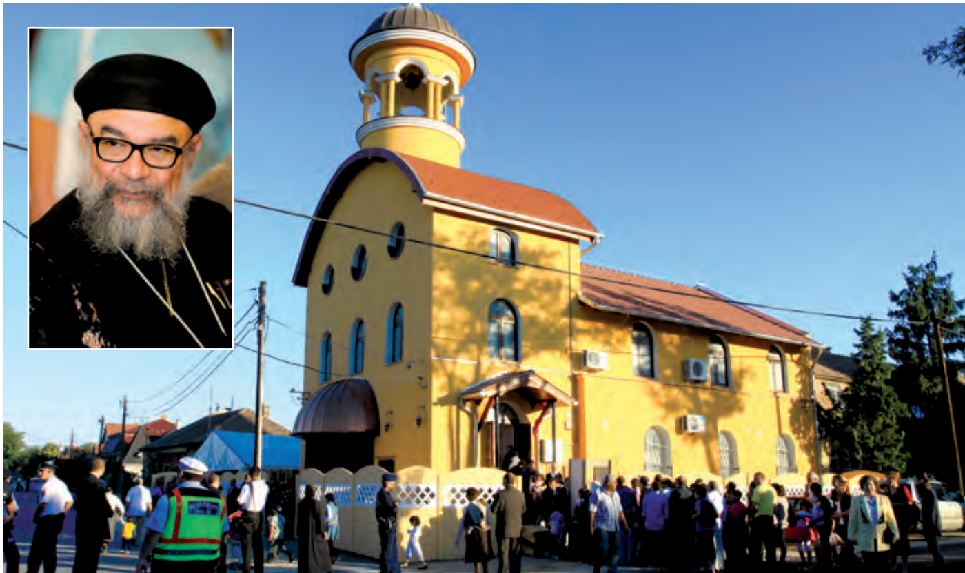
A templom mindenki előtt nyitva áll, egyre több magyar hívó jár ide

A kopt főesperes állampolgársági esküt tett