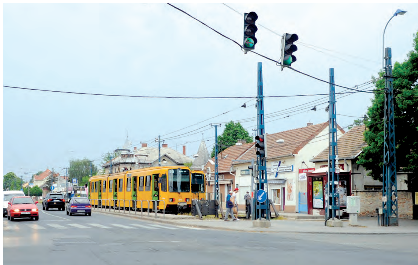
A Béke tér átalakításával a kerület két városrészközpontja szépülhet meg ebben a ciklusban

Egy korábbi tervpályázat kapcsán megtartott lakossági fórumon a lakók elmondták, hogy fontosnak tartják a parkolási gondok enyhítését, ezen belül pedig kerékpártárolókat is szívesen látnának. Fontosnak érzik a gondozott parkot, hogy minél