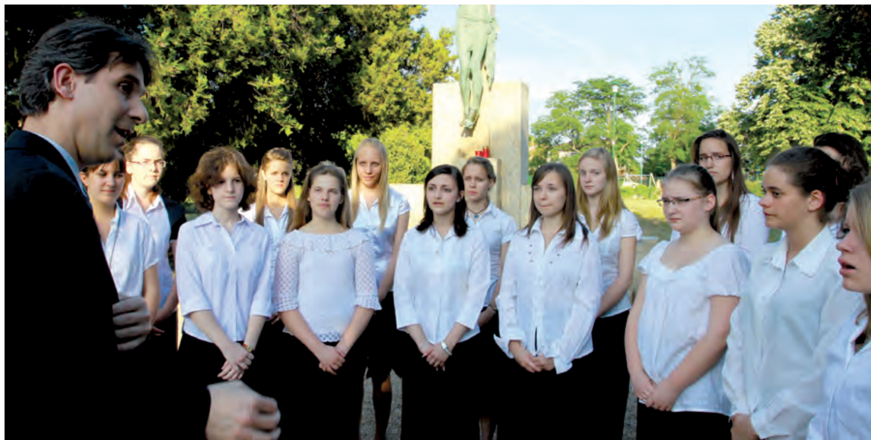
A nemzeti összetartozás napján az önkormányzat vezetői mellett a pártok képviselői, a civilek és a kerületi iskolások is emlékeznek a Fadrusz-keresztnél

Idén is számos megemlékezés lesz országsszerte, így a XVIII. kerületben is az 1920-as trianoni békeszerződés aláírásának évfordulója-hoz, június 4-éhez kapcsolódva, amely az Országgyűlés 2010. május 31-i döntése értelmében Magyarországon a nemzeti összetartozás napja. A kerületi önkormányzat ellenzéki képviselőit arról kérdeztük, hogy részt vesznek-e a megemlékezésen, illetve miért vélik fontosnak ezt az évfordulót.