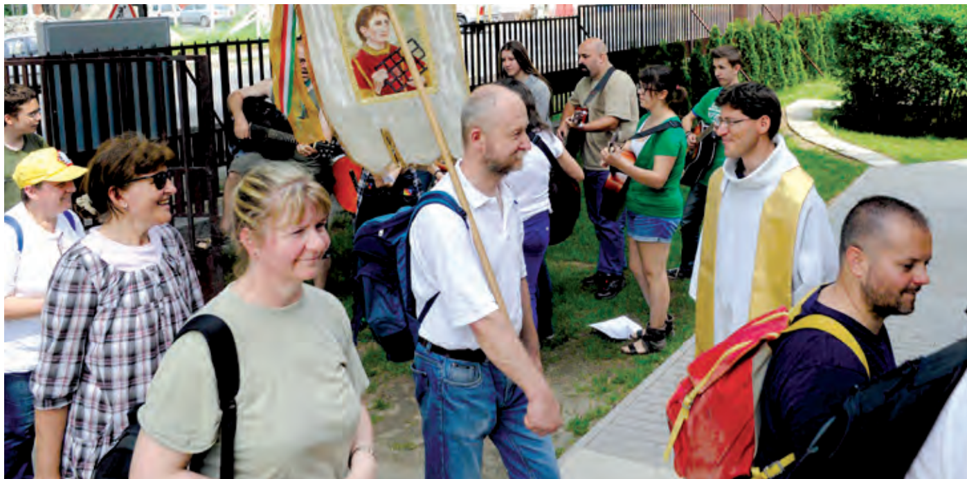
A kertben terített asztallal és az elmaradhatatlan meglepetésfagylalttal kedveskedtek a zarándokcsapatnak

Az időjárás is azt akarta, hogy emlékezetes legyen a Rózsafűzér-zarándoklat