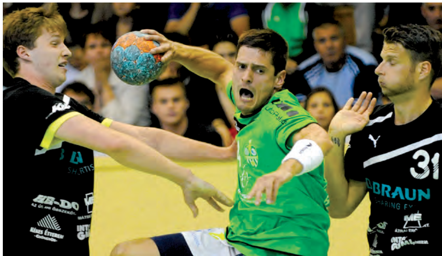
Az 5. helyet öldöklő küzdelemben harcolta ki az FTC-PLER Budapest, amely ezzel küzdenitudásból is jelest kapott

➤ Az FTC-PLER Budapest és a Braun Gyöngyös három felvonásos „kézilabdakrimít” adott elő a bajnokság rájátszásában. Az elsőt a vendég Gyöngyös nyerte hetesekkel, a másodikban egyenlített az FTC-PLER. A múlt pénteki, harmadik találkozó pedig az egész sorozatot megkoronázta azáltal, hogy a mieink örülhettek, mert ezúttal az ő heteseik voltak pontosabban a rendes játékidő döntetlenje után. A 31-30-as siker azt jelentette, hogy a csapat teljesítette, amit vállalt: az 5. helyen végzett az erős bajnokságban.