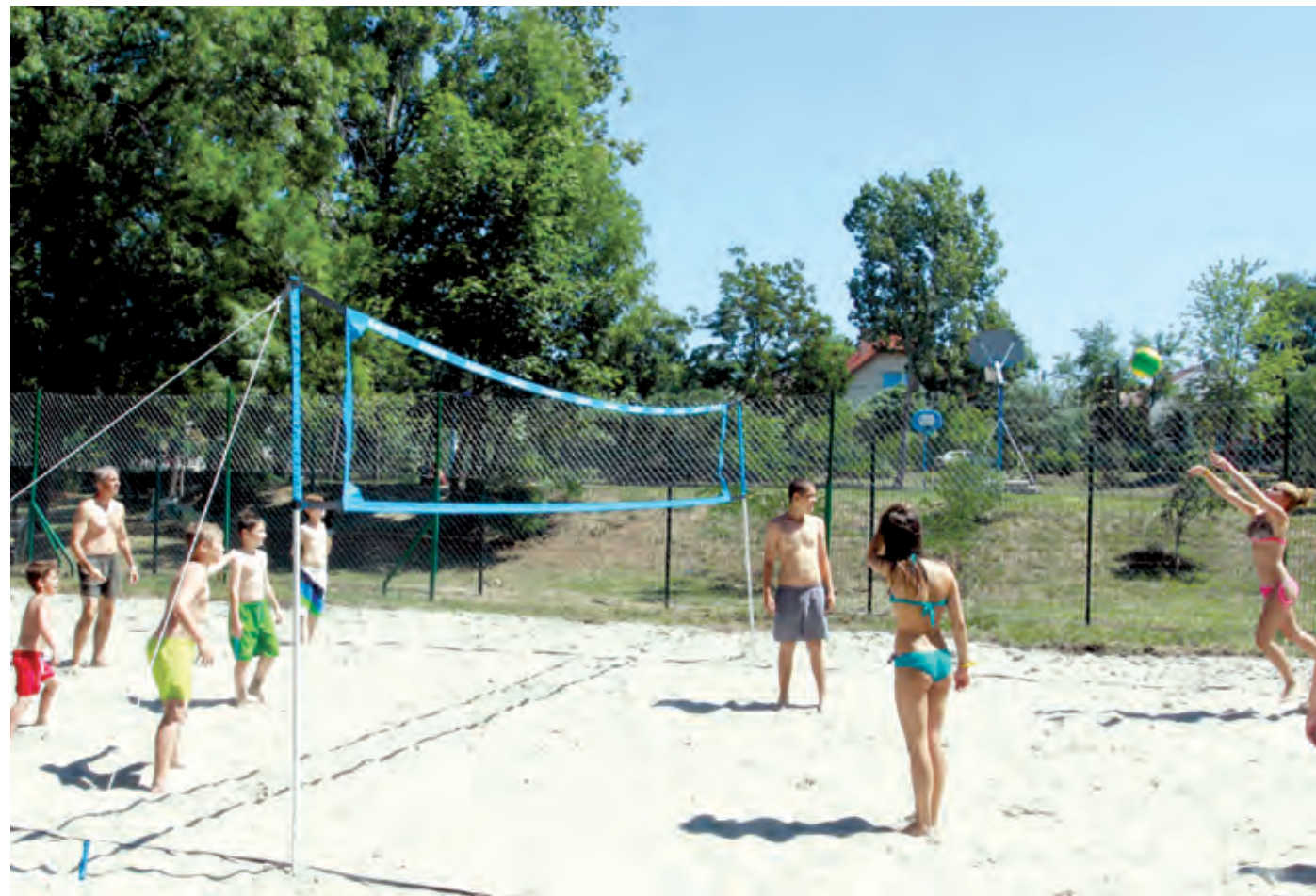
A strandröplabda-pálya már tavaly is nagy sikert aratott, de rendszeres vízi aerobicot is terveznek

– Az előbb felsoroltakon kívül bemutatkozott a thai boksz