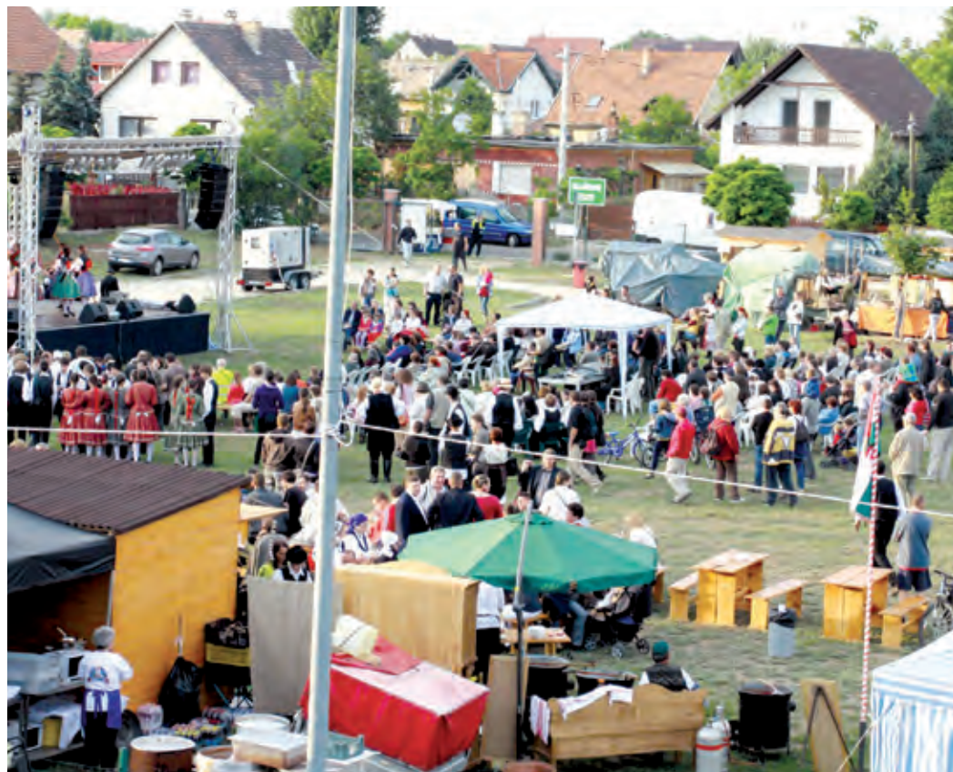
A Sportkastély melletti területen nem csak rendezvényeket, vásárokat is tartanak majd

lökkel kialakuló jó kapcsolatot az önkormányzat szeretné oktatási célokra is felhasználni: