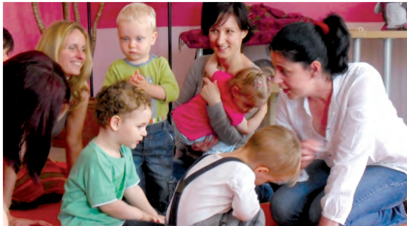
Az ifjú szülőket praktikus tanácsokkal is segítették az egyhetes programsorozaton

A témákat egy kisebb közvélemény-kutatás alapján és a nyelvviskola dolgozóit is foglalkoztató kérdések alapján állították össze.