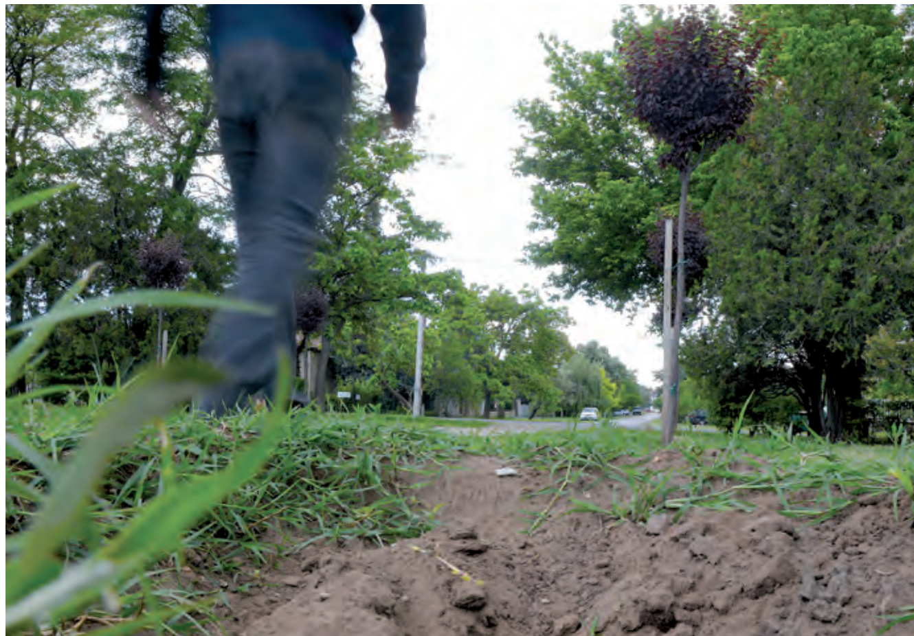
Ismeretlen tettesek több fiatal vérszilvafát loptak el a Hargita téri fasorból

Fakitermelést idén nyár elején több helyen terveznek