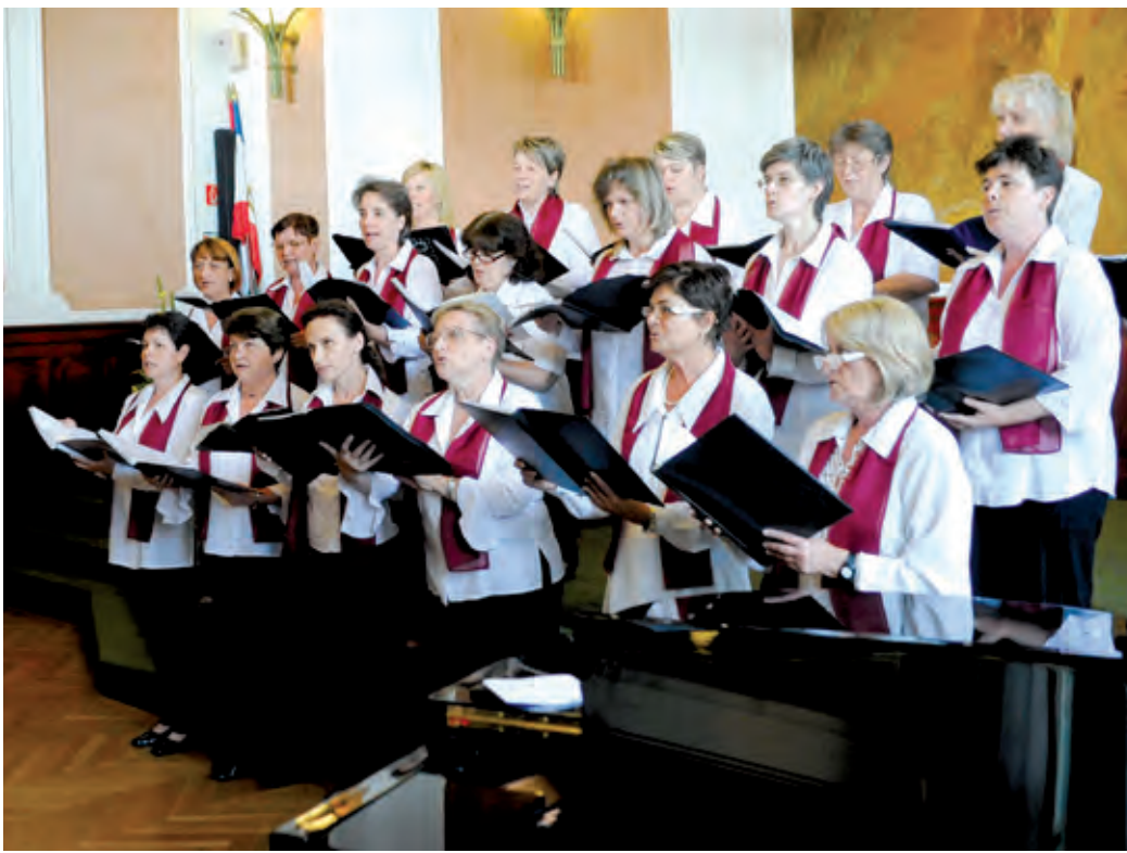
A Nyitnikék kórus 2007-ben arany minősítést kapott az Éneklő Magyarország versenyen

A legutóbb április végén énekeltek az MNG-ben a kórus, ahol bölcsődei dalok, valamint Mozart-, Kodály- és Bárdos Lajosműveket tolmácsoltak. A műsor záróakkordjaként a karnagy oklevelet vehetett át a Magyar Kórusok és Zenekarok Szövetségtől.