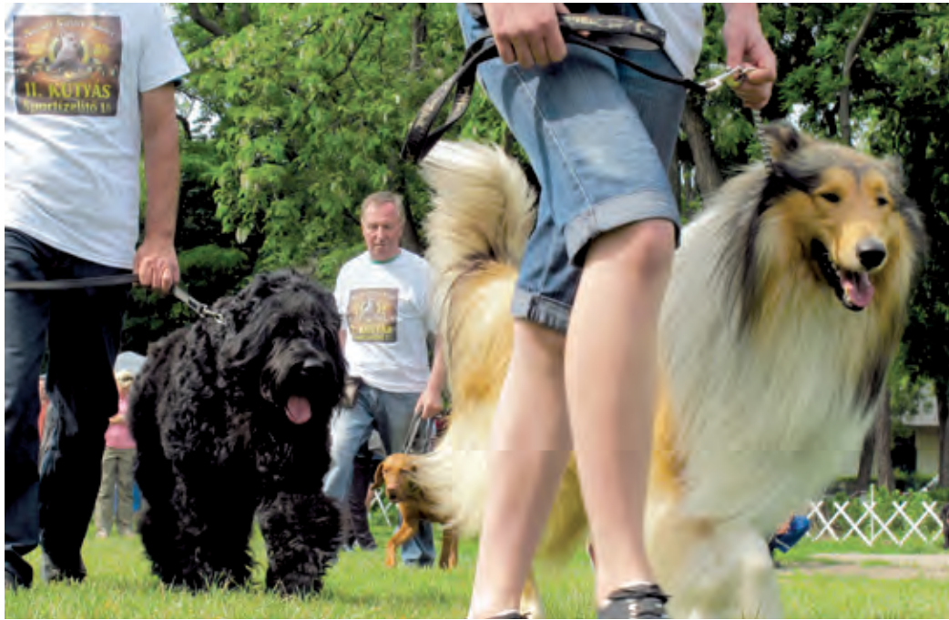
A pestszentlőrinci kutyaiskola engedelmességi bemutatót tartott