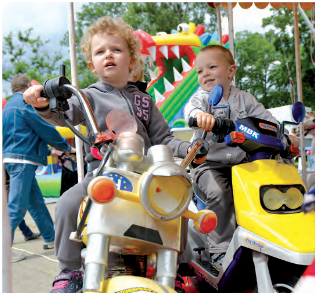
A gyermekek minden „járművet” érdeklődve próbáltak ki

Igazi családi szórakozás volt a gyermeknap a Bókay-kertben