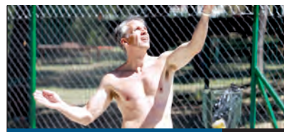
MEGNYÍLT A STRAND

Teljessé vált az új közúti-vasúti jelzőlámpás forgalomirányító rendszer, amely a Szemeretelepe vasútállomásánál lévő átjárónak, valamint a Gyömrői út és az Igló utca kereszteződésének a forgalmát szabályozza. A Budapesti Közlekedési Központ május 17-én üzemeltette be a közúti kereszteződésben az új jelzőlámpákat, amelyek figyelembe veszik a közúti forgalom nagyságát is.