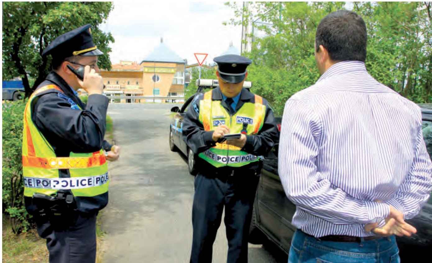
A közelben gyakran autó vár a bűntársra, a típus, a szín, a rendszám segíthet a rendőröknek

A szüniidőben is fontos, hogy figyeljünk egymásra és az értékeinkre