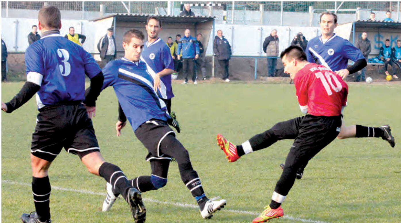
A két csapat legutóbbi három találkozóján még gólt sem kapott a PSK, ezzel most is elégedett lenne az imrei csapat

Június első vasárnapján tartják a BLSZ-bajnokság 29. fordulóját, amely kerületi szempontból izgalmas mérkőzést tartogat. A SZAC és a PSK csap össze. Rangadóról, presztízsmecsről van tehát szó, ami azt jelenti, hogy hiába áll bármelyik helyen az egyik vagy a másik csapat, a papírforma ilyenkor csak másodlagos, mert a derbi már csak ilyenek... A két szakvezetőt kérdeztük arról, mit várnak, hogyan készülnek az együtteseikkel a Lőrinc-Imre összecsapásra.