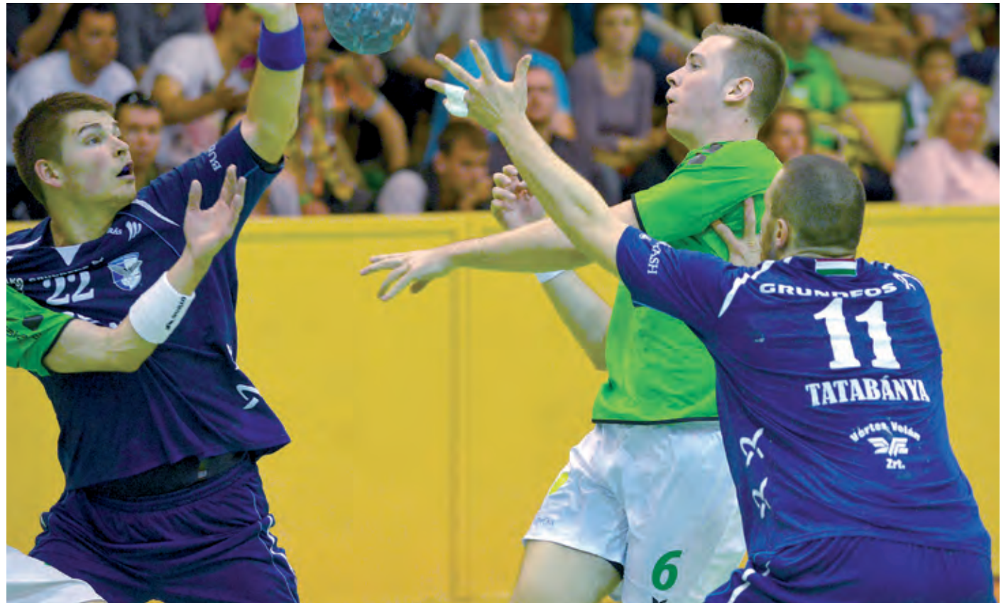
A Tatabányát mindkét mérkőzésen csak megszorítani tudta kézilabdacsapatunk