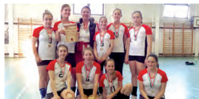
Bajnokok a leányok. A Lőrinc 2000 SE röplabda-szakosztályának leány minicapsapata a Budapesti Röplabda Szövetség által szervezett Budapest-bajnokságon százszerűteljesítménnyel aranyérmert szerzett, így kvótát érdemelt ki az Országos Mini Kupára, amelyet május 10–11-én rendeznek Budapesten.

– Azzal, ha minél több gyermek jönne el a Gerely utcai pályára, ha minél többen maradnának meg a korosztályváltások nem könnyű időszaka után, ha minél többen vennének részt a Sport XXI. elnevezésű rendezvény-sorozatban, ha a mostaninál is több bajnoki helyezettünk lenne, s ha néha-néha becsöngetne a pénzes postás.