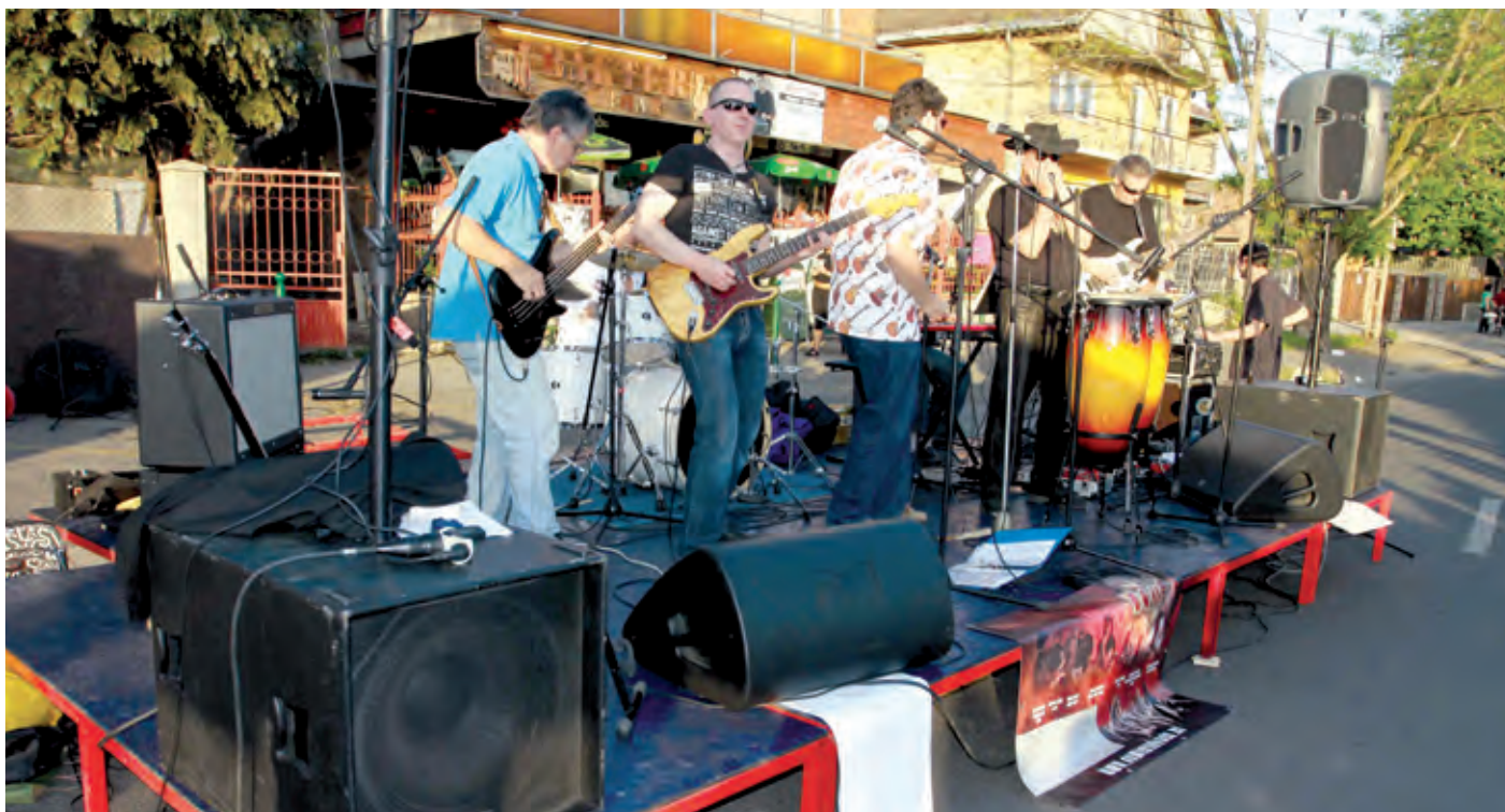
Ahogy tavaly, úgy idén is több amatőr együttes is lehetőséghez jut az utcazene-fesztiválon

Kora délutántól késő estig kerületi amatőr és profi zenészek mutatják meg, milyen színes a helyi zenei paletta. A műsor