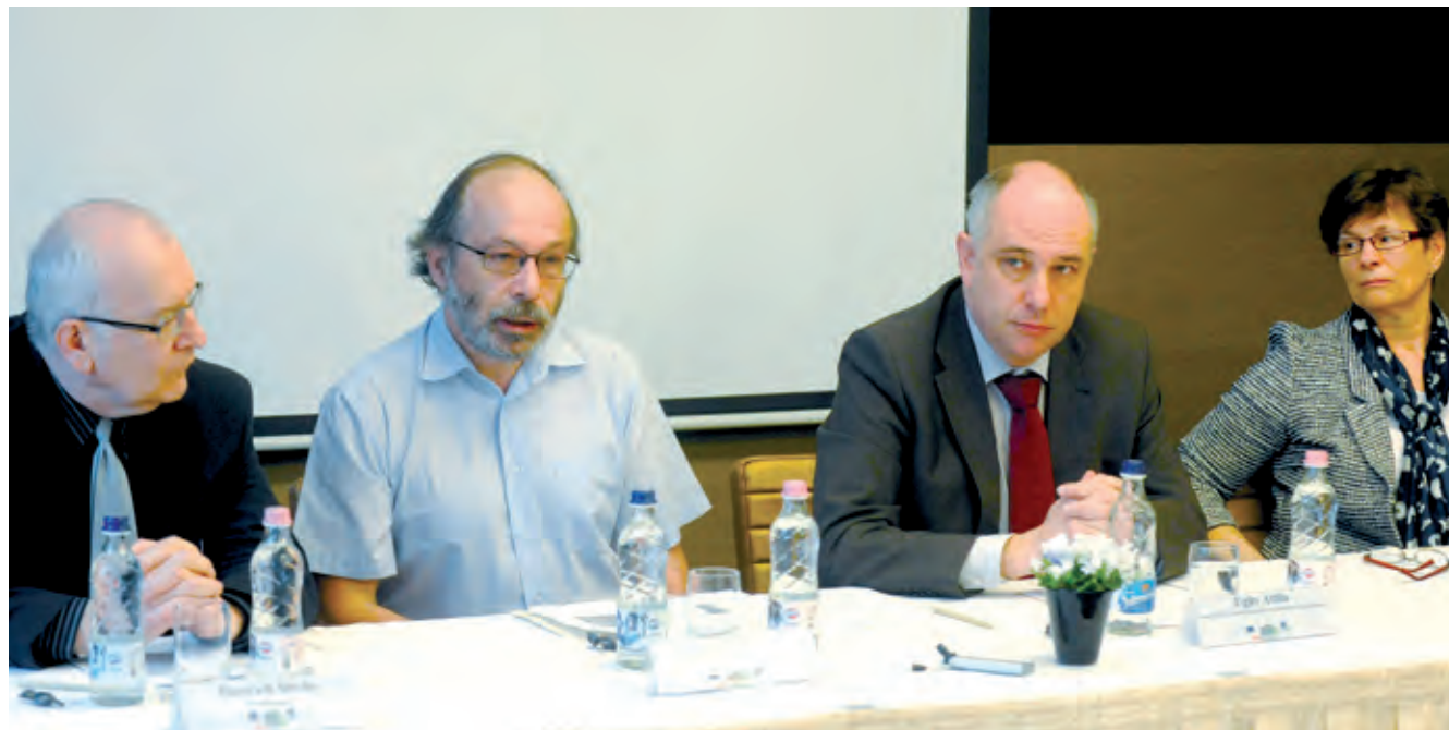
A kerület elismerése, hogy ebben az uniós projektben az önkormányzat a vezető partner

A Havanna felzárkóztatása többlépcsős folyamat lehet