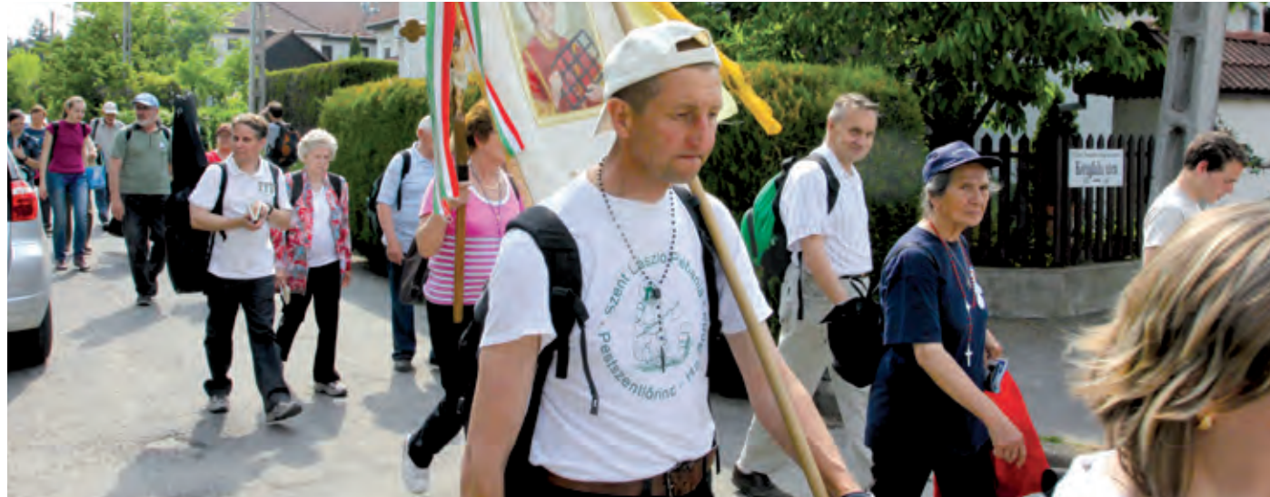
A lelki feltöltődést nyújtó zarándoklaton évről évre többen vesznek részt

A 7. szakaszban a zarándokok Soroksáron és a pesterzsébeti temetőn keresztül érnek a XXIII. kerületi Fatimai Szűzanya-templomhoz. Innen földutak vezetnek át Pestszentimrére. A továbbiakban kertvárosi utcákon, majd a Halmi-erdőn át vezet az út Szent Imre-kertvárosra és Szemeretelenen át a 17 kilométeres táv végcéljához, a lórincai