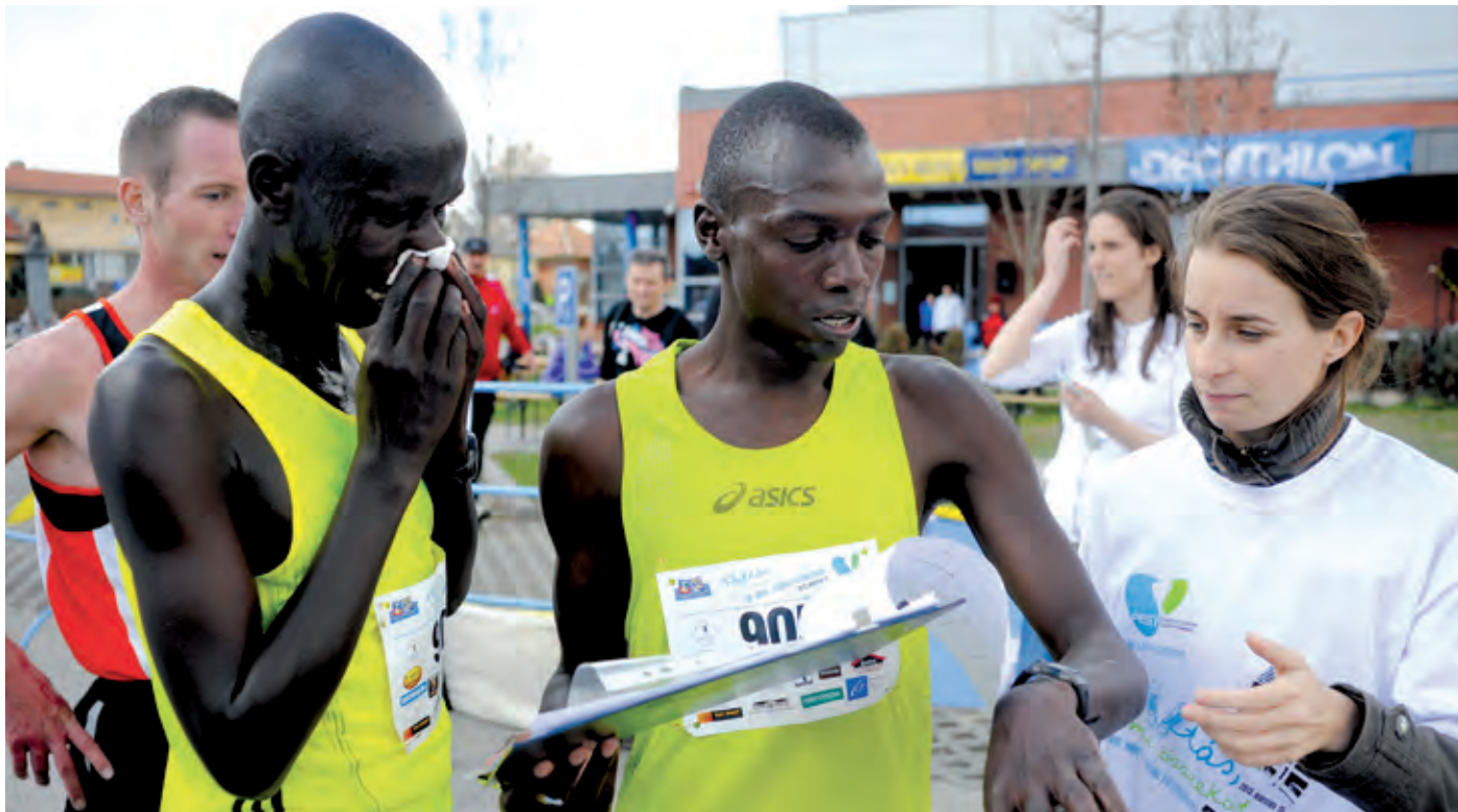
A kenyai futók bizonyították, világhírű lett a kerületi futóverseny