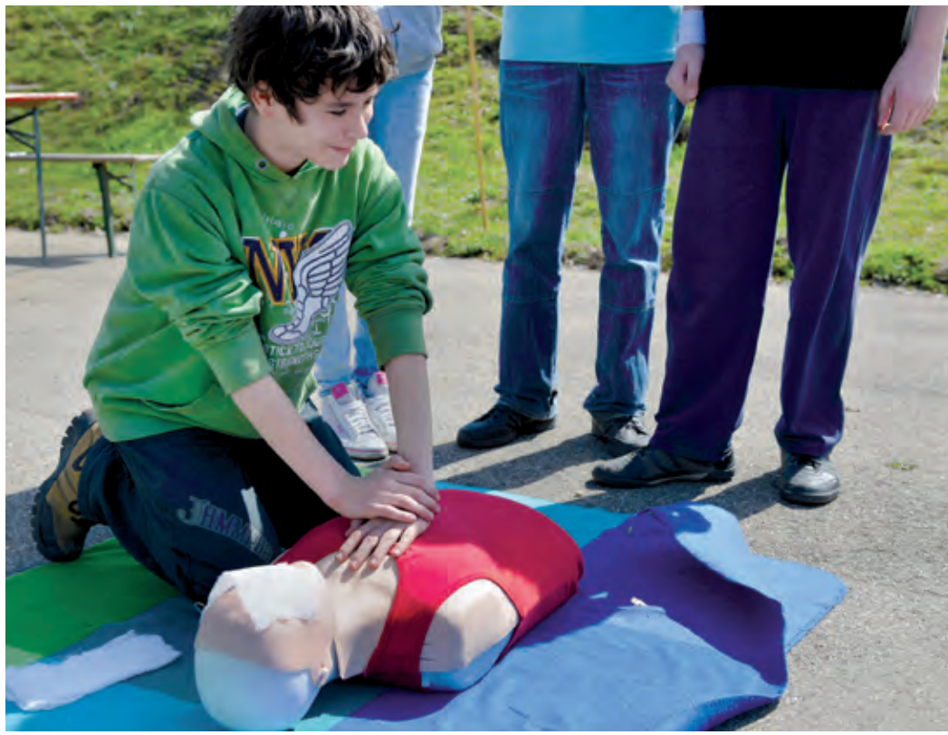
Az életmentő szívmasszázst szakszerűen mutatták be a fiatalok

Sikeres volt az ifjúsági katasztrófavédelmi verseny