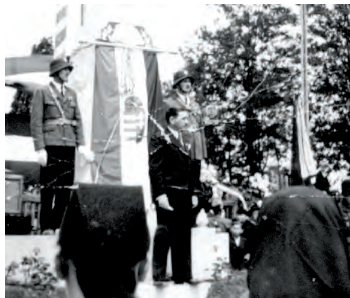
Május végén lesz 70 esztendeje, hogy felavatták az emlékművet, amelynél most nyugodtabb lehet a megemlékezés

A háborúban még lassabban gyűltek a pengők és a fillérek, s egyre távolibbnak tűnt az első