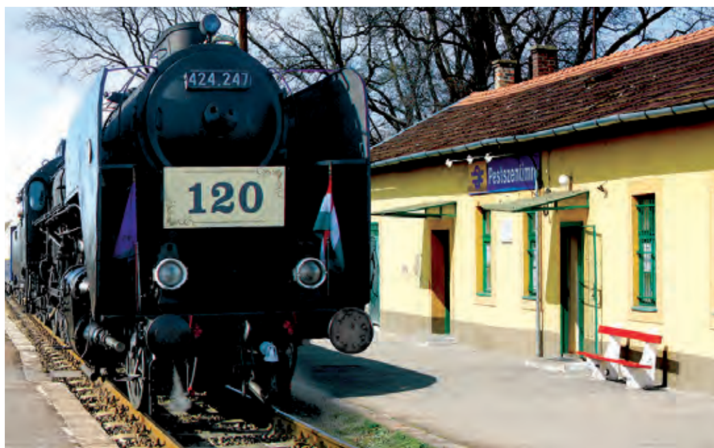
Az imrei állomáson fúvószenekar fogadja majd a beérkező szerelvényt

A Pestszentimre-projekt civil pályázatának nyertesei