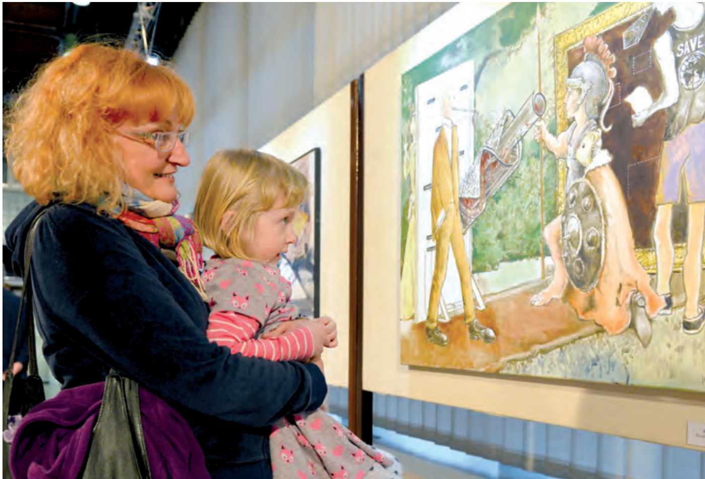
A szokatlan, vicces alkotások a gyerekek érdeklődését is felkeltették