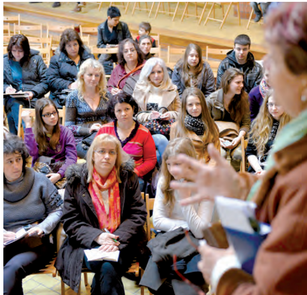
Két turnusban 80 sikeresen tanuló diák látogathat testvérvárosunkba

A múlt évhez hasonlóan élményekkel teli erdélyi barangolás vár arra a 80 lőrinci és imrei gyerekre, akik két turnusban látogathatnak el Tuszánfűrdőre. A kirándulással a kerületi önkormányzat második alkalommal jutalmazza a legjobb általános iskolás tanulókat.