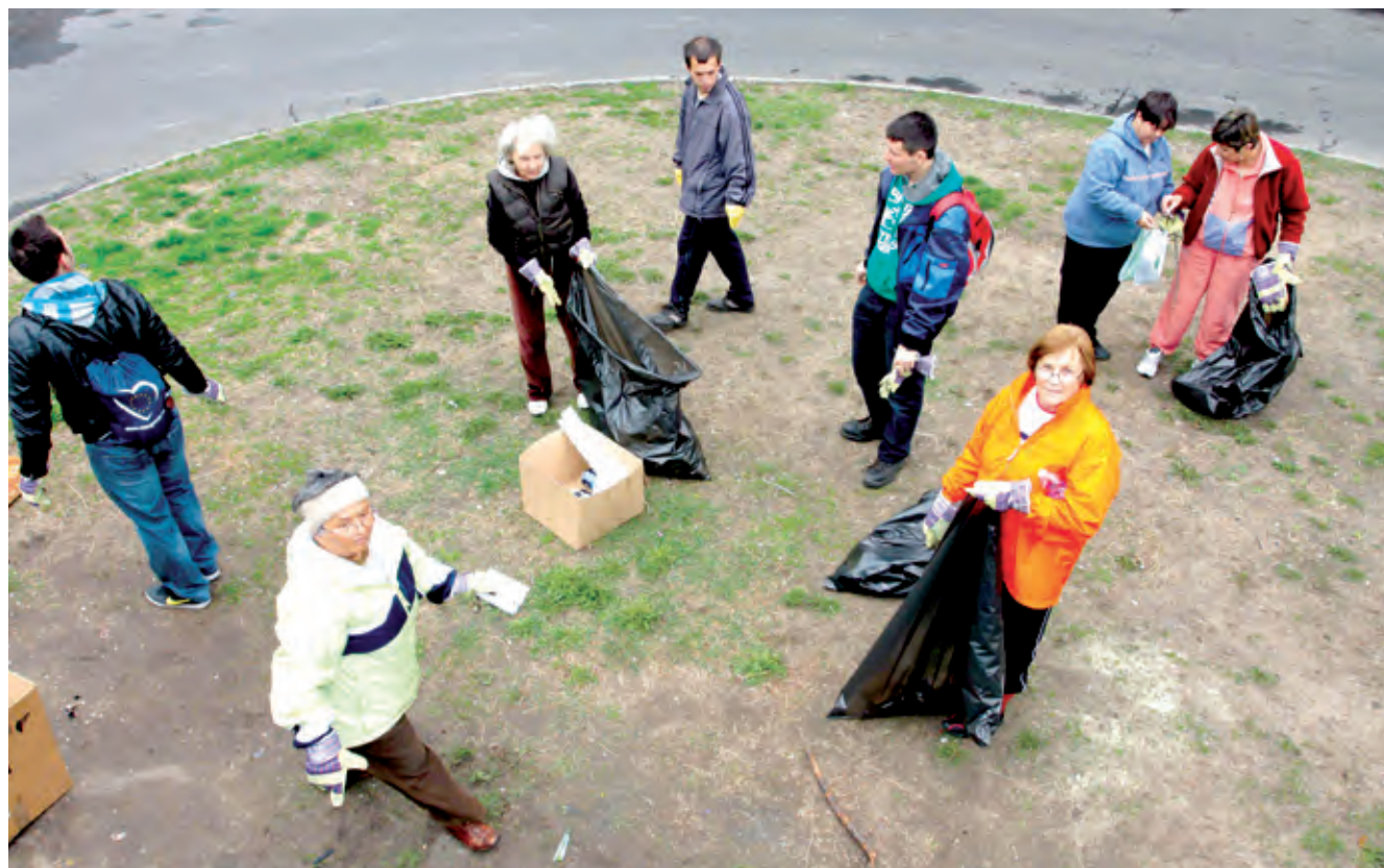
Összefogással idén is szebbé tehetjük környezetünket

A kerület 15 helyszínén várják a polgárokat a nagytakarításra