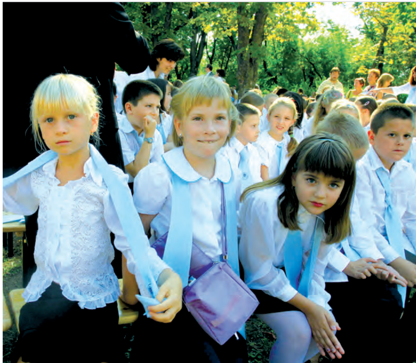
A beiratkozáskor már nyilvánvaló volt, hogy a nagyobb gyereklétszámmal is megbirkóznak az iskolák

27 főben határozza meg. S bár pedagógiai szempontból ez a limit mindenképpen érthető,