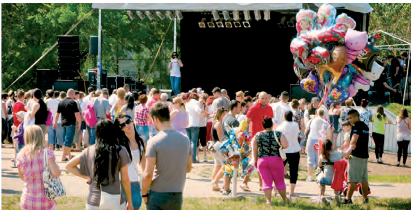
A környező házak lakóinak igényeit figyelembe véve új helyen lesz a Nagyszínpad

A majálisi kavalkádot felkészít két színpadon szórakoztatják majd a nap sztárvendégei, akik között ott lesz a stand up comedy elsősorban autók hangjainak utánzásáról ismert