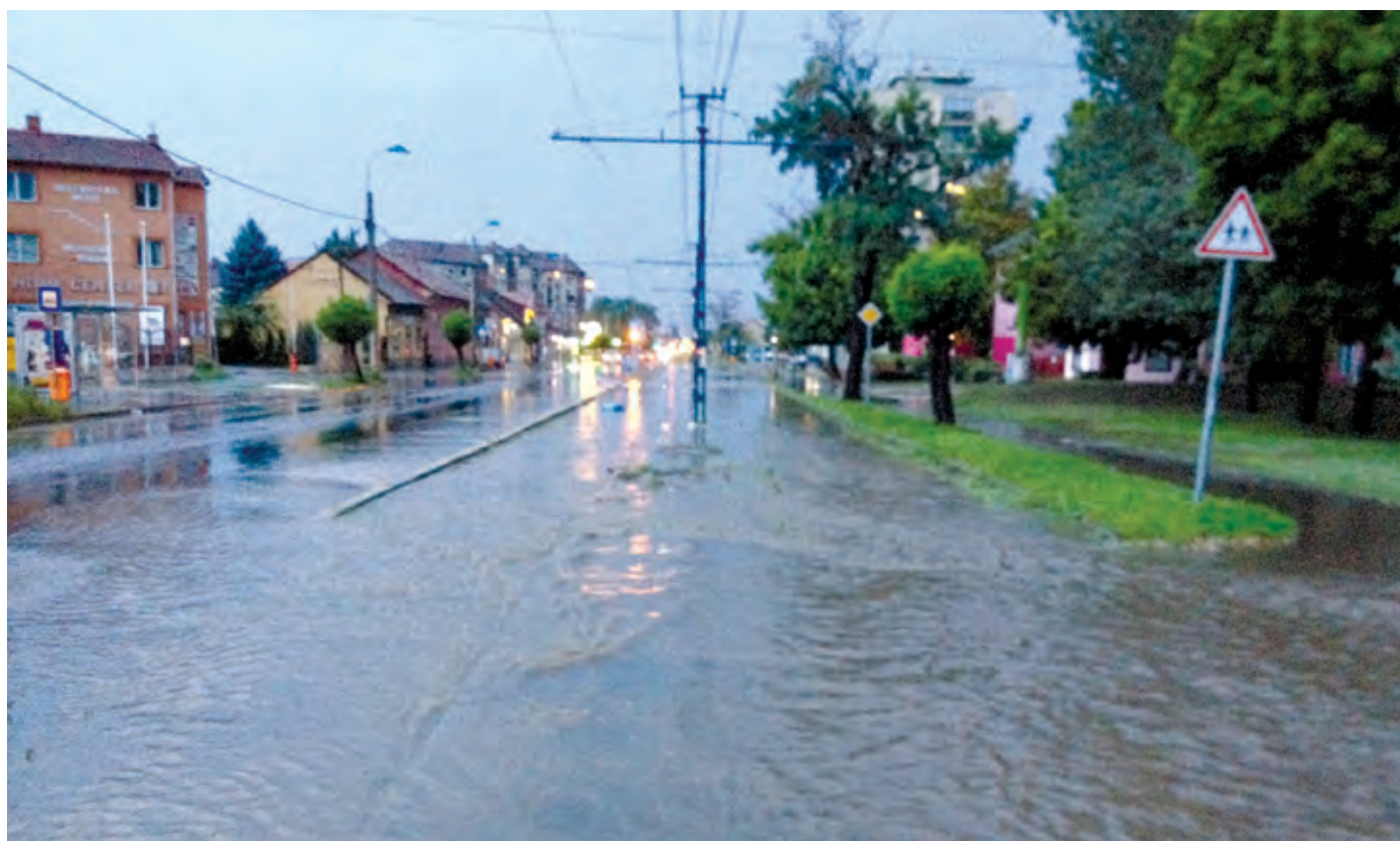
A várhatóan még idén megkezdődő csatornázás remélhetően végleg megoldja a csapadékvíz elvezetését

A kerület sürgeti a csapadékvíz-elvezetés mielőbbi megoldását