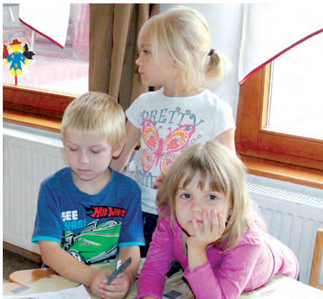
A korszerűbb intézmények több apróságot fogadhatnak majd

A Fővárosi Közgyűlésben már 2003 decemberében napirenden volt Budapest teljes csatornázásának ügye. A projekt megvalósításához megbízható pénzügyi alapot kínáltak az akkor megnyíló uniós források, ezért az eredeti tervek szerint 2010-re elkészültek volna a munkálatokkal. A pályázati feltételek azonban közben változtak, így lehetőség nyílt arra, hogy a főváros egy átfogóbb projektre nyerjen pénzt. Egy közgyűlési határozat egyesítette a korábban kidolgozott „Budapest teljes körű csatornázásának befejező szakasza”