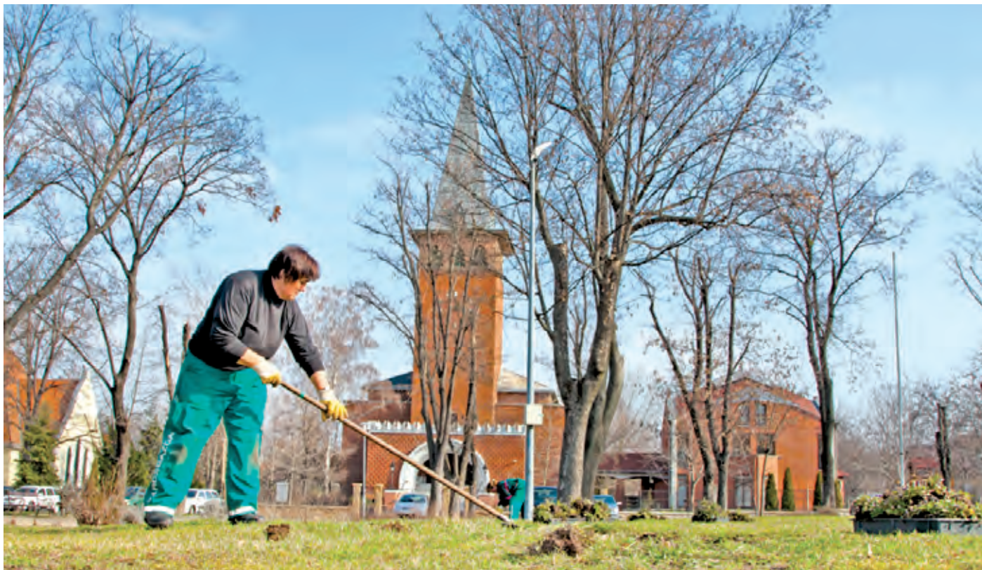
Áprilisban folytatódhat a március elején megkezdett, illetve az egész évben folyamatos pázsittakarítás

A szelektív hulladékgyűjtők kihelyezése és környezetük rendben tartása a kerületben élők és a kerületért dolgozók számára egyaránt fontos. Tavaly lakossági igényként felmerült, hogy az Építők utca 6. szám elé helyezzenek ki egy új gyűjtőszigetet. Ennek megvédéséhez Ká-