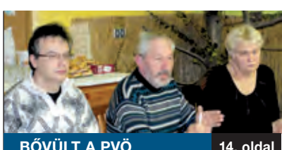
BŐVÜLT A PVŐ

Immár tizenharmadik éve rendezik meg a Gyermekek és Ifjúsági Művészeti Találkozók programsorozatának keretében a középszintű képző-, ipar- és fotóművészeti kiállítását. Az elmúlt években a pályázat olyan népszerűvé vált, hogy a fővároson kívül az ország különböző vidékeiről, településeiről is érkeztek pályaművek, ezért országos szintűre bővítették a felhívást.