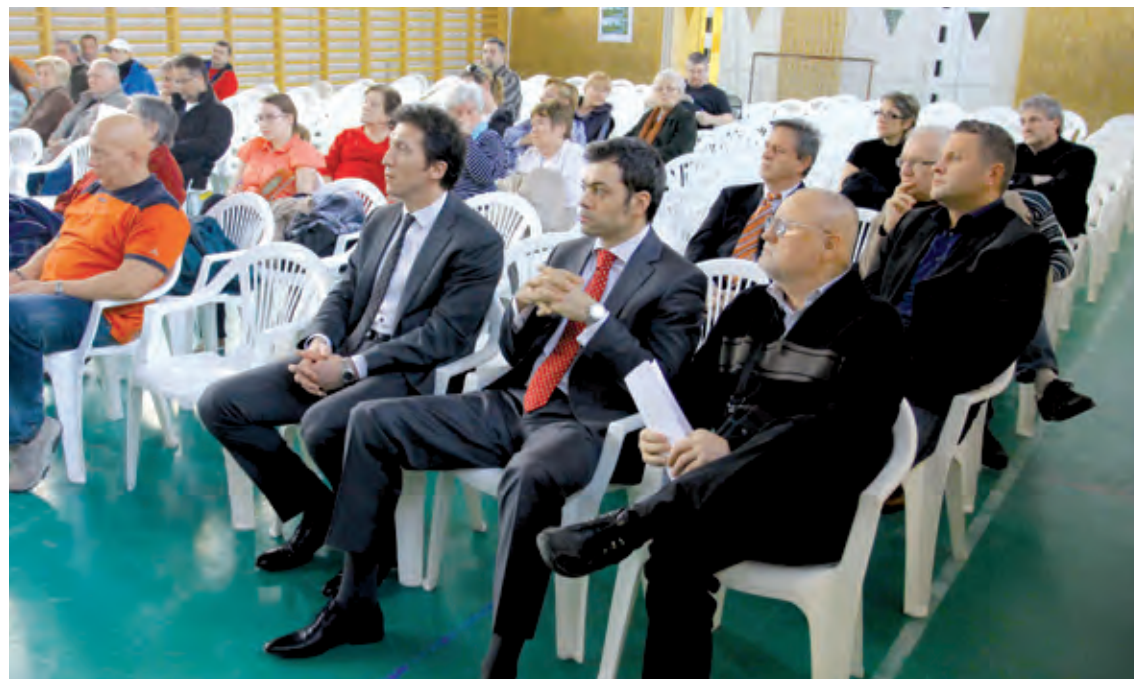
A lakossági fórum csupán egy lépés a megnyugtató rendezés érdekében

A nyugalmaikat féltik a Hunyadi utca környékén élők