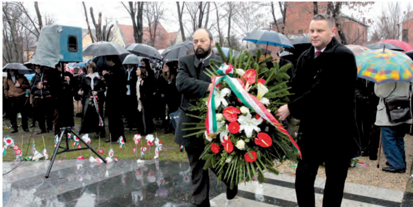
A Kossuth téren az önkormányzat vezetői mellett a civil szervezetek is koszorúztak