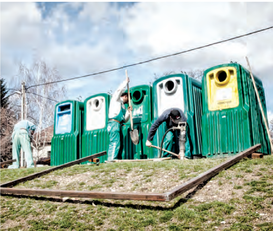
Az önkormányzat meg akarja akadályozni a szelektív szigetek szétművelését