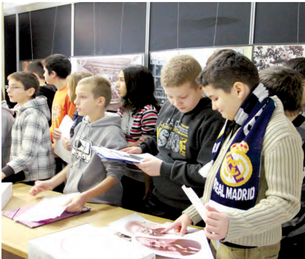
A diákok érdeklődve tanulmányozták a kerület nagyjainak portréit