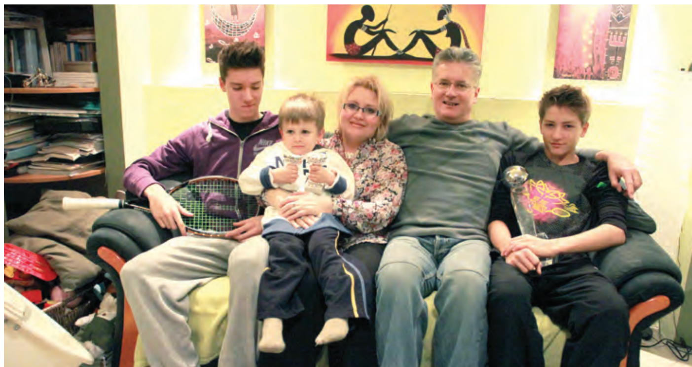
Valkuszék mindennapjai szigorúan telnek, a szülők céltudatosságát a gyerekek is elsajátították

Ahol a családi összetartozás is mozgatója a sportsikereknek