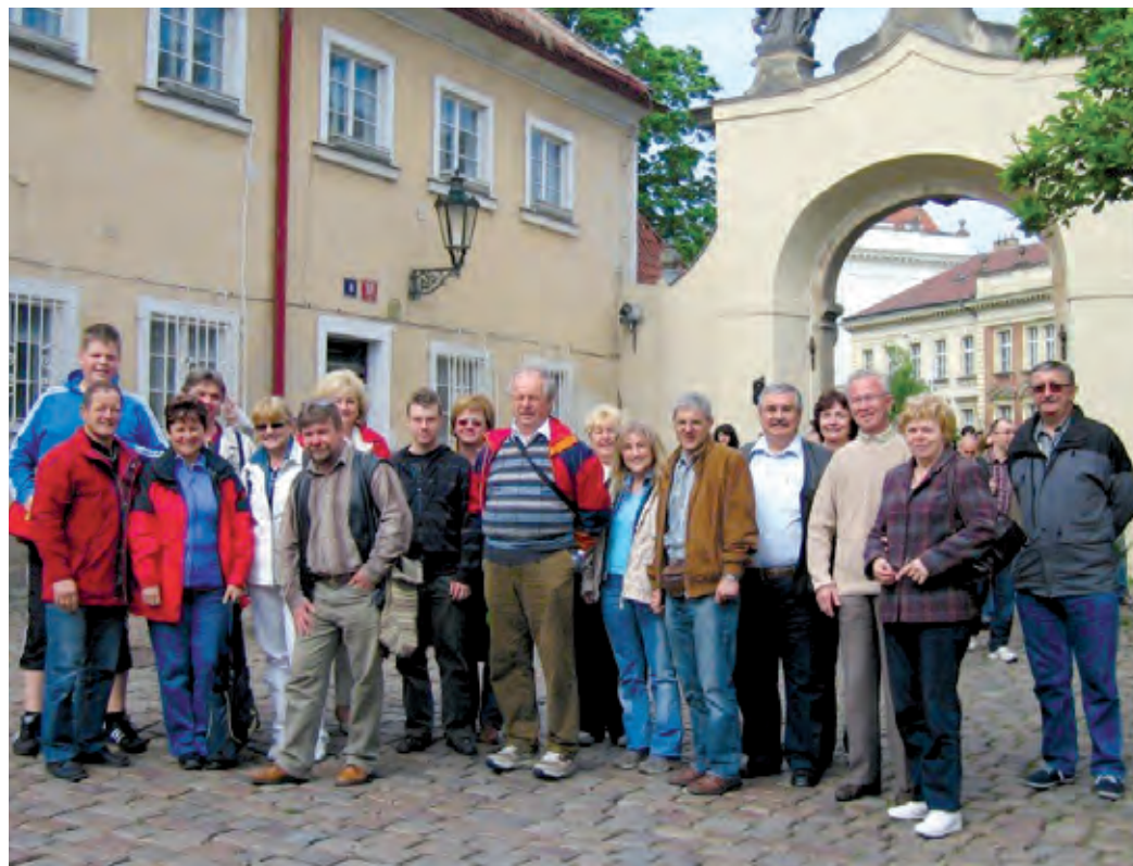
A Lions Klub tagjai az összefogást nem csak egymás között képzelik el, másoknak is folyamatosan segítenek

A klubok munkája önkéntes alapon zajlik, minden országnak készséggel fordítja idejét és energiáját a jó ügyek megsegítésére. A szervezet etikai kódexében fontos helyet foglal el a diszkriminációmentesség. Vallás- és ideológiamentes, így soraiban