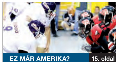
EZ MÁR AMERIKA?

A kerületi Vajk-sziget, a kőbányai Szent László és a józsefvárosi Losonci téri általános iskola diákjai január 25-én délelőtt – a hivatalos rajt előtt – búcsúztatták a Budapest-Bamako-ralin induló Go Trabi Go – 2013 névre keresztelt csapatot Kőbányán. A rali során a résztvevők mintegy 30 tonna ajándékot visznek Nyugat-Afrika szegélyeinek.