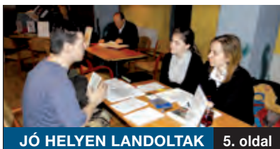
JÓ HELYEN LANDOLTAK

Rendkívül gyorsan segített a kerületi önkormányzat a Fáy utca 2. szám alatt élőknek, ahol 59 önkormányzati lakás található. Január 22-én este gázzelvezetés miatt kerültek bajba a lakók. A fűtés nélkül maradt lakásokat 23-án már villanyradiátorok vagy PB-gázzal működő biztonságos kályhák melegítették. A vezetékek felújítása egy hét alatt elkészült.