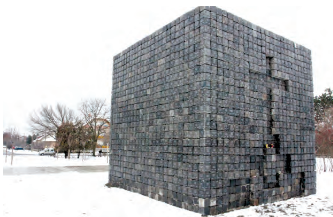
Az emlékművön már kijavították a „sebeket”, ám a rongálók bárhol felbukkanhatnak

Még keresik az 1956-os emlékmű megrongálóját