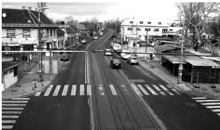
Felsővezetékek árnyékában: a Kolozsvár utca és mellette jobbkézre a piac 2013-ban

A másik pedig, hogy vezetékes vízszolgáltatás ekkoriban egyedül a MÁV-telepen volt, a nyilvános vécét pedig a Rákos út és Wesselényi utcák sarkán kívánták felállítani, a MÁV-val kötött szerződés alapján. Hogy más megoldás volt-e az 1930-as években – például emésztőgödör –, arról nem maradt fenn adat.