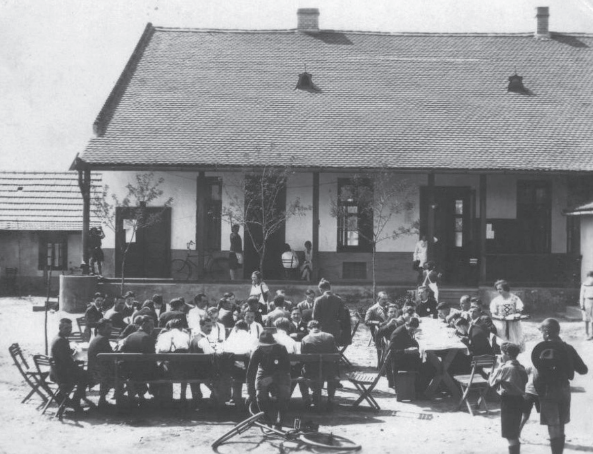
Kerti alkalom az iskola előtt a templomudvaron

négyszögöl földet vásároltak, amelyből viszont 1629 négyszögöltre nem volt szüksége az egyháznak, amint ezt már a vásárlás idején kimondták. A megvétel után eladandó telek bevételét (amely a Kinizsi és a Földváry 10 utcák közötti részen volt, amelynek a parcellázásáról és eladásáról nem-sokára döntöttek is), illetve a község által adott terület értékesítéséből származó összeget levonva a vételár 2 forint 52 krajcárba került, amely a presbitérium szerint igen olcsó volt. 11