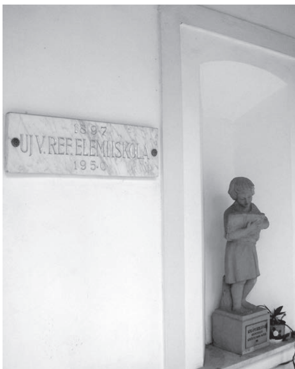
A bibliolvasó kislány és az iskola emléktáblája