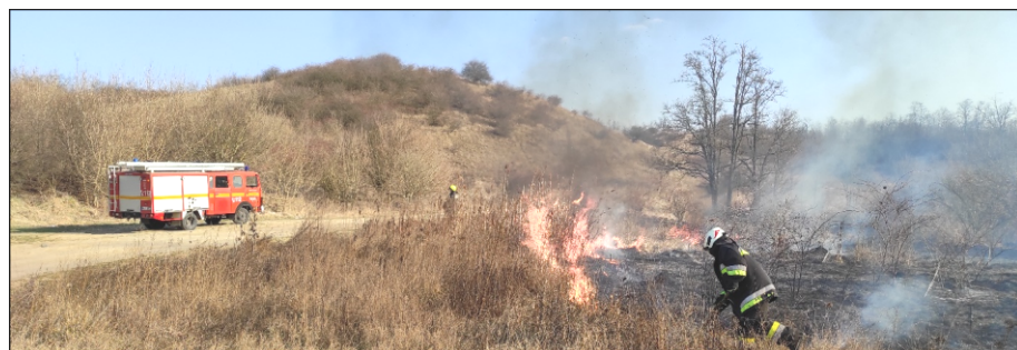
1. kép: A 2022. március 19-i tűz oltása

Egy szép szombati napon óriási fekete füstfelhőre lettem figyelmes a falutól dél-keletre. Mire odaértem, már két tűzoltóautó volt a helyszínen, a tűzoltók pedig már megkezdték az oltást. Másnap újra ki kellett vonulniuk, mert az intenzívebb füstölés újraindult.